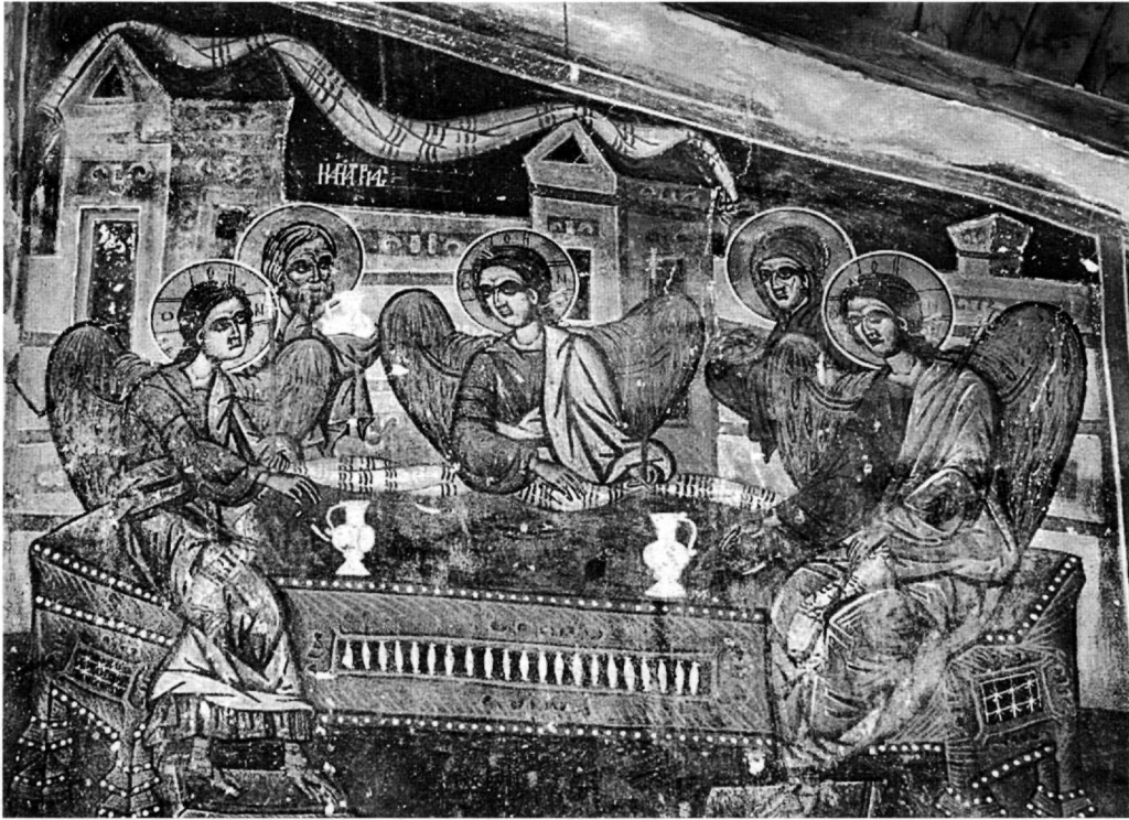
Εικ. 3. Ναός Αγίου Γεωργίου Γραμματικού. Η Φιλοξενία του Αβραάμ.

Στο οψιμότερο έργο του, στον Άγιο Προκόπιο, υιοθετείται συχνότερα η παλαιότερη εικονογραφική παράδοση της Μακεδονίας και των βορειότερων περιοχών, όπως επιβιώνει σε έργα του βορειοελλαδικού χώρου και τοπικών εργαστηρίων κατά τη μεταβυζαντινή περίοδο 16 , ιδιαίτερα σε ναούς του δεύτερου μισού του 16ου και των αρχών του 17ου αιώνα της περιοχής δικαιοδοσίας του πατριαρχείου του Ρεσί 17 . Μοναδική, από όσο μπορούμε να γνωρίζουμε, στη μεταβυζαντινή