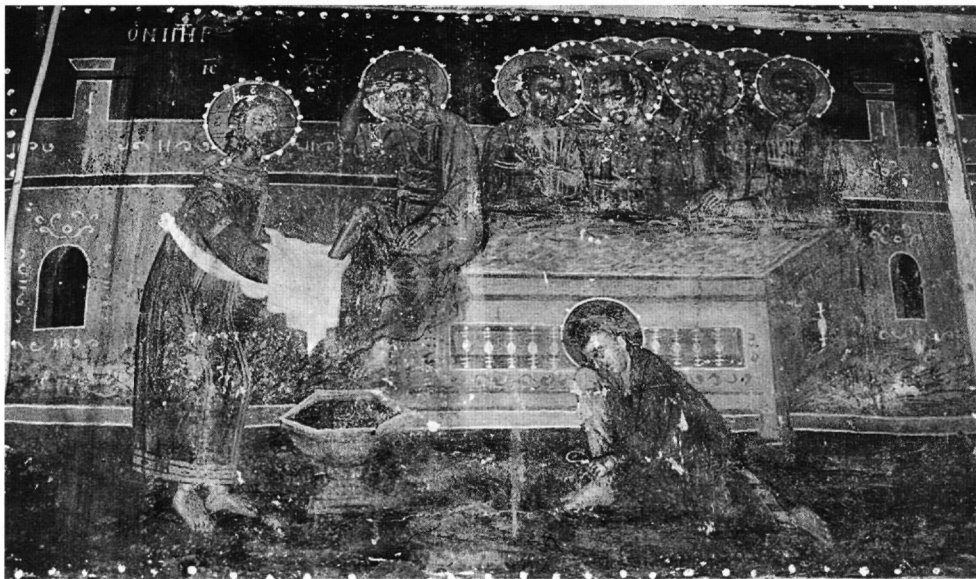
Εικ. 5. Ναός Αγίου Νικολάου Γούρνας. Ο Νιπτήρας.

ριόδου (Εικ. 5). Ενίοτε υιοθετούνται σπανιότεροι τύποι της παλαιολόγειας και της μεσοβυζαντινής περιόδου 29 . Τις περισσότερες φορές δημιουργεί πρωτότυπες συνθέσεις συνδυάζοντας ποικίλα πρότυπα ή εισάγοντας νέα μοτίβα 30 .