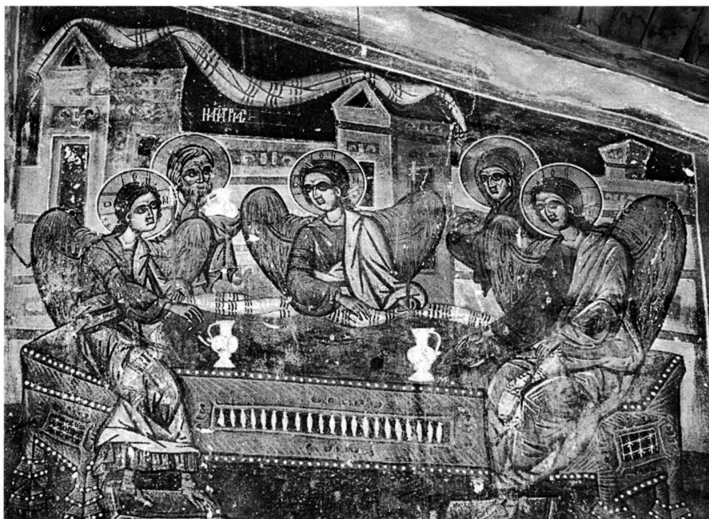
Εικ. 3. Ναός Αγίου Γεωργίου Γραμματικού. Η Φιλοξενία του Αβραάμ.

Στο οψιμότερο έργο του, στον Άγιο Προκόπιο, υιοθετείται συχνότερα η παλαιότερη εικονογραφική παράδοση της Μακεδονίας και των βορειότερων περιοχών, όπως επιβιώνει σε έργα του βορειοελλαδικού χώρου και τοπικών εργαστηρίων κατά τη μεταβυζαντινή περίοδο 16 , ιδιαίτερα σε ναούς του δεύτερου μισού του 16ου και των αρχών του 17ου αιώνα της περιοχής δικαιοδοσίας του πατριαρχείου του Ρεσί 17 . Μοναδική, από όσο μπορούμε να γνωρίζουμε, στη μεταβυζαντινή