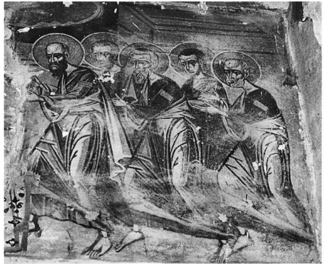
Εικ. 6. Ναός Αγίας Παρασκευής. Η Κοίμηση της Παναγίας. Λεπτομέρεια.

Ιδιαίτερα σημαντική κρίνεται η παρουσία στην πόλη αυτή την εποχή ενός ζωγράφου από την περιοχή της Καστοριάς, που φιλοτεχνεί τις τοιχογραφίες του 1683 στο ναό της Αγίας Παρασκευής (Εικ. 6). Στην καταγωγή του οφείλεται και η προσκόλλησή του σε εικονογραφικούς τύπους που επιχωριάζουν σε μεταβυζαντινούς ναούς της Δυτικής Μακεδονίας και της Καστοριάς, και ανάγονται στην τοπική παράδοση του 14ου-15ου αιώνα των βόρειων όμορων περιοχών της Βαλκανικής (αναχωρητές άγιοι, Ταξιάρχες, προφήτης Ηλίας) ή στην παράδοση της τοπικής ηπειρωτικής σχολής (Προδοσία) 56 . Επιμέρους τεχνοτροπικές και εικονογραφικές συγκρί-