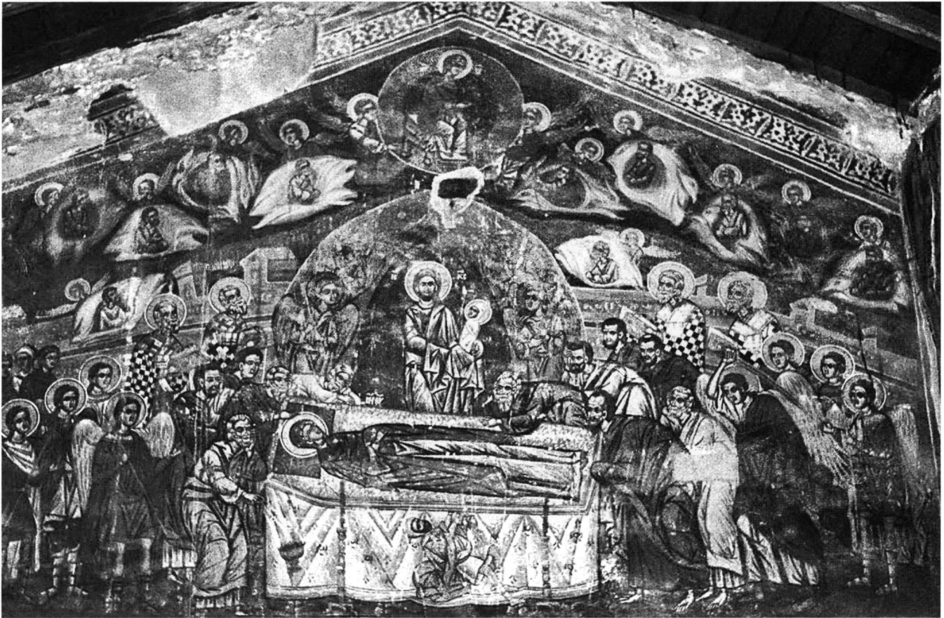
Εικ. 2. Ναός Αγίου Γεωργίου Γραμματικού. Η Κοίμηση της Παναγίας.

κό σχήμα εμπλουτίζεται με εικονογραφικές λεπτομέρειες από την τοπική παράδοση της πόλης και της ευρύτερης Μακεδονίας, ιδιαίτερα του δεύτερου μισού του 16ου αιώνα (Εικ. 2) ή την αμέσως παλαιότερη, του 14ου-15ου αιώνα 12 . Την τοπική παράδοση ο ζωγράφος υιοθετεί ατόφια σε άλλες συνθέσεις του 13 χωρίς να εκλείπουν οι αρχαϊσμοί 14 (Εικ. 3) και οι προσωπικές παρεμβάσεις-καινοτομίες σε δευτερεύοντα στοιχεία,