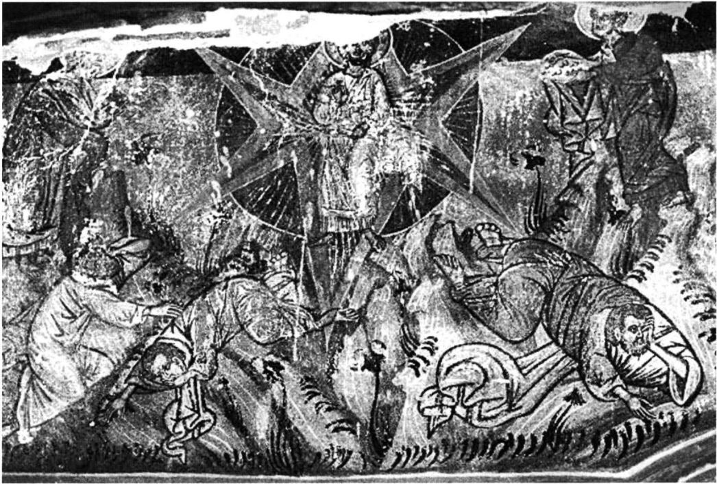
Εικ. 1. Ναός Αγίου Γεωργίου Γραμματικού. Η Μεταμόρφωση του Σωτήρος.

Ανώνυμου Α', σύμφωνα με την κατάταξη που επιχείρησε ο Θ. Παπαζώτος 8 , και του κύκλου του κατά το χρονικό διάστημα 1565-1580 εμπλουτίζοντάς την με νέα εικονογραφικά θέματα (βίοι προφήτη Ηλία, Ιωακείμ και Άννας, Βρεφοκτονία, κύκλος Γένεσης, σπάνιες μορφές επισκόπων) και ανανεώνοντάς την με νέους τεχνικούς τρόπους που συμβαδίζουν με ανάλογες προσεγγίσεις των καλλιτεχνών στη γειτονική Σερβία στα όρια της δικαιοδοσίας του πατριαρχείου του Ρεσ 9 .