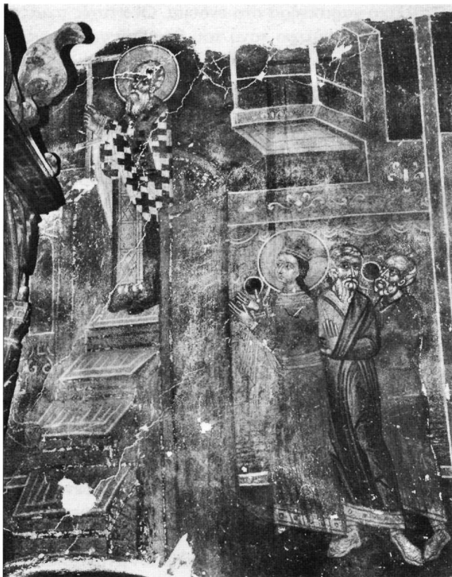
Εικ. 4. Ναός Αγίου Νικολάου Γούρας. Η Ύψωση του Τίμου Σταυρού. Λεπτομέρεια.