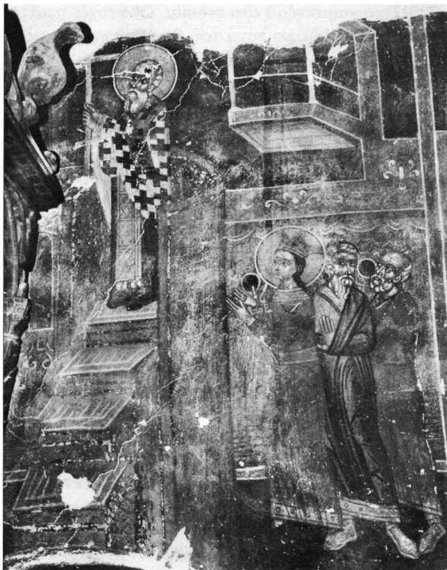
Εικ. 4. Ναός Αγίου Νικολάου Γούρας. Η Ύψωση του Τιμίου Σταυρού. Λεπτομέρεια.

Συλλογή Εικόνων της Βέροιας εντοπίσαμε μια εικόνα του αγίου Αθανασίου (αριθ. ευρ. Ε5), άγνωστης προέλευσης, που μπορεί με ασφάλεια να θεωρηθεί έργο του ζωγράφου μας. Στο ίδιο εργαστήριο ή στον ίδιο ζωγράφο αποδίδονται η β' όψη εικόνας στη Συλλογή της Μητρόπολης Βεροίας από το ναό του Αγίου Στεφάνου, όπου παριστάνεται ο άγιος Δημήτριος έφιππος να φονεύει τον Σκυλογιάννη, και η εικόνα με τους αποστόλους Πέτρο και Παύλο στη ράχη του επισκοπικού θρόνου στο ναό της Παναγίας Φανερωμένης (Χρ. Μαυροπούλου-Τσιούμη, Βυζαντινές εικόνες από την καρδιά της Ελλάδος. Βυζαντινές και μεταβυζαντινές εικόνες της Βέροιας , Θεσσαλονίκη - Βέροια 2003, αριθ. 1β, σ. 42-43 και αριθ. 22, σ. 106-107).