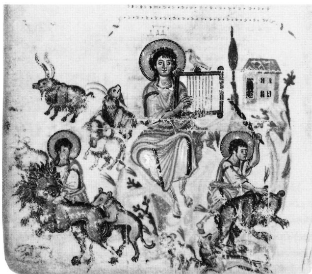
Εἰκ. 7. Μόσχα, Κρατ. Ἱστορ. Μουσείο, ἑλλην. κώδιξ 129 (9ος αἰ.), φ. 147β.

οἷον γὰρ ἐπὶ τοῦ πλήκτρον γίνεται τοῦ τεχνικῶς ἀπτομένου τῶν τόνων καί τὸ μέλος ἐν τῇ ποικιλίᾳ τῶν φθόγων προάγοντος, ὡς εἶγε μονοειδῆς τις ἐν πᾶσιν ὁ φθόγος ἦν, οὐδ' ἂν συνέστη πάντως τὸ μέλος· οὕτως καί ἡ τοῦ παντός κρᾶσις ἐν ποικίλοις τῶν καθ' ἕκαστον ἐν τῷ κόσμῳ θεωρουμένων διά τινος τεταγμένον τε καί ἀπαράβατου ἔνθμου αὐτῆ ἐαυτῆς ἀπτομένη καί τὴν τῶν μερῶν πρός τὸ ὄλον εὐαρμοσίαν ἐργαζομένη τὴν παν-