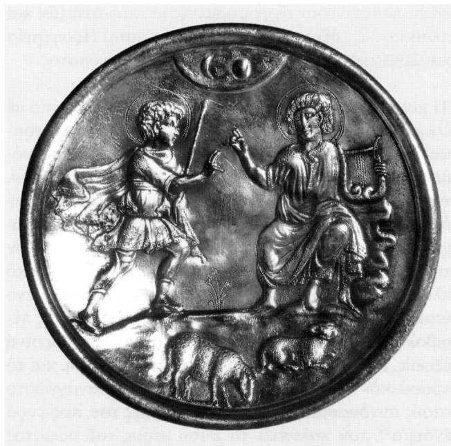
Εἰκ. 2. Λευκωσία, Κυπριακό Μουσείο, ἀργυρό πινάκιο (613-629).

Μολονότι νοούμενη ἐπικεφαλῆς μιᾶς ἀκολουθίας παραστάσεων μέ συνεχόμενες πτυχές, ἡ μικρογραφία τοῦ κώδικος 139, μέ τήν ἐπάρκεια τῶν δηλώσεων πού διαθέτει καί μέ ταυτόχρονη τήν παρουσία τῆς Μελωδίας νά ὀρίζουν τήν αὐτονομία της, ἀποτελεῖ αὐθύπαρκτη εἰκόνα ἐμπνεόμενου συγγραφέα. Ἐνῶ στό ἀρχαιότερο κατά τρεῖς αἰῶνες πινάκιο τῆς Λευκωσίας, ἡ παριστώμενη σκηνή, μολονότι θά μπορούσε καί ἐκείνη νά τεθεῖ ἐπικεφαλῆς μιᾶς ἀφηγηματικῆς σειρᾶς, παραπέμπει ἀπευθείας σέ συγκεκριμένο βιβλικό περιστατικό (ἐμμέσως εἰκονογραφούμενο: Βασιλ. Α' 16, 19). Ὡστόσο, τό ἐν λόγῳ συμβάν, ὅπωςδῆποτε γνώριμο σέ ζωγράφο καί