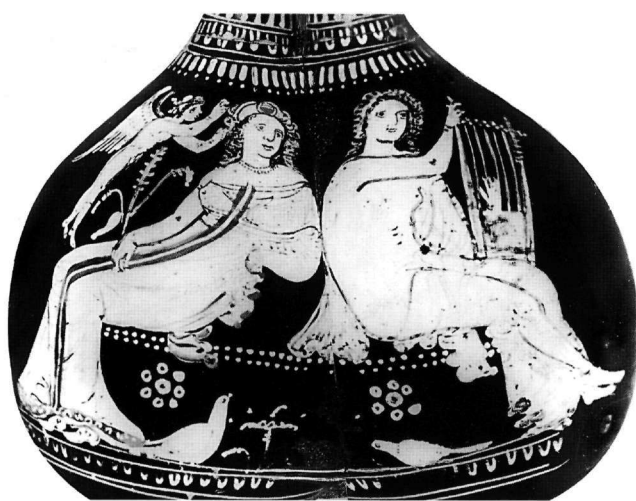
Εἰκ. 5. Lecce, Museo Provinciale, ἀγγεῖο (4ος-3ος αἰ. π.Χ.) ἀπό τήν ἀρχαία Γναθία.

Χρειάζεται λοιπόν μία ἐγγύτερη, ἀπευθείας ἐξέταση τοῦ κώδικος –ἐνός ἐξαιρετικά δυσπρόσιτου φορητοῦ μνημείου, λόγω τῆς εὐπάθειας, ἀλλά καί τῆς σπουδαιότητάς του– στήν ὕλική καί τή ζωγραφική του ἐμφάνιση, καί στά ἐπιμέρους ἐρμηνευτικά σχόλια τοῦ κειμένου τῶν ψαλμῶν πού περιέχει· κάτι πού στάθηκε εὐχερέστερο γιά τούς παλαιότερους, ἐνώπιον τοῦ χειρογράφου ἀναγνώστες καί ἐρευνητές (Omont 1929, Weitzmann