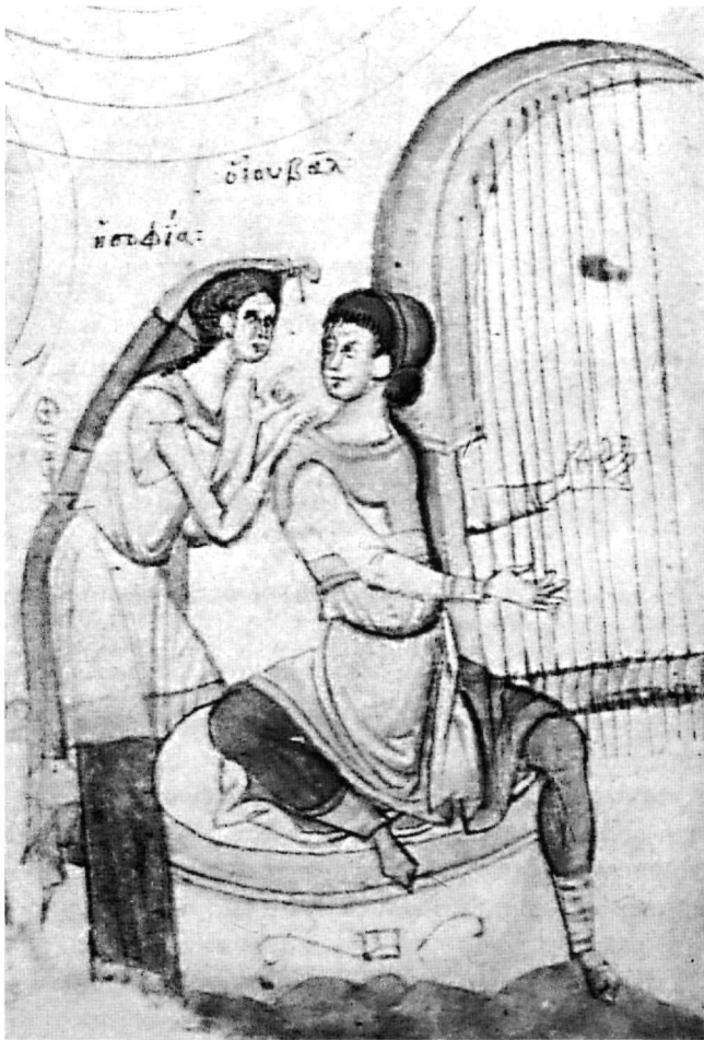
Εἰκ. 6. Κώδιξ Marcianus graecus 516 (14ος αἰ.), φ. 140β.