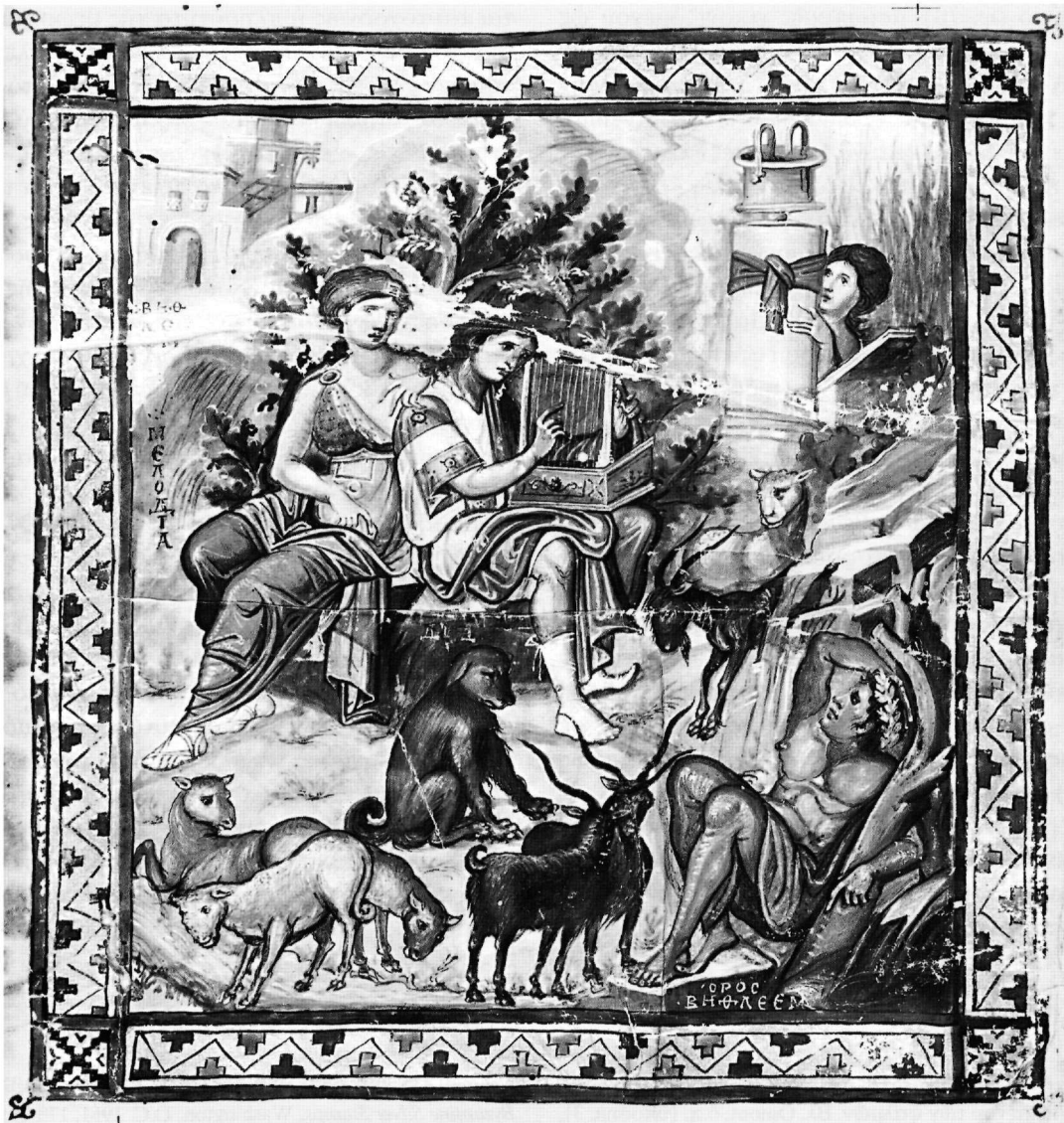
Εἰκ. 1. Κώδιξ Parisinus graecus 139 (10ος αἰ.), φ. 1β.

της καί μελανόχρωμης (ὅπως καί τό ἐνεργούμενό της ἄτομο, ὁ Γολιάθ) Ἀλαζονείας (ΑΛΑΖΟΝΕΙΑ)· ἡ ἀναμέτρηση καταλήγει στόν ἀποκεφαλισμό τοῦ «ἄλλοφύλου», μέ αὐτόπτες μάρτυρες νά ἐντάσσονται ἐκατέρωθεν τῶν δύο φάσεων, τοὺς συντασσόμενους σέ δύο ὄμιλους ὀπλίτες (ΙΣΡΑΗΛΙΤΑΙ / ΑΛΛΟΦΥΛΟΙ) πού πλαισιώνουν τήν παράσταση (φ. 4β) 9 .