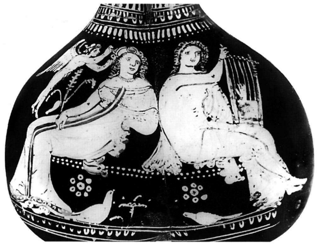
Εικ. 5. Lecce, Museo Provinciale, άγγείο (4ος-3ος αι. π.Χ.) από τήν άρχαία Γναθία.

Χρειάζεται λοιπόν μία έγγύτερη, άπευθείας εξέταση του κώδικος –ένός έξαιρετικά δυσπρόσιτου φορητού μνημείου, λόγω της εϋπάθειας, αλλά και της σπουδαιότητάς του– στην ύλική και τή ζωγραφική του εμφάνιση, και στα έπιμέρους έρμηνευτικά σχόλια του κειμένου τών ψαλμών που περιέχει· κάτι που στάθηκε εϋχερέστερο για τούς παλαιότερους, ένώπιον του χειρογράφου άναγνώστες και έρευνητές (Omont 1929, Weitzmann