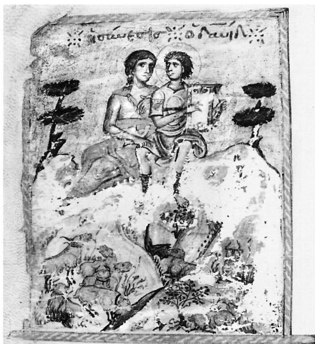
Εἰκ. 3. Κώδιξ Marcianus graecus 565 (λήγ. 11ος αἰ.), φ. 51β.

Διευρύνοντας περαιτέρω τό ἀναγνωστικό πεδίο θά ἐντάσσαμε στήν ἀναγνώρισή μας (μέ ἀκολουθίες ἐνδιάμεσων μεταξύ τους ἔργων) ὅχι μόνο προγενέστερες συνθέσεις, μέ αἰσθητά ἀπώτερη—ὄπως, δ.χ., τό ζεῦγος μουσικοῦ καί παρέδρου σέ «βομβύλιο» (18x5,5 ἐκ.) τῆς Κάτω Ἰταλίας (Γναθία < Gnathia), ἀποκείμενο σέ μουσεῖο τοῦ Lecce (Εἰκ. 5) 28 — ἡ πλησιέστερη πρὸς τόν Parisinus εἰκονογραφική καί ἐννοιολογική καταγωγή, ἀλλά καί μεταγενέστερες, μέ διαφορετικά τά μετέχοντα πρόσωπα, κινούμενα ὡστόσο στό «πνεῦμα» ἐνός κοινοῦ μηχανισμοῦ: ὄπως, δ.χ., στό κάτω δεξιό τέταρτο ὁλοσέ-