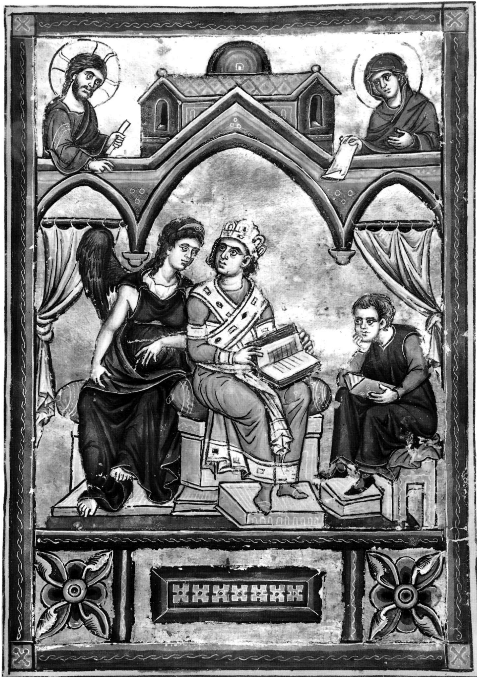
Εἰκ. 4. Παρίσι, Bibl. de l' Arsenal , κώδιξ 5211 (π. 1250), φ. 307.

πρός τόν καθήμενο Ἰουβάλ (ὁ ιουβάλ ) γιά νά τόν κα- τευθύνει ἐκ τοῦ σύνεγγυς στό ἔργο του, μέ δηλωτικές κι- νήσεις: οὗτος ἦν ὁ καταδείξας ψαλτήριον καί κιθάραν (Γέν. 4, 21) 31 .