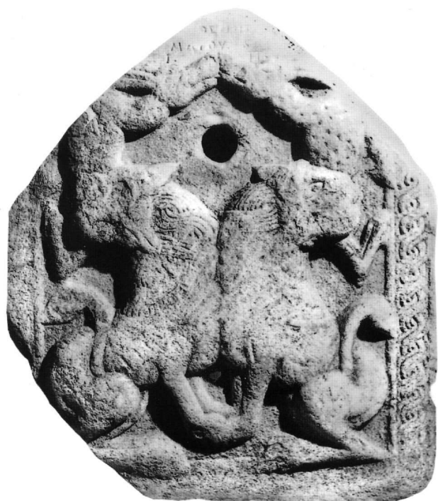
Εικ. 11. Τμήμα αμφίγλυφου θωρακίου (Αε. 26).

κετά έξεργο και η επιφάνειά του φθαρμένη. Διακρίνεται η χαιτή των λιονταριών που αποδίδεται με πλοχμούς, ενώ τα σώματα με εγχαράξεις. Οι ουρές τους περνούν ανάμεσα από τα σκέλη. Το δέρμα στα σώματα των λαγών δηλώνεται με κουκκίδες.