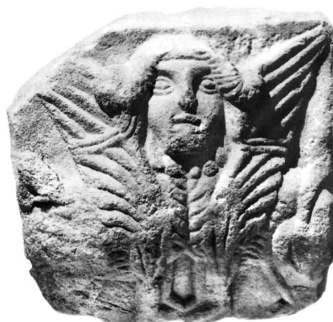
Εικ. 1. Επίθημα κιονίσκου παραθύρου (Αε. 23, Αεκ. 894).

Στη στενή λοξότμητη πλευρά εικονίζεται δισώματη σφίγγα. Έχει μεγάλο γυναικείο κεφάλι με μακριά κόμη που χωρίζεται σε δύο συστρεφόμενους πλοκάμους. Εκατέρωθεν της κεφαλής διατάσσονται τα δύο σώματα περρωτών