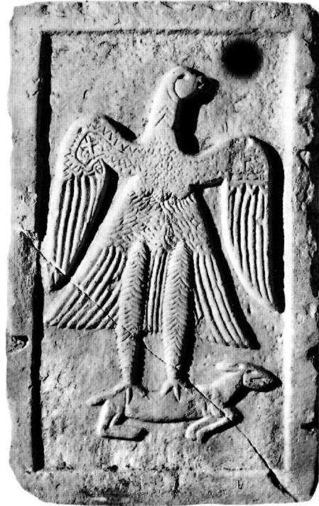
Εικ. 5. Θωράκιο (Αε. 7, Αεκ. 137).

Το θέμα του ιπτάμενου αετού, που αρπάζει στα νύχια του μικρό τετράποδο, αποτελεί παλαιό ανατολικό θέμα που διατηρήθηκε στη βυζαντινή διακοσμητική 27 . Η στά-