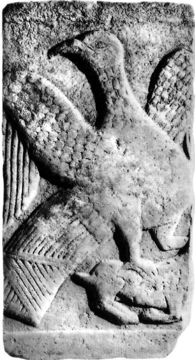
Εικ. 4. Τμήμα πλάκας (Αε. 123, Αεκ. 931).