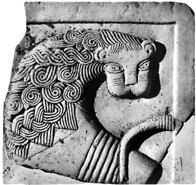
Εικ. 10. Τμήμα θωρακίου (Αε. 6, Αεκ. 145).

Το γλυπτό θυμίζει έντονα τα θωράκια του Βυζαντινού και Χριστιανικού Μουσείου αριθ. ΒΜ. 124 και 140, που έχουν χρονολογηθεί στο 10ο αιώνα 59 , καθώς επίσης και το λιοντάρι σε υπέρθυρο που βρέθηκε κατά τη διάρκεια των αναστηλωτικών εργασιών στο τζαμί του Σταροπάζαρου 60 και έχει χρονολογηθεί στο 10ο-11ο αιώνα. Ανάλογα είναι και τα εντοιχισμένα θωράκια στο ναό της Παναγίας Γοργοπηκούς στην Αθήνα, που χρονολογούνται στο 12ο αιώνα 61 , και το θωράκιο από τη Ροτόντα Θεσσαλονίκης, που χρονολογείται στο 10ο αιώνα 62 . Η απόδοση του σώματος του λέοντα με βαθιές παράλληλες γραμμές συναντάται και στα σώματα τετραπόδων (μοσχαριών) σε υπέρθυρο του Βυζαντινού και Χριστιανικού Μουσείου, που χρονολογείται στον 11ο-12ο αιώνα 63 . Εντυπωσιακή είναι η ομοιότητα του λέοντα με την υδρορροή που έως πρόσφατα βρισκόταν στο Αρ-