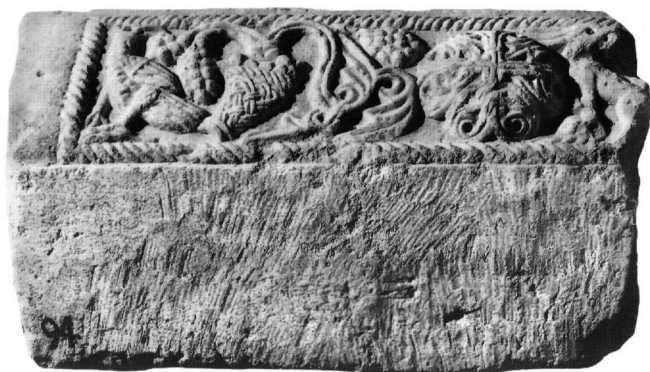
Εικ. 12. Τμήμα επιστολίου τέμπλου (Αε. 94, Αεκ. 135).

Η χρονολόγηση του συγκεκριμένου μέλους στη στροφή από το 12ο στο 13ο αιώνα ενισχύεται και από τη χρήση του σχοινοειδούς πλέγματος 72 , συχνού σε γλυπτά αυτής της περιόδου, όπως λ.χ. σε επίστεψη θωρακίου από τον Άγιο Δημήτριο Κατσούρη 73 στην Άρτα και σε επιστόλιο από το ναό του Σωτήρα Άμφισσας 74 .