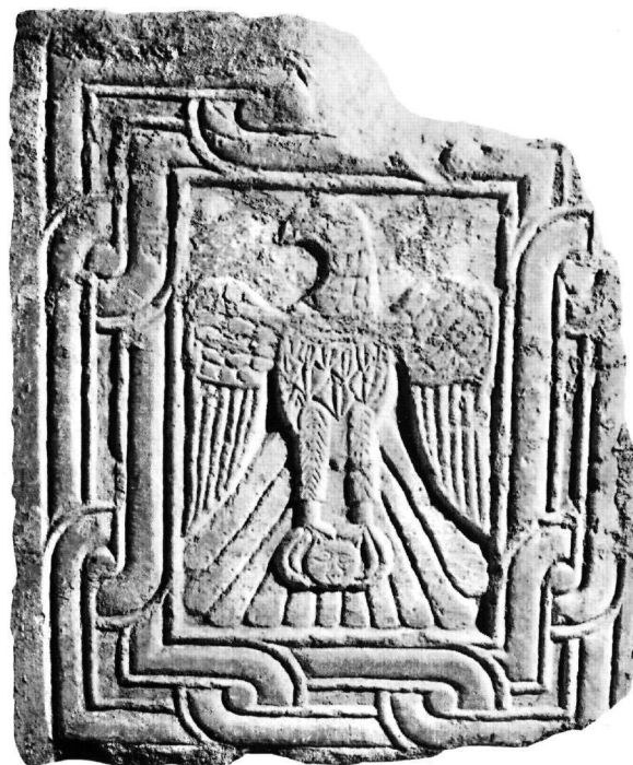
Εικ. 2. Θωράκιο (Αε. 122).

Η παράσταση θυμίζει ανάλογη σε θωράκιο που προέρχεται από τη Θεσσαλονίκη και έχει χρονολογηθεί στους 9ο-11ο αιώνα 14 . Το προσωπίο μοιάζει με τα ανάλογα αποτροπαϊκού χαρακτήρα προσωπία στα θυρώματα