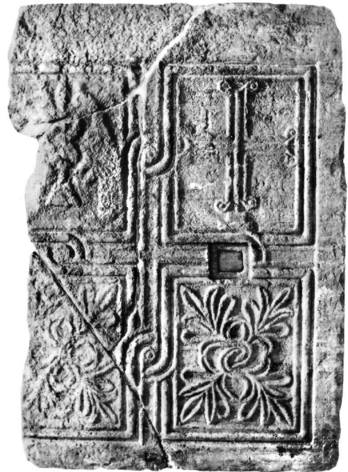
Εικ. 3. Θωράκιο (Αε. 147).

Η απεικόνιση πτηνών και ζώων εκατέρωθεν περιθραντηρίου ή του δέντρου της ζωής χρησιμοποιείται ευρύ-