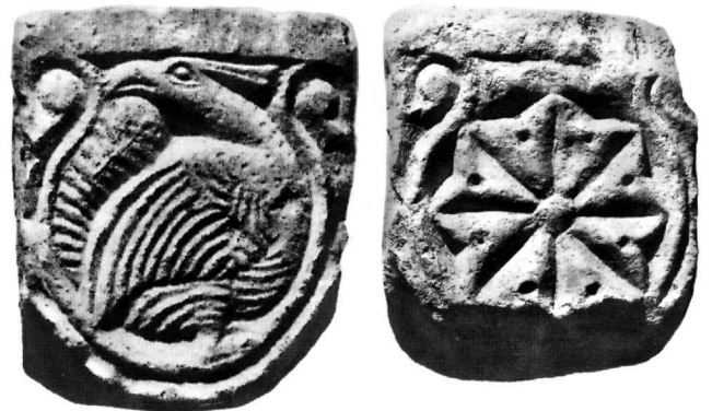
Εικ. 9. Δύο όψεις κιονοκράνου κιονίσκου τέμπλου (Αε. 351).

Η εργασία του αναγλύφου είναι ακριβής και λεπτή, και θυμίζει ανάλογη παράσταση σε άνω τμήμα πεσίσκου