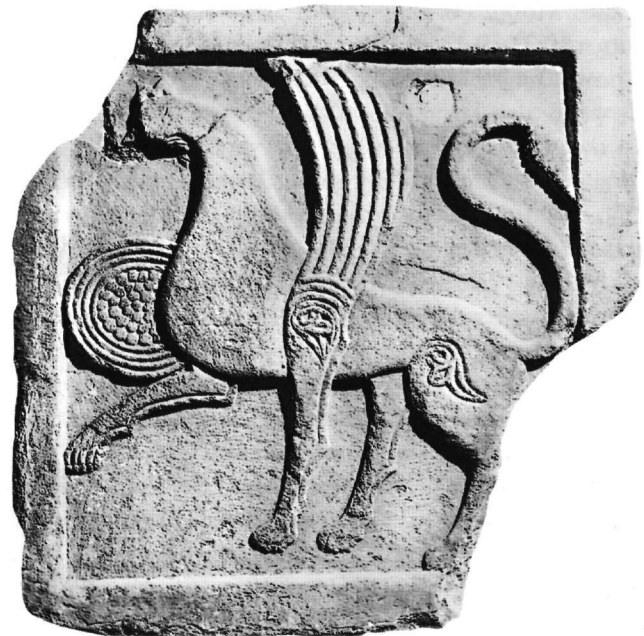
Εικ. 7. Πλάκα (Αε. 12).

ΒΙΒΛΙΟΓΡΑΦΙΑ: Βυζαντινή τέχνη-Τέχνη ευρωπαϊκή , αριθ. 6. G. C. Miles, «Byzantium and the Arabs: Relations in Crete and the Aegean Area», DOP 18 (1964) 29, εικ. 74. M. Chatzidakis, «Griechenland», στο W. F. Volbach - J. Lafontaine-Dosogne (εκδ.), Byzanz und der christliche Osten , PKg, Βερολίνο 1968, 237, αριθ. 175a, εικ. 175a. Grabar 1976, 67-68, αριθ. 60. Μπούρας - Μπούρα 2002, 563, εικ. 557.