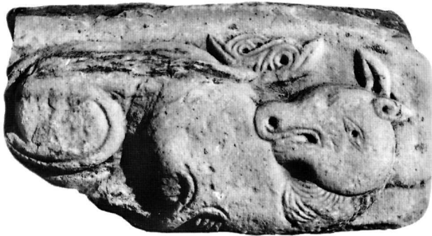
Εικ. 8. Τμήμα επιστυλίου (Αε. 20).