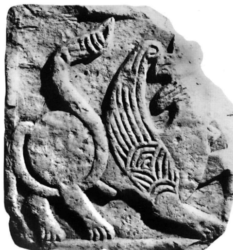
Εικ. 6. Θωράκιο (Αε. 17, Αεκ. 336).

Μέσα σε λεπτό, απλό, επίπεδο πλαίσιο και σε ακόσμητο βάθος εικονίζεται γρύπας που βαδίζει προς τα δεξιά και στρέφει το κεφάλι προς τα πίσω. Έχει το ένα πρό-