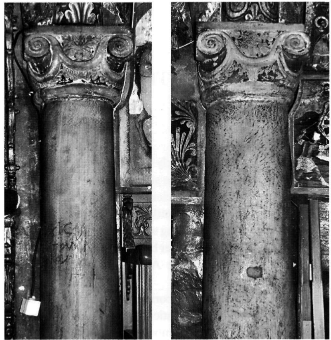
Εικ. 8α-β. Μονή Αρχαγγέλου Μιχαήλ Πανορμίτη. Κίονες στη βόρεια και τη νότια πλευρά του καθολικού.

Μεγαλοπρεπή κτίσματα, όπως ήταν οι βασιλικές, ανηγέρθησαν στη Σύμη κατά τον 6ο αιώνα με αρχιτεκτονικό γλυπτικό διάκοσμο και ψηφιδωτά δάπεδα, όπως εκείνο του Νημπορειού. Αλλά οι χορηγοί φαίνεται ότι είχαν περιορισμένες οικονομικές δυνατότητες και απευθύνθηκαν στην τοπική αγορά, όπως προκύπτει τόσο από τη μελέτη του γλυπτικού διακόσμου, όσο και του