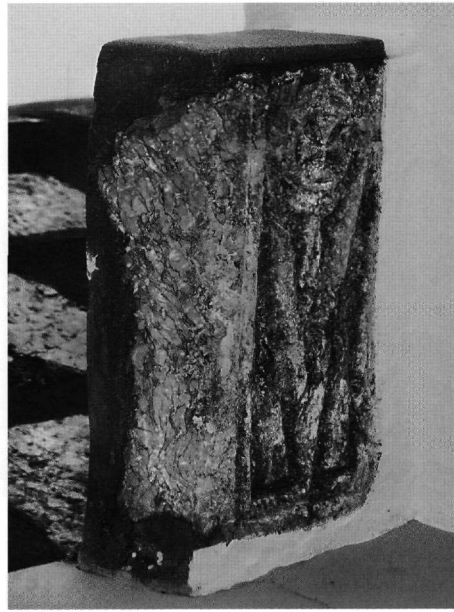
Εικ. 2. Νημπορειό, Μεταμόρφωση του Σωτήρος. Τμήμα θωρακίου.

Όσον αφορά το επίθημα στην αγία τράπεζα της εκκλη-