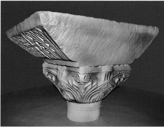
Εικ. 3. Νημπορείο, Αγία Κάρα. Βάση αγίας τράπεζας.

Εικ. 4α-β. Αρχαιολογικό Μουσείο Σύμης. Αμφικιονίσκοι από το οικόπεδο Αντώνογλου στο Νημπορείο.