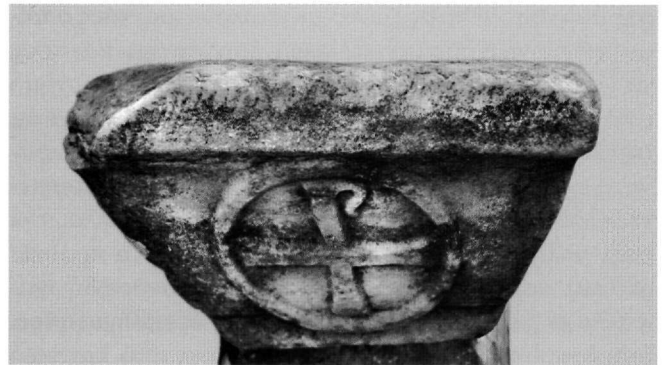
Εικ. 5. Αρχαιολογικό Μουσείο Σύμης. Επίθημα κιονίσκου από το οικόπεδο Αντώνογλου στο Νημπορειό.

Το θέμα του βαθμιδωτού σταυρού που περιβάλλεται από δένδρα και συνδέεται με το θριαμβευτή σταυρό σε παραδεισένιο τοπίο, απαντά στην ταφική ζωγραφική από το τέλος του βου αιώνα 32 και μετά. Ο πιθανός υπέργειος τάφος θα πρέπει να κτίστηκε μετά την παλαιοχριστιανική βασιλική λόγω του ότι στην τοιχοποιία κάτω από το τοιχογραφικό στρώμα διακρίνεται εντοιχισμένο ένα αδιάγνωστο μαρμάρινο τμήμα με ανάγλυφο σταυρό τύπου Μάλτας. Επίσης, με την ταφική αρχιτεκτονική συνδέεται ένα υπόγειο συγκρότημα που βρίσκεται σε χαμηλότερο επίπεδο από τη βασιλική, σε μικρή απόσταση προς τα ανατολικά. Πρόκειται για κτιστούς θολωτούς χώρους με κεντρικό διάδρομο που αποκαλούνται «Δώδεκα σπήλαια» και ερμηνεύθηκαν