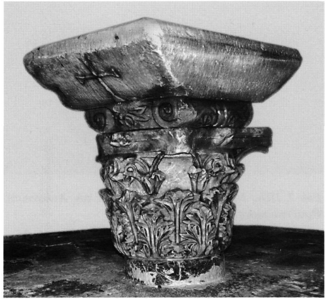
Εικ. 6. Νημπορειό, Αγία Ειρήνη. Βάση αγίας τράπεζας.

Στην περιοχή Πάνορμος, στη θέση όπου κτίστηκε το 18ο αιώνα το μοναστήρι του Αρχαγγέλου Μιχαήλ Πανορμίτη 60 , εικάζεται ότι θα προϋπήρχε βασιλική, άποψη που δεν αποκλείεται, όπως δηλώνουν κάποιες εν-