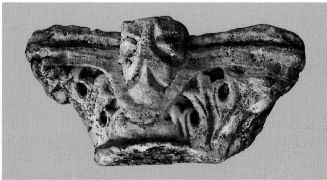
Εικ. 7. Πέδι. Ναός Αοχαγγέλου Μιχαήλ του Αυλακιώτη. Θραύσμα κιονοκράνου.

του προσώπου του κτιρίου που χρησιμεύει σήμερα ως εκκλησιαστικό μουσείο (σώζ. ύψ. 0,24, διαστ. άβακα 0,54×0,54 μ.). Διακρίνεται ευκρινώς το ιωνικό τμήμα με τα προσκεφάλαια που κοσμούνται με αντωπές δέσμες φύλλων καλάμου, ενώ ο εχίνος με σχηματοποιημένα «ωά» ανάμεσα στις έλικες. Το επίθημα έχει υποστεί ολοκληρωτική σχεδόν λάξευση, με αποτέλεσμα να χαθεί η κλίση των πλάγιων πλευρών και από το διάκοσμο να διατηρηθεί μόνο στη μία όψη τμήμα διπλού ταινιωτού μεταλλίου σε χαμηλό ανάγλυφο, το οποίο θα περιέβαλλε πιθανώς σταυρό, χριστόγραμμα ή ρόδακα. Από την κοινότυπη διακόσμηση του ιωνικού κιονοκράνου και τη σχηματοποιημένη απόδοση, χρονικά εντάσσεται στον 6ο αιώνα και μάλιστα από τους ιουστινιάνειους χρόνους και εντεύθεν 62 .