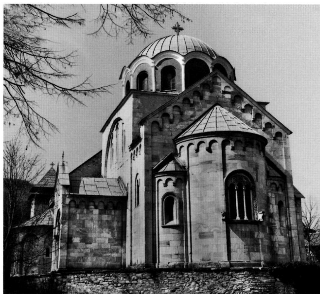
Fig. 3. L'église de la Vierge à Studenica.

monuments conservés, on croit pouvoir repérer des influences remontant à la haute époque byzantine. Les rapports entre les architectures byzantine et serbe sont visibles dans les solutions adoptées dans les États serbes, à l'époque de Stéfan Nemanja. L'église Saint-Pierre près de Novi Pazar (Fig. 1), qui dépendait apparemment de Ras, l'ancienne capitale de l'État serbe, renvoie au modèle de la rotonde byzantine de haute époque 8 . La première église qui peut être datée avec certitude est l'église de Saint Nicolas près de Kursumljia (Fig. 2), érigée par Stéfan Nemanja et construite selon le modèle de l'église médiane du monastère du Christ Pantocrator à Constantinople. Cette œuvre pieuse de Nemanja reprend en effet la conception constantinopolitaine de la projection horizontale de l'espace. Construite pour servir de mausolée au donateur 9 , elle témoigne de la participation de maîtres d'œuvre constantinopolitains : on leur doit le style de la construction, les parties supérieures de l'église et les formes adoptées. Cette solution est reprise au monastère de Djurdjevi Stupovi (Colonnes de Georges), dans le diocèse de Ras et à l'église de la Vierge à Studenica