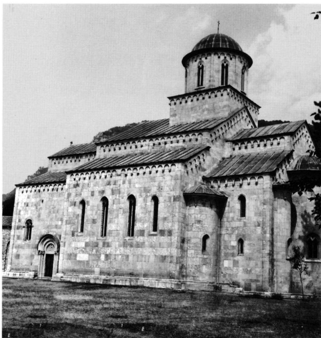
Fig. 4. L'église du Christ Pantocrator, Dečani.

(Fig. 3) n'elle atteindre le sommet de l'art : le monastère de Studenica a su tirer le meilleur parti de la rencontre des arts byzantine et romane, pour réaliser l'idée originale du programme fixé par le donateur et son entourage.