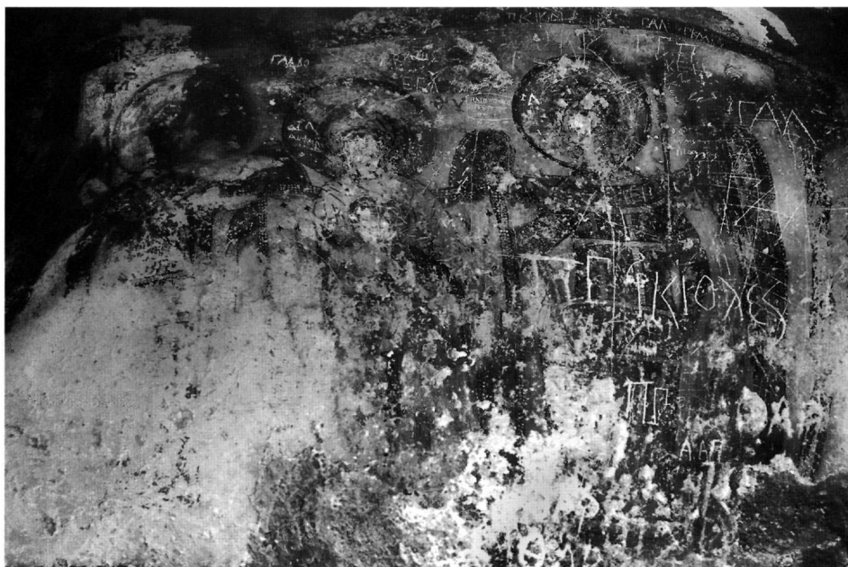
Εικ. 1. Αι-Σπηλιές Μεξιατών. Η ένθρονη βρεφοκρατούσα Θεοτόκος εν μέσω των αρχαγγέλων Μιχαήλ και Γαβριήλ.

επιφάνειας, πλήθος χαράγματα νεότερων χρόνων και σκαμμένα από ανθρώπινο χέρι τα πρόσωπα. Στο χώρο βρίσκουν και σήμερα καταφύγιο αιγοπρόβατα.