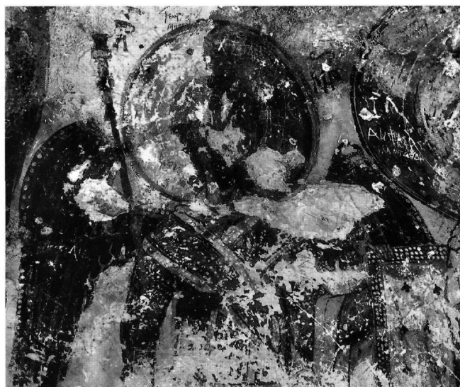
Εικ. 3. Αι-Σπηλιές Μεξιατών. Ο αρχάγγελος Μιχαήλ. Λεπτομέρεια της Εικ. 1.

όρθιος και μετωπικός· με το δεξιό χέρι κρατεί ράβδο και ακουμπά το αριστερό στο ερεισίνωτο του θρόνου. Φορεί πολυτελή αυλική στολή, με σκούρο πράσινο κεντητό διβητήσιο και λώρο περασμένο χιαστί στο στήθος. Στο λαϊμό του κομβώνεται μανδύας έντονου γαλάζιου χρώματος, ο οποίος κρέμεται στον αριστερό βραχίονα. Αμέσως κάτω από το στέρνο δένεται σφιχτά επάνω από το λώρο πορφυρή ζώνη, στοιχείο χαρακτηριστικό σε παραστάσεις αρχαγγέλων κατά το 13ο αιώνα, όπως στην Αγία Μαρίνα Θησειού στην Αθήνα 8 , στον Ταξιάρχη στο Όρος της Αίγινας 9 και σε μνημεία της Μάνης 10 . Στους βραχίονες διακρίνονται περιβρα-