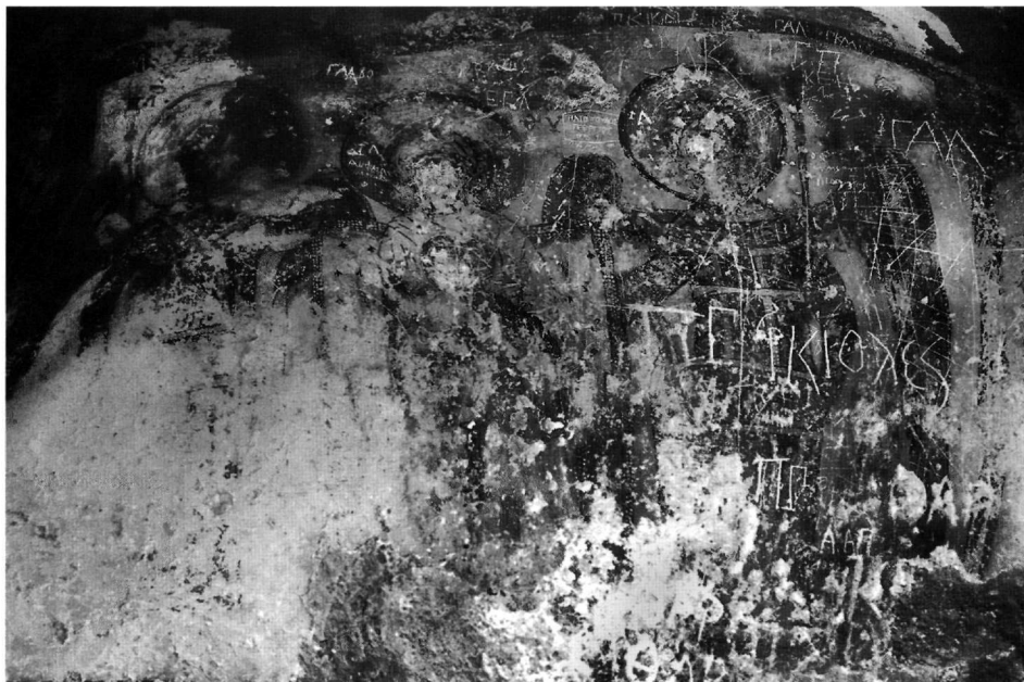
Εικ. 1. Αι-Σπηλιές Μεξιατών. Η ένθρονη βρεφοκρατούσα Θεοτόκος εν μέσω των αρχαγγέλων Μιχαήλ και Γαβριήλ.

επιφάνειας, πλήθος χαράγματα νεότερων χρόνων και σκαμμένα από ανθρώπινο χέρι τα πρόσωπα. Στο χώρο βρίσκουν και σήμερα καταφύγιο αιγοπρόβατα.