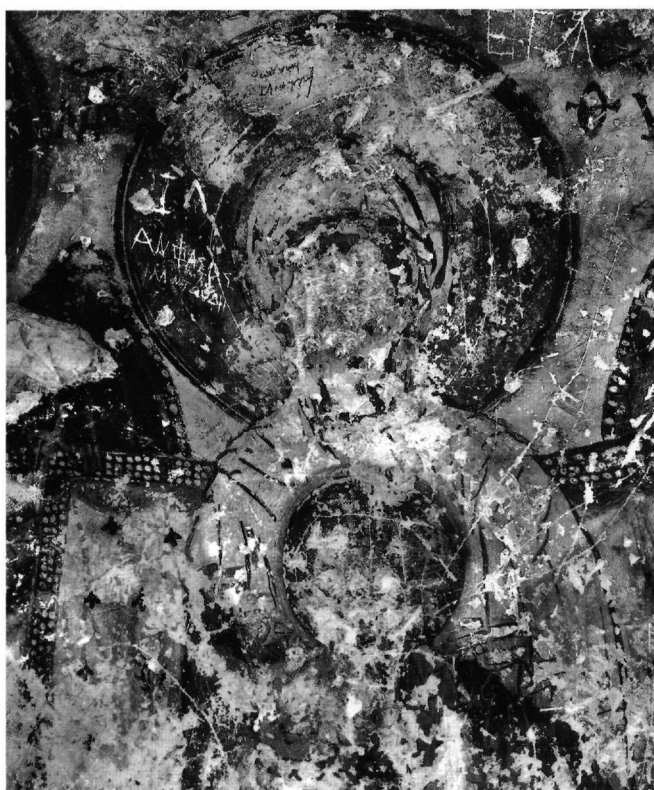
Εικ. 2. Αι-Σπηλιές Μεξιατών. Η Θεοτόκος και ο μικρός Χριστός. Λεπτομέρεια της Εικ. 1.

όρθιος και μετωπικός· με το δεξιό χέρι κρατεί ράβδο και ακουμπά το αριστερό στο ερεισίνωτο του θρόνου. Φορεί πολυτελή αυλική στολή, με σκούρο πράσινο κεντητό διβητήσιο και λώρο περασμένο χιαστί στο στήθος. Στο λαϊμό του κομβώνεται μανδύας έντονου γαλάζιου χρώματος, ο οποίος κρέμεται στον αριστερό βραχίονα. Αμέσως κάτω από το στέρνο δένεται σφιχτά επάνω από το λώρο πορφυρή ζώνη, στοιχείο χαρακτηριστικό σε παραστάσεις αρχαγγέλων κατά το 13ο αιώνα, όπως στην Αγία Μαρίνα Θησειού στην Αθήνα 8 , στον Ταξιάρχη στο Όρος της Αίγινας 9 και σε μνημεία της Μάνης 10 . Στους βραχίονες διακρίνονται περιβρα-