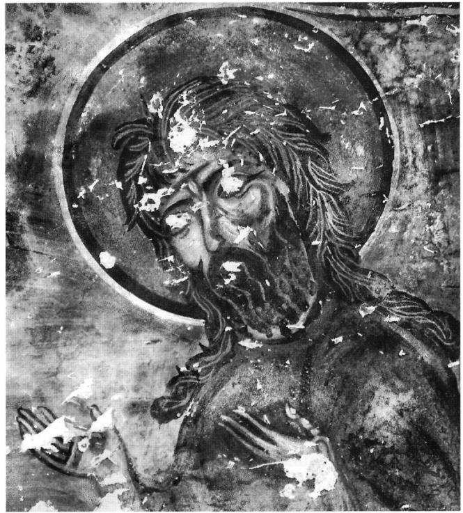
Εικ. 5. Γραμμένες Σπηλιές Κομποτάδων. Ο άγιος Ιωάννης ο Πρόδρομος. Λεπτομέρεια της Εικ. 4.

Σύμφωνα με τις προτεινόμενες χρονολογήσεις, οι παραστάσεις στα σπήλαια της Οίτης αποτελούν μικρά δείγματα της άγνωστης καλλιτεχνικής παραγωγής στην Φθιώτιδα κατά το 13ο αιώνα, επί των ημερών των δεσποτών της Ηπείρου και του κρατιδίου της Μεγάλης Βλαχίας. Πρόκειται για έργα επαρχιακά, στενά συνδεδεμένα με την υστεροκομνηνειακή παράδοση και ενταγμένα στη συντηρητική τάση που κυριαρχεί στο νοτιοελλαδικό χώρο κατά την περίοδο αυτή 55 . Αποτελούν επίσης τεκμήρια για την άγνωστη αλλά αξιολογώτερη, καθώς φαίνεται, ακμή του μοναχισμού στην περιοχή μέσα στο ανήσυχο θρησκευτικά και πολιτικά κλίμα της εποχής, που θα ευνοήθηκε από την τοπική εκκλησιαστική και πολιτική ηγεσία 56 . Σημαντικός πρέπει να ήταν προς αυτή την κατεύθυνση ο ρόλος του σεβαστοκράτορα των Νέων Πατρών Ιωάννη Α΄ Δούκα του Νόθου, ο