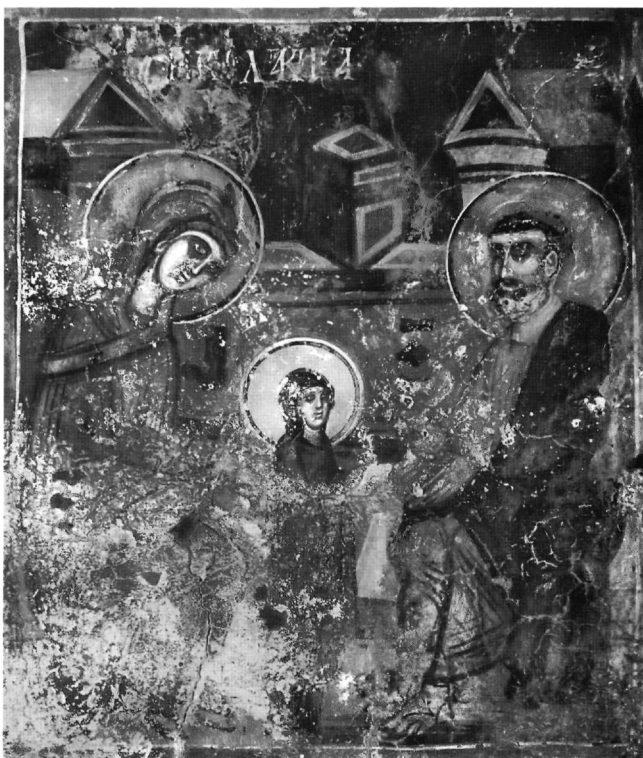
Εικ. 6. Η Κολακεία.

στα Εισόδια του ίδιου μνημείου, αποκλείουν την όποια σύγχυση με την απεικόνιση της σπουδαίας θεομητορικής εορτής, με την οποία εξάλλου και συνυπάρχει σε μια σειρά από δυτικά παραδείγματα 30 .