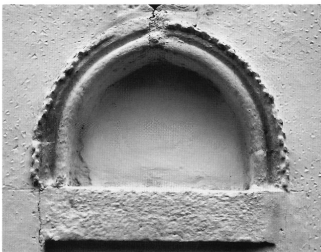
Εικ. 1. Η επίστεψη της εισόδου με το οδοντωτό πλαίσιο.

Τα επτά συνολικά επεισόδια από τον βίο της Παναγίας έχουν διαταχθεί αντικριστά, σχεδόν ασύντακτα στην ιστορική τους συνέχεια, στον βόρειο και τον νότιο τοίχο και κάτω από τις ευαγγελικές σκηνές, ως είθισται στα μονόχωρα καμαροσκεπή κρητικά μνημεία της εποχής της βενετοκρατίας 6 . Στην τρίτη από την κλειδα της καμάρας ζώνη του βόρειου τοίχου, τρεις παρατακτικές σκηνές εισάγουν στην ιστόρηση του κύκλου, με πρώτη την Προσευχή της Άννας, δεύτερη τη συνήθως προηγούμενη Προσευχή του Ιωακείμ και καταληκτική την Κολακεία, ενώ στη δεύτερη ζώνη, ουσιαστικά στον χώρο του ιερού, όπως στο Σκλαβεροχώρι 7 , και κάτω από την Ανάληψη, εικονίζονται, απομονωμένα από την προηγούμενη ροή της διήγησης, τα Εισόδια. Στον νότιο τοίχο, απέναντι από την παραπάνω συμπαγή τριάδα των επεισοδίων, επίσης στην τρίτη από την κλειδα ζώνη, εικονίζεται το Γενέσιον της Θεοτόκου, απεικόνιση που διαδέχεται η Ευλογηθείσα εν τω ναώ, ενώ η συχνό-