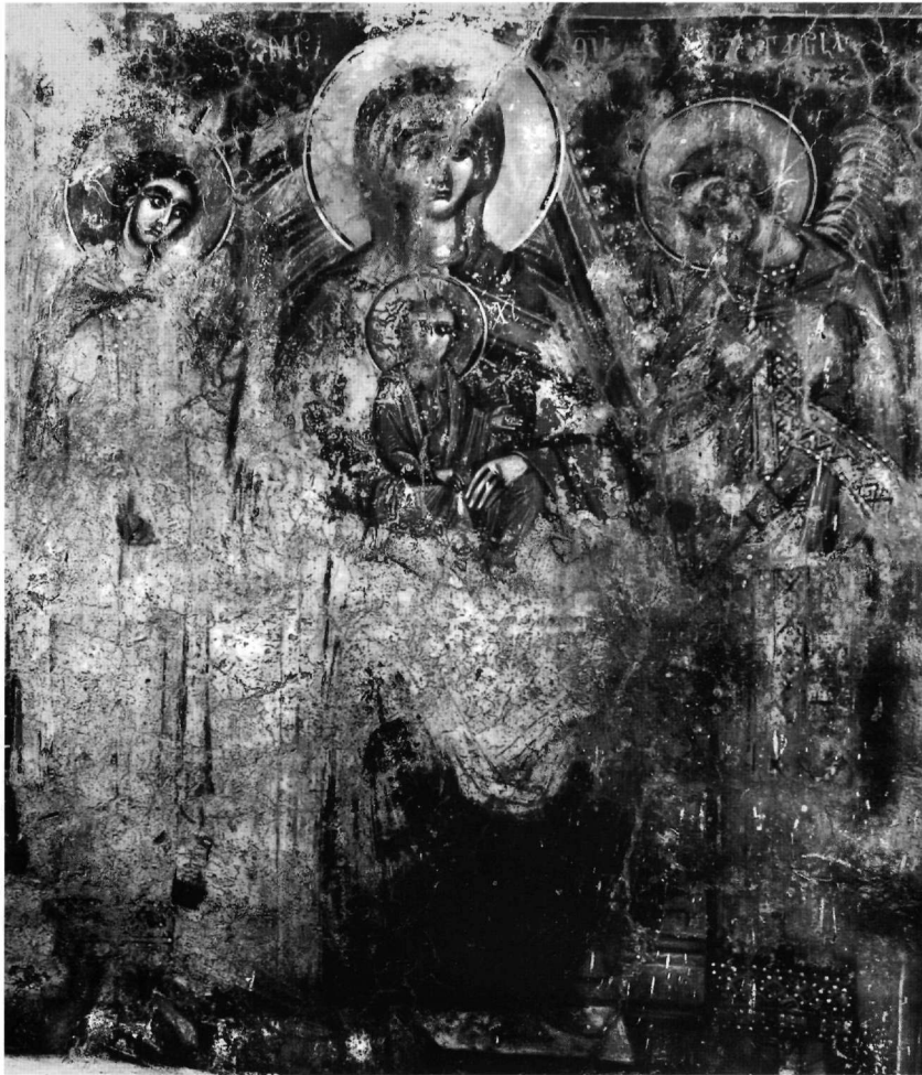
Εικ. 8. Ενθρονη Βρεφοκρατούσα με αγγέλους.

στην Πάτμο (μέσα 15ου αι.) 50 . Αδιόρατα στρέφει αριστερά της το ωραίο, θλιμμένο πρόσωπο, όπου και κατευθύνει το βαθύ, σαν βουρκωμένο βλέμμα, αντίθετα από τον μικρό Χριστό, που, καθισμένος στα γόνατά της, καταδεικνύει με τη χειρονομία της δεξιάς τον του Ευαγγελισμού και του Πάθους Γαβριήλ, όπως ανάλογα με τη στροφή της κεφαλής και το βλέμμα σε εικόνες της Παναγίας του Πάθους 51 .