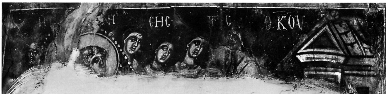
Εικ. 4. Η Γέννηση της Θεοτόκου.

Με σημαντικές φθορές, έντονες απολεπίσεις και αφανής σχεδόν από τα άλατα εικονίζεται Η ΕΥΛΟΓΗΤΙΚΑ ΕΝ ΤΟ ΝΑΟ που διαδέχεται το Γενέσιον. Μπροστά από ψηλό τοίχο με πεσσίσκο στη ράχη του, από αριστερά πλησιάζουν το ιερό με τα κλειστά βημόθυρα οι γονείς