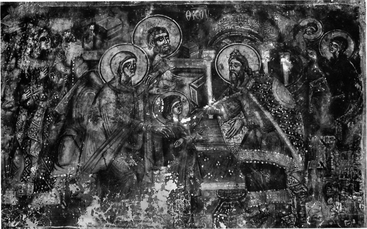
Εικ. 7. Τα Εισόδια.

(Εικ. 7). Η Άννα κλίνει τα γόνατα μπροστά στον αρχιερέα, ακουμπώντας τρυφερά το ένα χέρι στον ώμο της μικρής κόρης και υψώνοντας το άλλο σε χειρονομία προσφοράς και ικεσίας. Ένα βήμα πίσω της ο Ιωακείμ, σε δεύτερο επίπεδο, καμπυλώνει έντονα εμπρός το σώμα, σαν τόξο με χορδή την Άννα, αναθρώσκει το κεφάλι και σταυρώνει τα χέρια στο στήθος, με εύγλωττη κίνηση της δεξιάς παλάμης που εκφράζει δυναμικά τη θερμή παράκληση προς τον Ζαχαρία, σαν να αποδίδει εικαστικά τη γλαφυρή περιγραφή του Ιακώβου της μονής Κοκκινοβάφου στο «Λόγος Εἰς τὰ Εἰσόδια»: ... ὃ θεῖε Ζαχαρία, ... ἠπίως μὲν τὴν ἔλευσιν, περιχαρῶς δὲ τὴν ἀφιέρωσιν καταδέχου 37 . Η Παναγία, άγουρη, συνεσταλμένη παρθενική μορφή, επαναλαμβάνει, σαν σε παρήχηση, τη χειρονομία του πατέρα της ατενίζοντας τον αρχιερέα. Εκείνος, μπροστά στο ιερό, με ένδυση ανάλογη προς την επισιμότητα της τελετουργίας, που