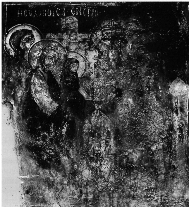
Εικ. 5. Η Ευλογηθείσα εν τω ναώ.

γίας παραπέμπει σε εκείνη του σπαργανωμένου Χριστού, που όμοια κρατεί η Θεοτόκος στην τοιχογραφία της Υπαπαντής στον Άγιο Νικήτα στο Čučer (1309-1314) 28 . Χαρακτηριστικό στοιχείο της Ευλογηθείσας στο Ανισαράκι, ιστόρηση μοναδική, όσο γνωρίζω στη βυζαντινή μνημειακή ζωγραφική, η σαν βρέφος σπαργανωμένη στο ένδυμα ενήλικης μικρή Παναγία, την οποία προσκομίζει ο πατέρας της στο ιερό 29 , ως δώρο θαυμαστής, θεόπεμπτης ευγονίας, για να ευλογηθεί. Η επιγραφή της σκηνης, το υπερμέγεθες χέρι του αρχιερέα σε σχήμα ευλογίας, το οποίο και υπογραμμίζει την έννοια του δρωμένου, όπως και ο απλός, πράσινος μανδύας του που, καθώς παραμένει ακόσμητος, διαφοροποιείται σαφέστατα από το βαρύτιμο ρούχο που φορεί