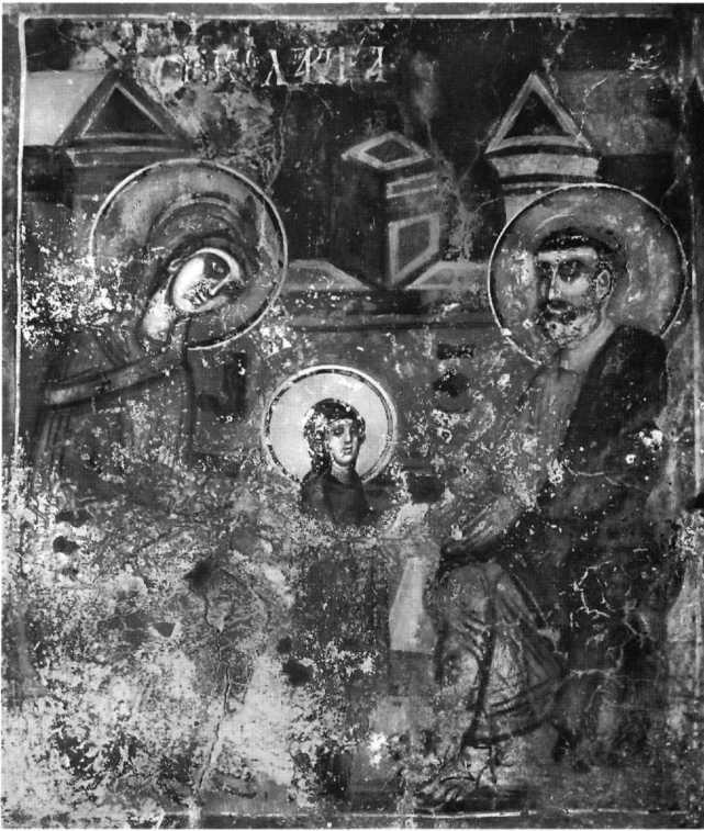
Εικ. 6. Η Κολακεία.

στα Εισόδια του ίδιου μνημείου, αποκλείουν την όποια σύγχυση με την απεικόνιση της σπουδαίας θεομητορικής εορτής, με την οποία εξάλλου και συνυπάρχει σε μια σειρά από δυτικά παραδείγματα 30 .