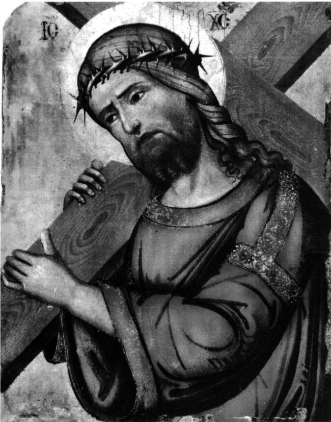
Εικ. 3. Λέρος. Παναγία του Κάστρου. Ο Χριστός αίρων τον Σταυρόν.

στοιχεία που απαντούν συχνά και σε κρητικές ή κυπριακές εικόνες του 15ου αιώνα 34 . Ιταλικά πρότυπα του 14ου και του 15ου αιώνα ανακαλεί, επίσης, η πλούσια ξανθή κόμη του Χριστού με τους σπειροειδείς βο-