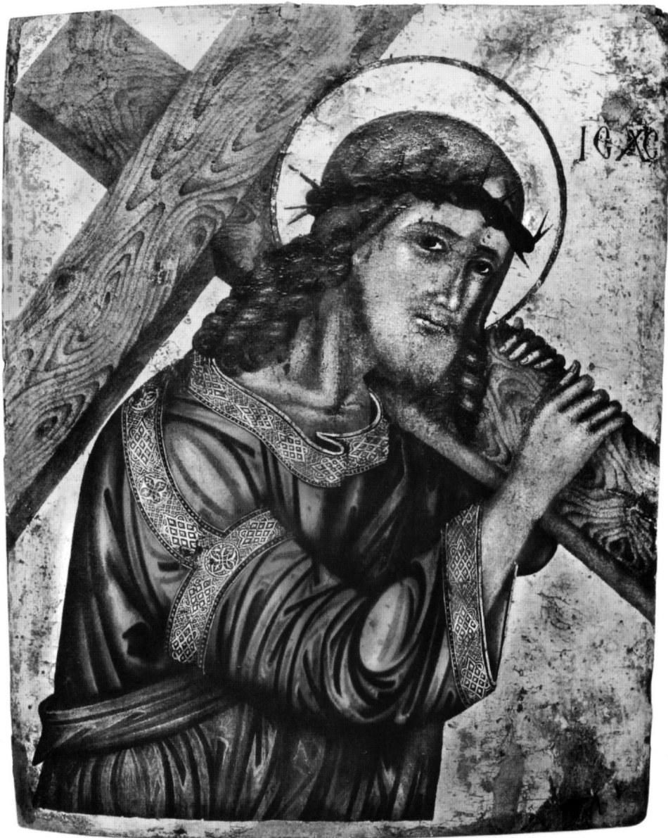
Εικ. 1. Ρόδος, Συλλογή Ιεράς Μητροπόλεως. Ο Χριστός αίρων τον Σταυρόν.

Χριστό μέχρι τον τόπο του μαρτυρίου παραδίδεται μόνον στο Ευαγγέλιο του Ιωάννη 2 . Οι άλλοι ευαγγελιστές, περιγράφοντας το γεγονός, αναφέρουν ότι το επαχθές καθήκον ανέλαβε ο Σίμων ο Κυρηναίος. Αυτή την τε-