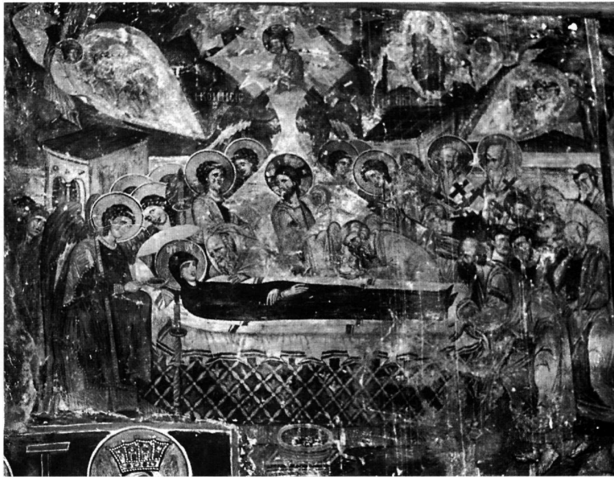
Εικ. 4. Η Κοίμηση της Θεοτόκου. Ναός Αγίου Νικολάου του Κυρίτζη στην Καστοριά.

εργαστηρίων της Θεσσαλονίκης, του πρώτου τετάρτου του 14ου αιώνα, όπως στην Κοίμηση της Θεοτόκου στον ναό του Σωτήρος Χριστού στη Βέροια (1315), στον Άγιο Νικόλαο Ορφανό της Θεσσαλονίκης (1315-1320), στον Άγιο Νικήτα στο Čučer έξω από τα Σκόπια (γύρω στο 1322) κ.α. 6 Το εικονογραφικό αυτό στοιχείο θα γίνει του συρμού στη ζωγραφική μνημείων της μεζονος Μακεδονίας κατά το δεύτερο μισό του 14ου αιώνα 7 . Η εικονογραφική αυτή λεπτομέρεια, όπως αποτυ-