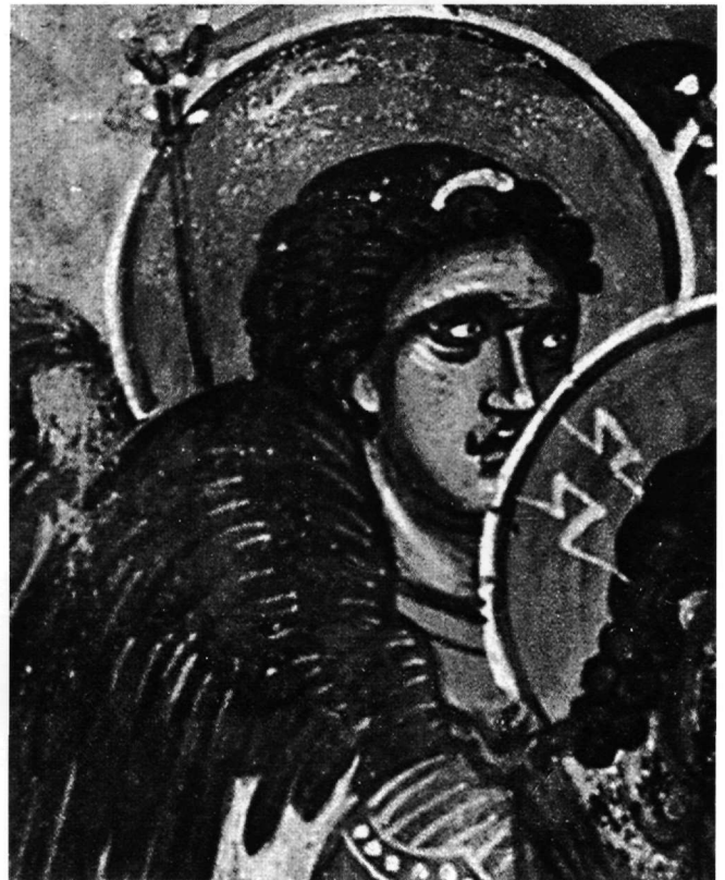
Εικ. 9. Άγγελοι. Λεπτομέρεια της Εικ. 2.

κόνα εντοπίζονται στη μετωπική στάση του Χριστού, στη μορφή της δόξας που τον περιβάλλει και στην παρουσία δύο γυναικών πίσω από τον όμιλο των αποστόλων. Αντίθετα, η ομόθεμη τοιχογραφία στον ναό του Αγίου Νικολάου του Κυρίτζη, παρότι διατηρεί το βασικό εικονογραφικό σχήμα με αυτό της εικόνας της Κα-