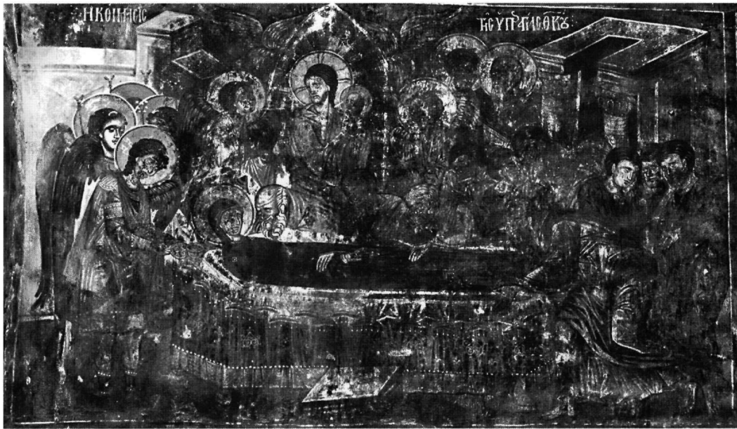
Εικ. 2. Η Κοίμηση της Θεοτόκου. Ναός Αγίου Γεωργίου του Βουνού στην Καστοριά.

(1302/3) στον ναό του Αγίου Δημητρίου Θεσσαλονίκης (Εικ. 3) 5 , η οποία είναι συνεπτυγμένη έκδοση της Κοιμήσεως της Θεοτόκου στον ναό του Πρωτάτου.