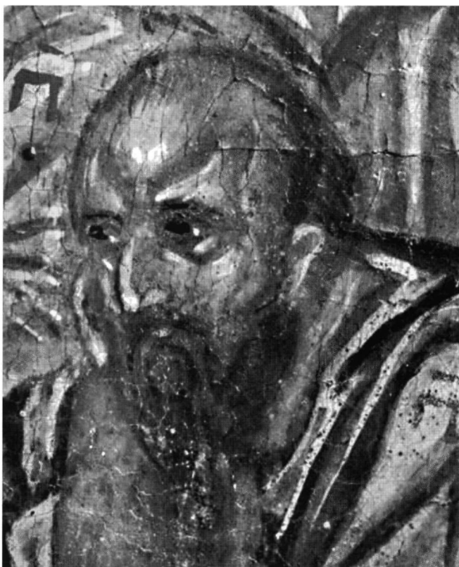
Εικ. 12. Ο απόστολος Παύλος. Λεπτομέρεια της Εικ. 1.