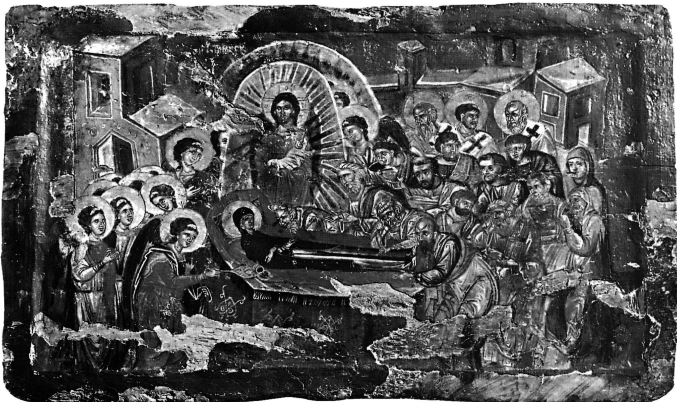
Εικ. 1. Εικόνα Κοιμήσεως της Θεοτόκου. Βυζαντινό Μουσείο Καστοριάς.

Από εικονογραφική άποψη η εικόνα της Κοιμήσεως της Θεοτόκου στην Καστοριά δεν ακολουθεί το τυπικό εικονογραφικό σχήμα του θέματος 3 , αλλά διαφοροποιείται στην οργάνωση, καθώς ο όμιλος των αποστόλων δεν αναπτύσσεται εκατέρωθεν της νεκρικής κλίνης της Παναγίας, όπως είναι ο κανόνας, αλλά τοποθετείται όλος δεξιά σε πυκνή διάταξη, ενώ τον χώρο αριστερά καταλαμβάνει αποκλειστικά όμιλος αγγέλων σε πυκνή, επίσης, διάταξη.