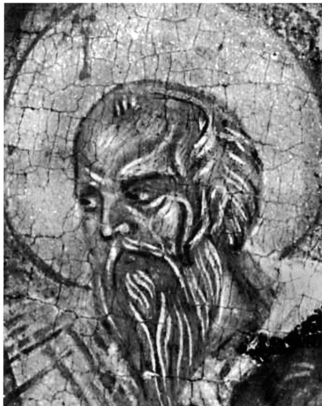
Εικ. 10. Ο άγιος Ιερόθεος. Λεπτομέρεια της Εικ. 1.

Ανάλογη συνθετική συγκρότηση του θέματος με την εικόνα της Καστοριάς παρατηρείται σε μνημεία του δεύτερου μισού του 14ου αιώνα, όπως είναι η Κοίμηση της Θεοτόκου στον ναό του Αγίου Νικολάου του Κυρίτζη (Εικ. 4) και κυρίως στην Κοίμηση της Θεοτόκου στον ναό του Αγίου Γεωργίου του Βουνού (Εικ. 2) στην Καστοριά. Στον Άγιο Νικόλαο του Κυρίτζη η σύνθεση του κυρίου θέματος εμφανίζεται πιο ισόρροπη και σύμμετρη από αυτή της εικόνας της Καστοριάς, ενώ στη συνολική συνθετική σύλληψη διαφοροποιείται με την παρουσία συμπληρωματικών επεισοδίων. Αντίθετα, στον Άγιο Γεώργιο του Βουνού, η συνθετική συνάφεια ανάμεσα στην εικόνα της Κοιμήσεως της Θεοτόκου και στην ομόθεμη τοιχογραφία του ναού είναι έκδηλη. Το συνθετικό σχήμα της Κοιμήσεως της Θεοτόκου και στα δύο έργα, τοιχογραφία και εικόνα, είναι λιτό, με έκκεντρα τοποθετημένο τον Χριστό και τις δύο ομάδες που πλαισιώνουν την Παναγία, των αποστόλων και των αγγέλων, κατανεμημένες και οργανωμένες στη σύνθεση κατά τρόπο μη ισόρροπο, όπως και στην Κοίμηση της Θεοτόκου στο παρεκκλήσιο του Αγίου Ευθυμίου (Εικ. 3).