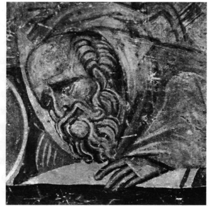
Εικ. 5-7. Ο ασπασμός της Παναγίας από τον άγιο Ιωάννη τον Θεολόγο. Λεπτομέρειες των Εικ.1, 2 και 4.