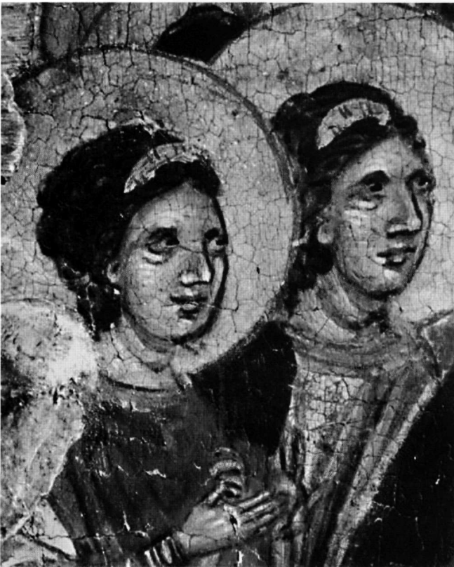
Εικ. 8. Άγγελοι. Λεπτομέρεια της Εικ. 1.