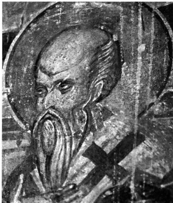
Εικ. 11. Ιεράρχης. Λεπτομέρεια της Εικ. 4.