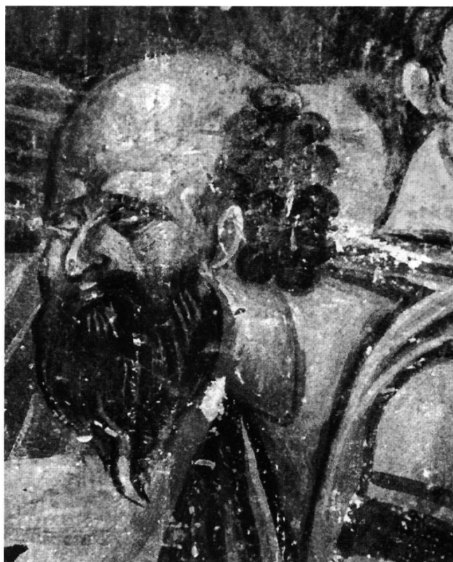
Εικ. 13. Ο απόστολος Παύλος. Λεπτομέρεια της Εικ. 4.

Επίσης, χαρακτηριστικό συνδετικό στοιχείο ανάμεσα στην εικόνα της Κοιμήσεως της Θεοτόκου και στην ομόθεμη τοιχογραφία στον Άγιο Γεώργιο του Βουνού στην Καστοριά είναι ότι ο διάκοσμος της ποδέας με τα επαναλαμβανόμενα καρδιάσχημα κοσμήματα, που πλαισιώνουν σχηματοποιημένο κρινάνθεμο, επαναλαμβάνεται πανομοιότυπα στην ποδέα της κλίνης στην Κοίμηση της Θεοτόκου στον Άγιο Γεώργιο του Βουνού (Εικ. 1 και 2). Σε επίπεδο τυπολογίας φυσιογνωμικών τύπων, οι μορφές της εικόνας της Καστοριάς, εάν κρίνουμε από τα πρόσωπα των αγγέλων (Εικ. 8) και των ιεραρχών (Εικ. 10 και 11), παρουσιάζουν προσωπογραφική και εκφραστική ομοιογένεια.