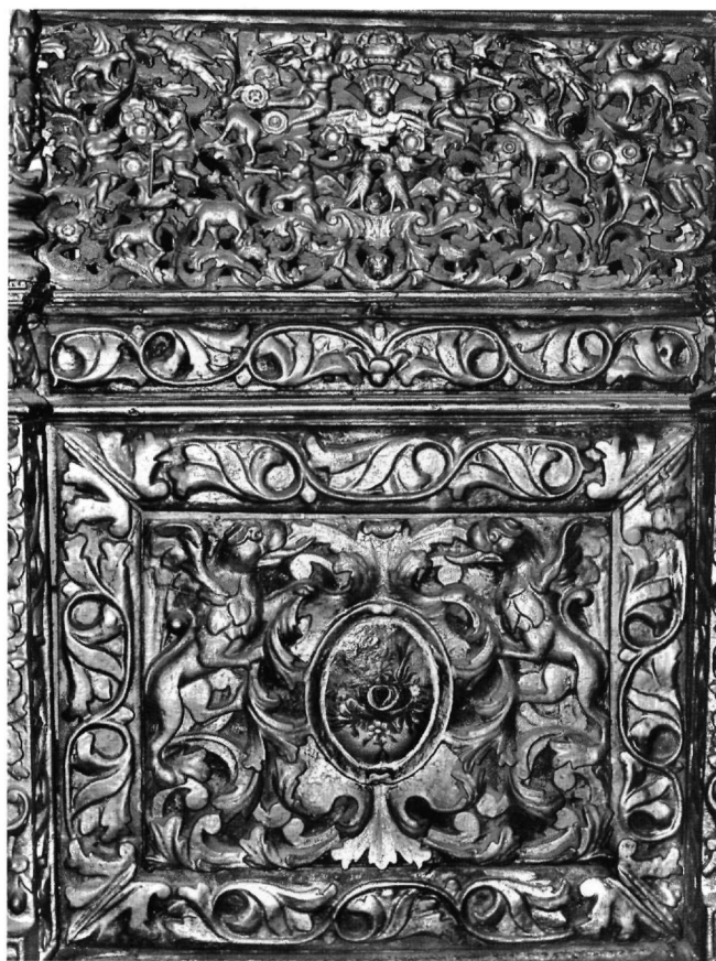
Εικ. 9. Μονή Ιβήρων, παρεκκλήσιο Παναγίας Πορταϊτίσας. Τέμπλο (1785). Κάτω ζώνη (λεπτομέρεια).

επιφέρει καθοριστικές αλλαγές στην τεχνική και το ύφος του ξυλόγλυπτου διακόσμου στο Άγιον Όρος. Το τέμπλο της Πορταϊτίσας αποτελεί ώρμο καταστάλαγμα αυτών των αλλαγών. Η δομή και η διάρθρωση του, αλλά και η οργάνωση του διακόσμου με την επιλογή συγκεκριμένων θεμάτων σε συγκεκριμένες θέσεις, όπως ανθοδοχεία στους πεσσίσκους, περισσότερα ανάμεσα στα κεμέρια ή μπουκέτα από άνθη πάνω από αυτά, το συνδέουν με σύγχρονα τέμπλα περιοχών της