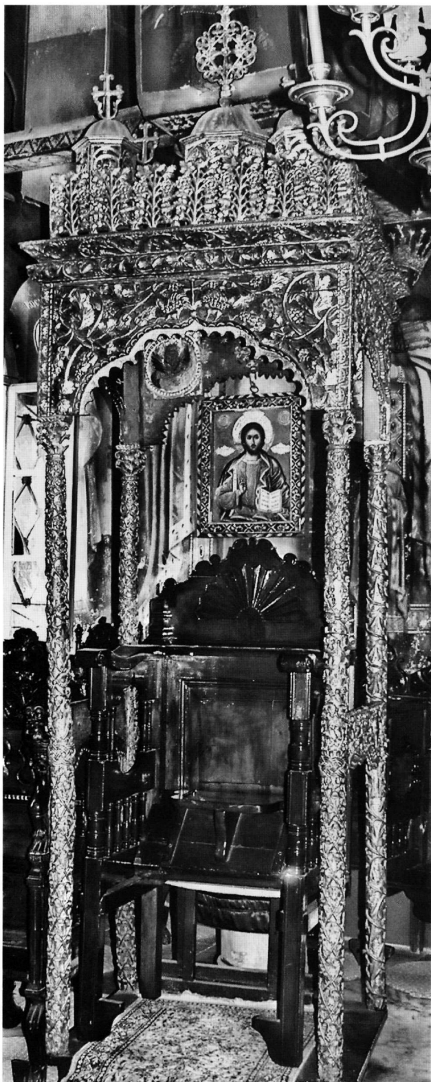
Εικ. 3. Μονή Ιβήρων, παρεκκλήσιο Παναγίας Πορταΐτσας. Προσκυνητάριο (1683).

μισό του 19ου αιώνα 14 . Η τεχνοτροπική συγγένεια του διακόσμου των βημοθύρων και του προσκυνηταρίου της Πορταΐτσας δείχνει πιθανώς και την κοινή τους προέλευση. Ο παραγγελιοδότης άλλωστε των έργων αυτών Δαμασκηνός είναι λογικό να απευθύνθηκε στον ίδιο τεχνίτη για την κατασκευή τους.