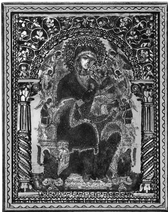
Εικ. 2. Μονή Ιβήρων, καθολικό. Εικόνα Παναγίας του Πάθους (1683).

Στο εικονοφυλάκιο της μονής, μεταξύ των άλλων ξυλόγλυπτων, φυλάσσεται και ένα βημόθυρο (Εικ. 4). Ο ξυλόγλυπτος διάκοσμός τους, που περιβάλλει τις γραπτές παραστάσεις, περιλαμβάνει, όπως και στα προαναφερθέντα έργα, βλαστό κληματίδας που αποδίδεται με σχετικά έξεργο ανάγλυφο. Στον διαχωριστικό σταθμό των φύλλων ελίσσεται φυτικός πλοχμός με κοκκιωπή διακόσμηση. Το πάνω τμήμα των βημοθύρων κοσμούν μεγάλα διάτρητα φύλλα κληματίδας και τσαμπιά σταφύλια που ραμφίζουν πουλιά. Ο διάκοσμος παρουσιάζει