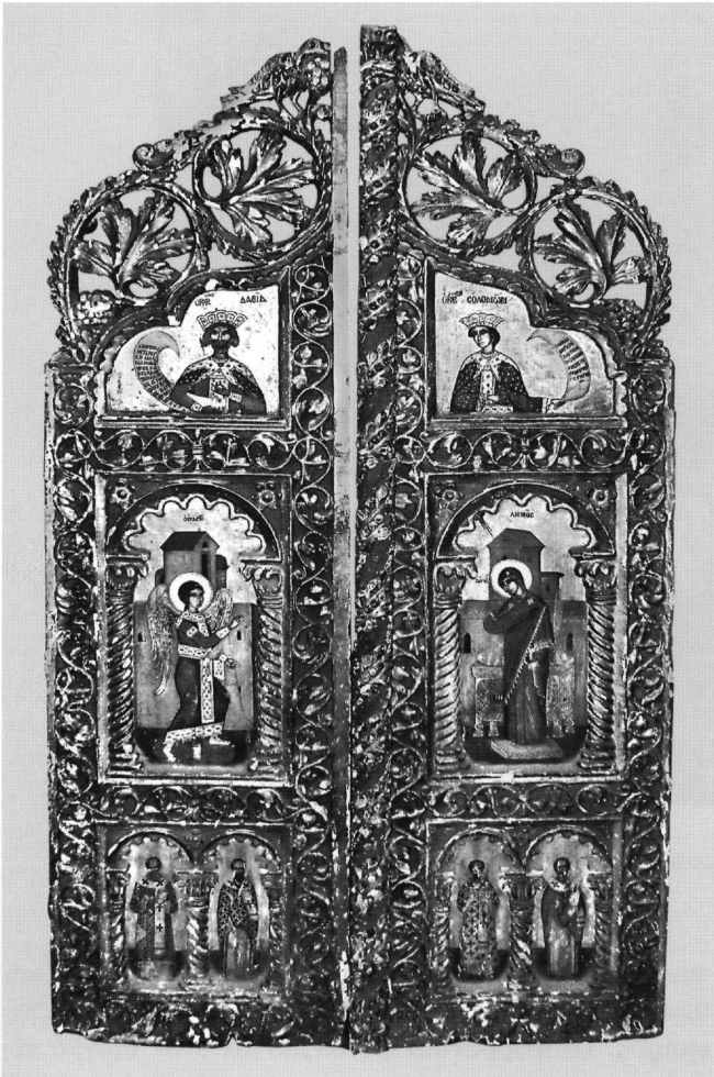
Εικ. 4. Μονή Ιβήρων, εικονοφυλάκιο. Βημόθυρο (β' μισό 17ου αι.).

ρειτικά τέμπλα, όπως του ναού του Πρωτάτου (1611) 17 , του καθολικού της μονής Παντοκράτορος (1640) 18 κ.ά. Στον θριγκό διαμορφώνονται τρεις ζώνες για την τοπο-