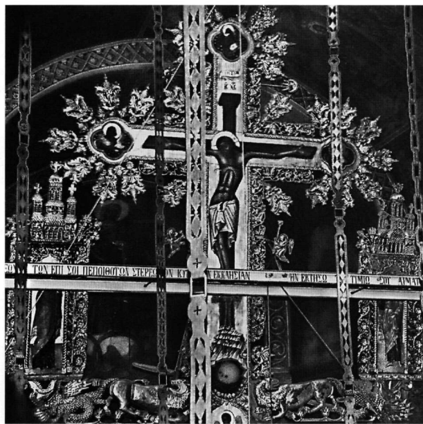
Εικ. 7. Μονή Ιβήρων. Καθολικό. Τέμπλο (1707). Επίστεψη.