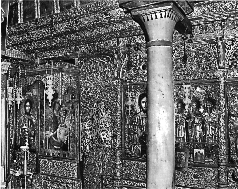
Εικ. 8. Μονή Ιβήρων, παρεκκλήσιο Παναγίας Πορταΐτισσας. Το τέμπλο (1785).