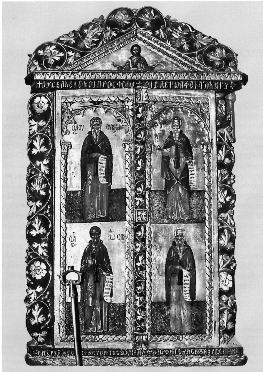
Εικ. 1. Μονή Ιβήρων, καθολικό. Παρρησία πρόθεσης (1620).

του Αγίου Ιωάννη του Προδρόμου στον Άη-Πάννη του Πηλίου», Δώρον. Τιμητικός τόμος στον καθηγητή Νίκο Νικονάνο , Θεσσαλονίκη 2006, 252), μπορεί όμως, κατά τη γνώμη μου, να χρονολογηθεί στις τελευταίες δεκαετίες του 16ου αιώνα τα τμήματα της παλαιότερης φάσης (τέλη 16ου-αρχές 17ου αι.) του τέμπλου του καθολικού της μονής Βλατάδων (Ε. Χατζητρούφωτος, «Το ξυλόγλυπτο τέμπλο του καθολικού της μονής Βλατάδων», Θεσσαλονίκη 1 (1985), 451-484)· τα βημόθυρα του τέμπλου του καθολικού της μονής Βελλάς, τα οποία χρονολογούνται από τον Τσαπαρλή στον 17ο αιώνα (Ε. Τσαπαρλής, Ξυλόγλυπτα τέμπλα Ηπείρου