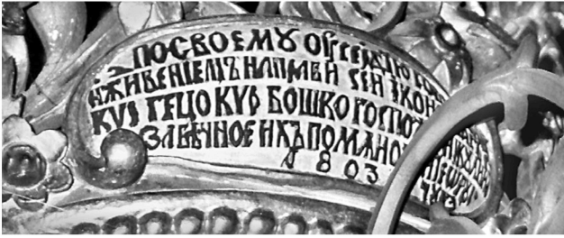
Εικ. 6. Μονή Ζωγράφου. Καθολικό. Επιγραφή προσκυνηταρίου των είκοσι έξι ζωγραφιτών μαρτύρων (1803).

Η επιγραφή (Εικ. 6) στην επίστεψη αναφέρει: Посвоємъ онсе радѣю собствєнѣи / нѣ живєнєиємъ на правнє сєн иконостасъ г: / кнѣ Гєцѣ кнѣ Бѣшкѣ гѣспѣжѣ Никєвѣннѣ / за вѣчнѣє нѣхъ помѣновєнїє ѿ рѣ- / 1803 счєкѣ (Το παρόν προσκυνητάρι κατασκευάστηκε / με επιμέλεια και δαπάνη του / κνρ Γκέτσο, κνρ Μπόσκο, κυρίας Νικουλίνας / από το Ρουσσούκ για τη δική τους αιώνια μνημόνευση / 1803).