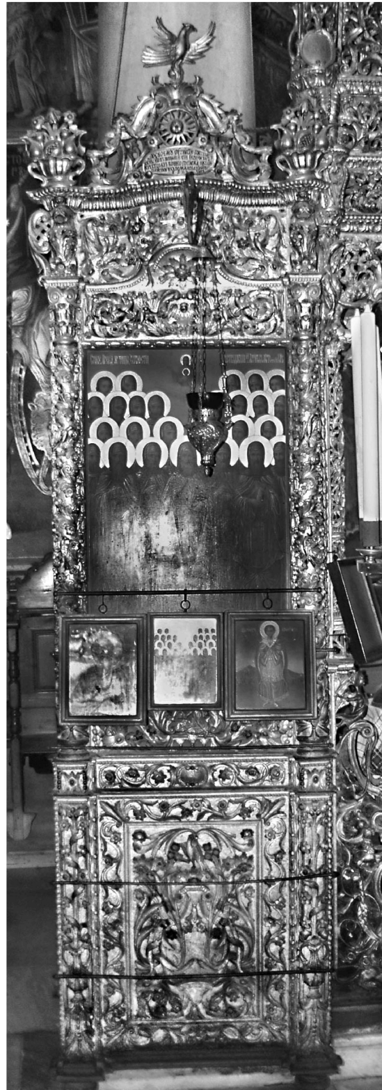
Εικ. 5. Μονή Ζωγράφου. Καθολικό. Προσκυνητάρι των είκοσι έξι ζωγραφιτών μαρτύρων (1803).