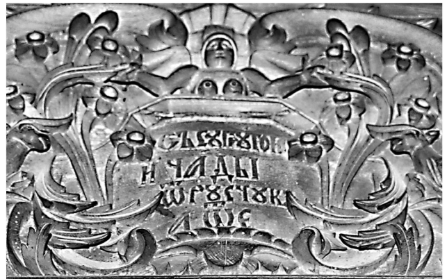
Εικ. 8. Μονή Ζωγράφου. Καθολικό. Επιγραφή κιβωρίου αγίας τράπεζας (1805).