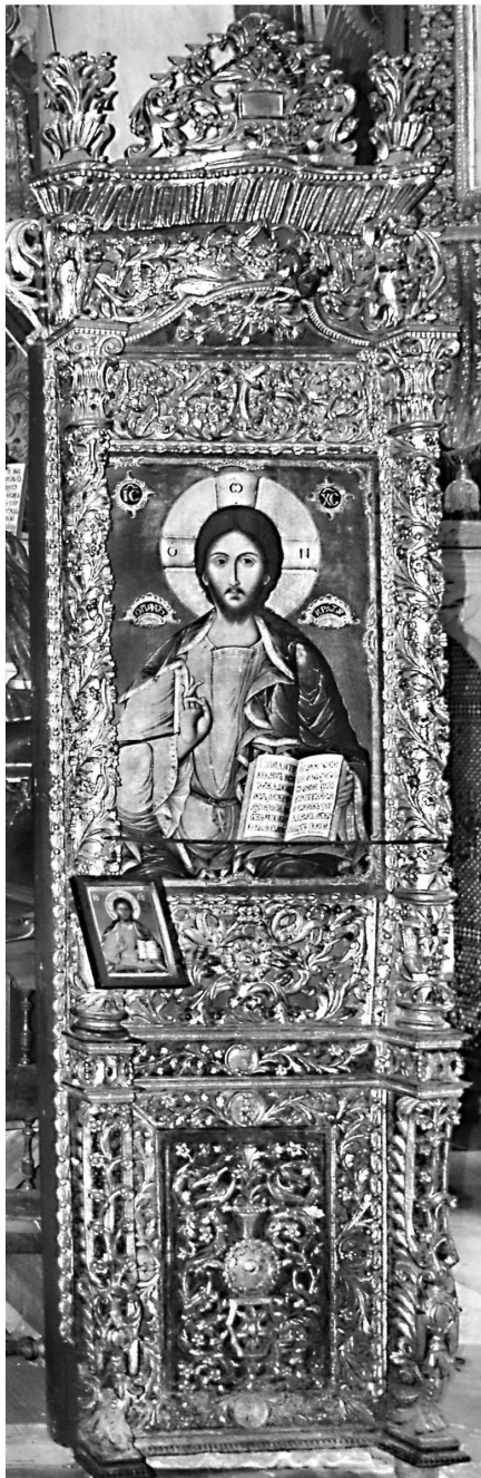
Εικ. 12. Μονή Ζωγράφου. Καθολικό, λιτή. Προσκνητάρι του Χριστού Παντοκράτορος.