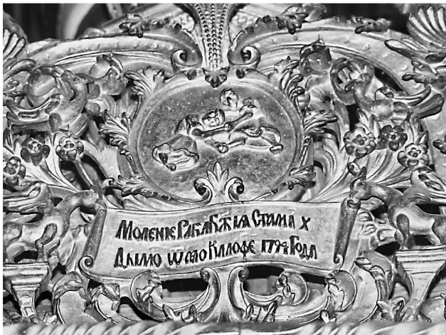
Εικ. 4. Μονή Ζωγράφου. Καθολικό. Επιγραφή προσκυνηταρίου του αγίου Γεωργίου «Φανουήλ» (1794).