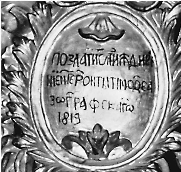
Εικ. 9. Μονή Ζωγράφου. Καθολικό. Επιγραφή προσκνηταρίου του αγίου Κοσμά Ζωγραφήτη (1819).