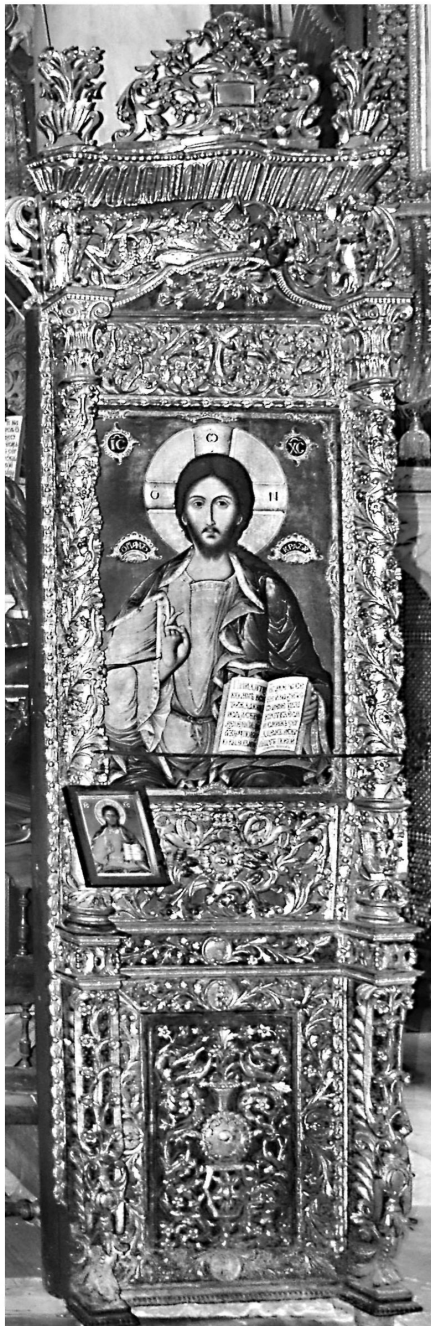
Εικ. 12. Μονή Ζωγράφου. Καθολικό, λιτή. Προσκνητάρι του Χριστού Παντοκράτορος.