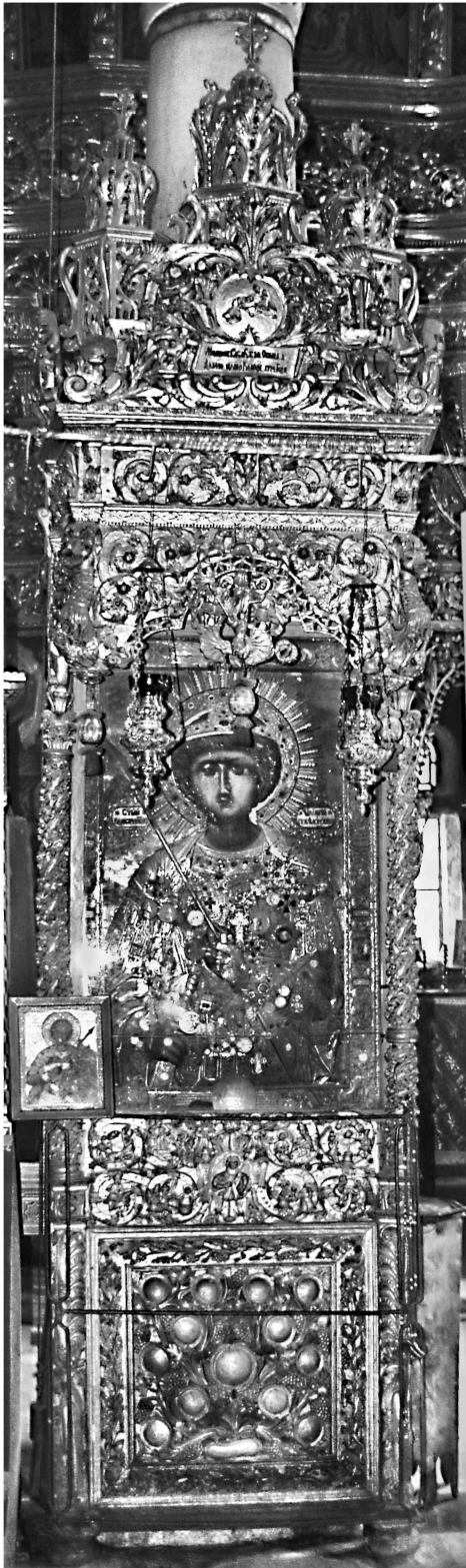
Εικ. 2. Μονή Ζωγράφου. Καθολικό. Προσκυνητάρι αγίου Γεωργίου «εξ Αραβίας» (1794).