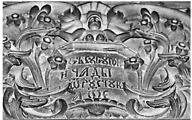
Εικ. 8. Μονή Ζωγράφου. Καθολικό. Επιγραφή κιβωρίου αγίας τράπεζας (1805).