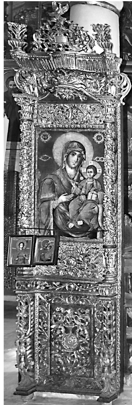
Εικ. 13. Μονή Ζωγράφου. Καθολικό, λιτή. Προσκυνητάρι της Παναγίας.

Το υφιστάμενο ήδη από τις αρχές του 19ου αιώνα μετόχι της μονής στο Ρουσσούκ, από όπου κατάγονται οι πέντε από τους εννέα αφιερωτές-δωρητές, σύμφωνα με τις επιγραφές των εξεταζόμενων έργων, υπήρξε ένα από τα σπουδαιότερα και πλέον προσοδοφόρα μετόχια της μονής Ζωγράφου 31 . Στις πηγές αναφέρεται ότι στις ασχολίες του οικονόμου του μετοχίου ανήκε και η οργάνωση ετήσιου προσκυνήματος κατοίκων του Ρουσσούκ και των γύρω χωριών κατά την εορτή του αγίου Γεωργίου, προστάτη της μονής Ζωγράφου 32 . Η ομάδα αποτελούνταν συνήθως από είκοσι έως τριάντα προσκυνητές. Η αναχώρηση και η επιστροφή τους συνοδεύονταν από λαμπρές εκδηλώσεις στο μητροπολιτικό ναό του Ρουσσούκ. Ενδεικτικά αναφέρουμε ότι ο αρχιμανδρίτης Αβέρκιος Ζωγραφίτης για μεγάλο χρονικό διάστημα εκτελούσε καθήκοντα οικονόμου-πνευματικού του μετοχίου και το 1837 συνόδευσε στο ετήσιο