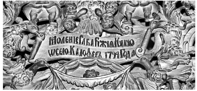
Εικ. 3. Μονή Ζωγράφου. Καθολικό. Επιγραφή προσκυνηταρίου αγίου Γεωργίου «εξ Αραβίας» (1794).

εκ των οποίων τα πέντε βρίσκονται στον κυρίως ναό και τα δύο στη λιτή, το κιβώριο της αγίας τράπεζας και τη θύρα του εξωνάρθηκα. Τα παραπάνω έργα χρονολογούνται από τις τελευταίες δεκαετίες του 17ου έως τις πρώτες δεκαετίες του 19ου αιώνα. Επιπλέον, τα περισσότερα, πλην των δύο προσκυνηταρίων της λιτής (Εικ. 12-13), φέρουν αφιερωτικές επιγραφές 6 .