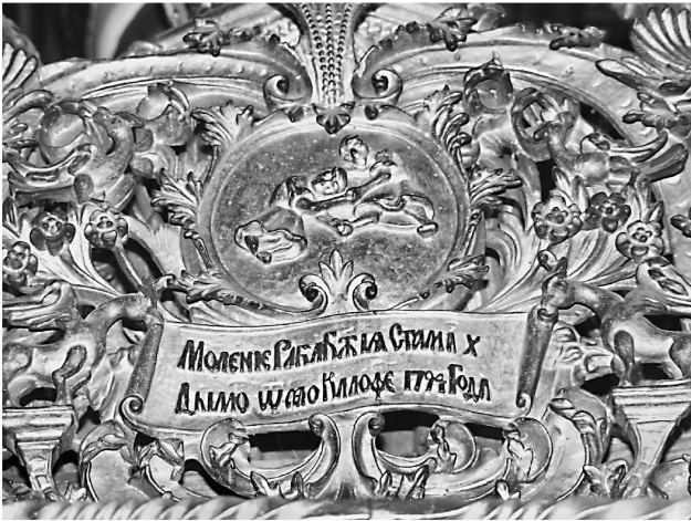
Εικ. 4. Μονή Ζωγράφου. Καθολικό. Επιγραφή προσκυνηταρίου του αγίου Γεωργίου «Φανουήλ» (1794).