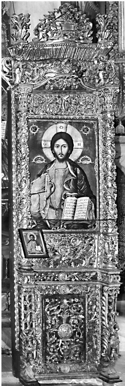
Εικ. 12. Μονή Ζωγράφου. Καθολικό, λιτή. Προσκνητήρι του Χριστού Παντοκράτορος.