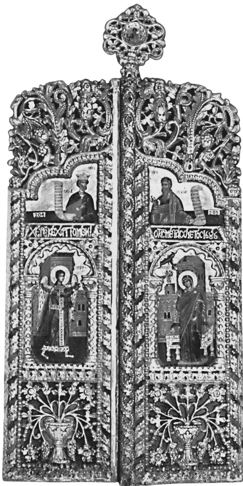
Εικ. 1. Μονή Ζωγράφου. Παρεκκλήσιο αγίων Κυρίλλου και Μεθοδίου. Βημόθυρα από το παρεκκλήσιο του Αγίου Νικολάου (1686).