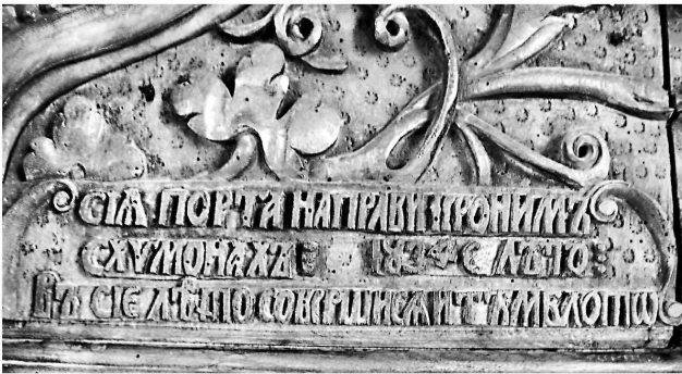
Εικ. 11. Μονή Ζωγράφου. Καθολικό. Επιγραφή στη θύρα της δυτικής εισόδου (1834).

Ζωγράφου παρουσιάζουν αναλογίες με αρκετά ξυλόγλυπτα στο Άγιον Όρος, τα οποία χρονολογούνται στις τελευταίες δεκαετίες του 17ου και στις αρχές του 18ου αιώνα, και φαίνεται ότι αποτελούν έργα μοναχών ξυλόγλυπτών 15 . Ανάλογοι διάκοσμοι σημειώνονται και σε ξυλόγλυπτα εκτός Αγίου Όρους, όπως στα προσκυνητήρια του ναού του Αγίου Αθανασίου στη Συκιά Χαλκιδικής, τα οποία όμως, όπως η έρευνα έχει δείξει, προέρχονται από το Άγιον Όρος και πιθανώς αποτελούν έργα μοναχών τεχνιτών 16 .