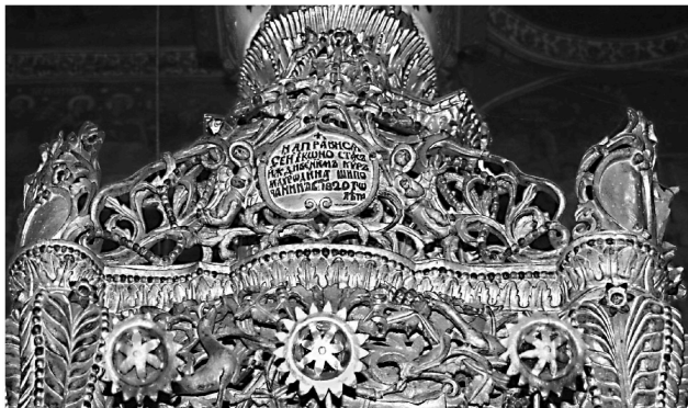
Εικ. 10. Μονή Ζωγράφου. Καθολικό. Επιγραφή προσκνηταρίου του αγίου Γεωργίου «Μολδαβίας» (1820).

ανακαίνισε την Αγίαν ταύτην Μονήν του Ζωγράφου». Βλ. Ε. Ν. Τσιγαρίδας - Α. Τριφοнова, «Οι θαυματουργές εικόνες της μονής Ζωγράφου», Μακεδονικά 35 (2005-2006), 125-126.