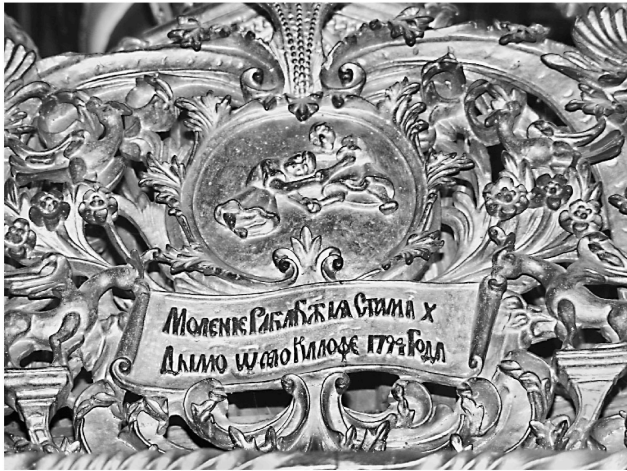
Εικ. 4. Μονή Ζωγράφου. Καθολικό. Επιγραφή προσκυνηταρίου του αγίου Γεωργίου «Φανουήλ» (1794).