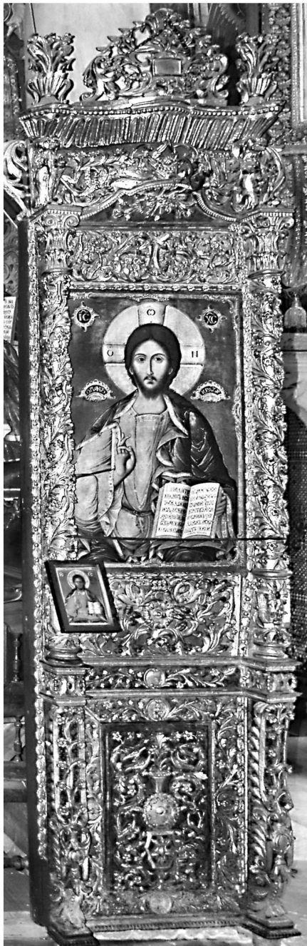
Εικ. 12. Μονή Ζωγράφου. Καθολικό, λιτή. Προσκνητήρι του Χριστού Παντοκράτορος.

αναφέρεται ως χωριό (selo). Ο παραγγελιοδότης του τέμπλου του παρεκκλησίου του Αγίου Νικολάου, από το οποίο προέρχονται τα βημόθυρα του 1686, πιθανότατα απευθύνθηκε σε μοναχό τεχνίτη, όπως συνάγεται από το ύφος του διακόσμου και τη συγκριτική του μελέτη με άλλα έργα στο Άγιον Όρος. Όσον αφορά τα λοιπά ξυλόγλυπτα του δεύτερου μισού του 18ου και των πρώτων δεκαετιών του 19ου αιώνα στη μονή Ζωγράφου, η συγγενεία τους με σύγχρονα έργα στο Άγιον Όρος, όπως τα τέμπλα στο καθολικό της μονής Δοχειαρίου, του παρεκκλησίου της Παναγίας Πορταΐτισσας στη μονή Ιβήρων κ.ά., τα οποία παρουσιάζουν αναλογίες με έργα ξυλόγλυπτικής από την Ήπειρο, υποδεικνύουν την κατασκευή τους είτε από ηπειρώτες ξυλόγλυπτες, οι οποίοι δραστηριοποιούνται την εποχή αυτή στον Άθω, είτε από μοναχούς τεχνίτες, οι οποίοι επηρεάστηκαν από τα έργα των ηπειρωτών συναδέλφων τους 21 . Δυστυχώς τα ονόματα των τεχνιτών δεν είναι γνωστά. Το μοναδικό έργο, στην επιγραφή του οποίου μνημονεύεται ο δημιουργός, είναι η ξυλόγλυπτη θύρα του καθολικού, η οποία λαξεύτηκε από το μοναχό Ιερώνυμο 22 . Σύμφωνα μάλιστα με την εν λόγω επιγραφή, ο ίδιος μοναχός ξυλόγλυπτης φαίνεται ότι κατασκεύασε και το τέμπλο του καθολικού. Η καλλιτεχνική δραστηριότητα άλλωστε μοναχών τεχνιτών στο Άγιον Όρος είναι τεκμηριωμένη στο 17ο και το 18ο αιώνα όχι μόνο στον τομέα της ξυλόγλυπτικής 23 , αλλά και στη ζωγραφική 24 , τη μαρμαρογλυπτική 25 κτλ.