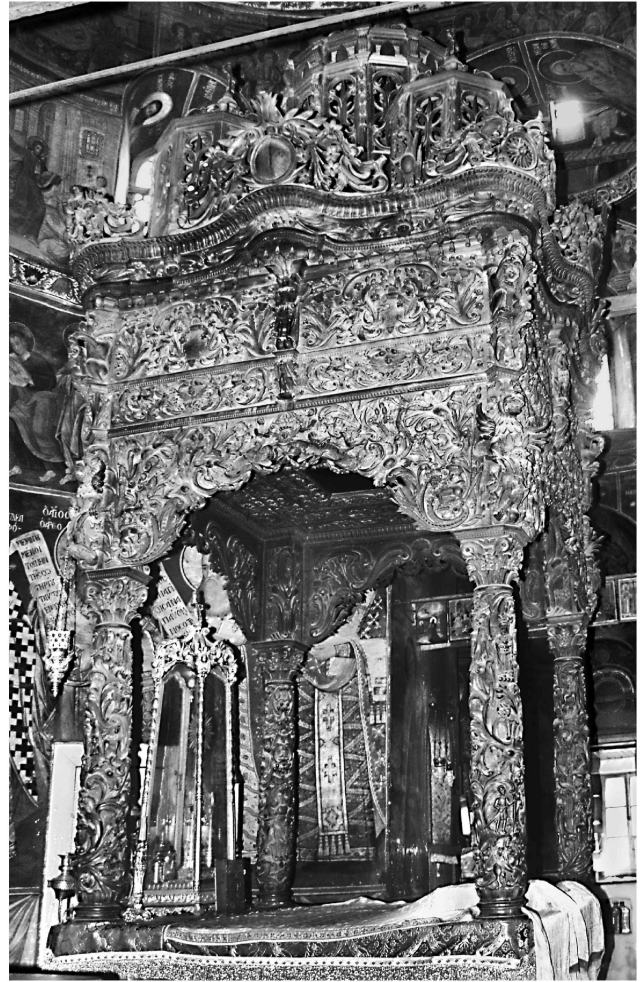
Εικ. 7. Μονή Ζωγράφου. Καθολικό. Κιβώριο αγίας τράπεζας (1805).

Τέλος, ένα προσκυνητάρι (Εικ. 10), επίσης στον κυρίως ναό του καθολικού, που χρονολογείται το 1820, φέρει τη θαυματουργή εικόνα του αγίου Γεωργίου. Η εικόνα αποτελεί, σύμφωνα με τη μεταγενέστερη επιγραφή στην αργυρή της επένδυση 10 , δωρεά του μολδαβού ηγεμόνα