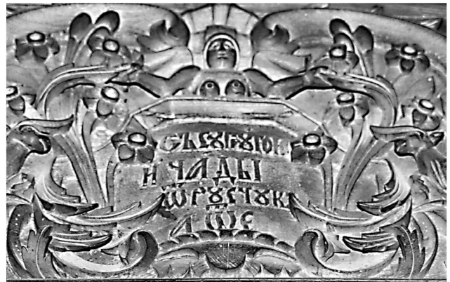
Εικ. 8. Μονή Ζωγράφου. Καθολικό. Επιγραφή κιβωρίου αγίας τράπεζας (1805).