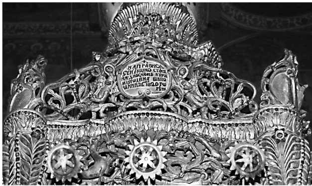
Εικ. 10. Μονή Ζωγράφου. Καθολικό. Επιγραφή προσκνηταρίου του αγίου Γεωργίου «Μολδαβίας» (1820).

ανακαίνισε την Αγίαν ταύτην Μονήν του Ζωγράφου». Βλ. Ε. Ν. Τσιγαρίδας - Α. Τριφονα, «Οι θαυματουργές εικόνες της μονής Ζωγράφου», Μακεδονικά 35 (2005-2006), 125-126.