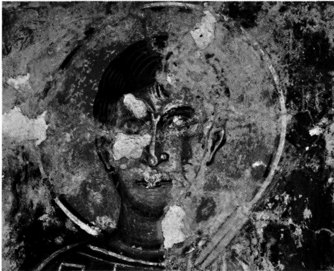
Εικ. 5. Ο άγιος Δημήτριος. Λεπτομέρεια.

Στον βόρειο τοίχο, στα δυτικά, πρώτος [Ο ΑΓΙΟΣ] ΔΗΜΗΤΡΗΣ στέκει ψηλόκορμος και μετωπικός, με αδρό πρόσωπο και αποφασιστικό βλέμμα (Εικ. 5). Η παράστασή του προσωποποιεί άριστα τον νέο αποτροπαικό, φυλακτικό ρόλο που του προσδόθηκε κατά την περίοδο της λατινοκρατίας 35 , και η μορφή του παραπέμπει σε