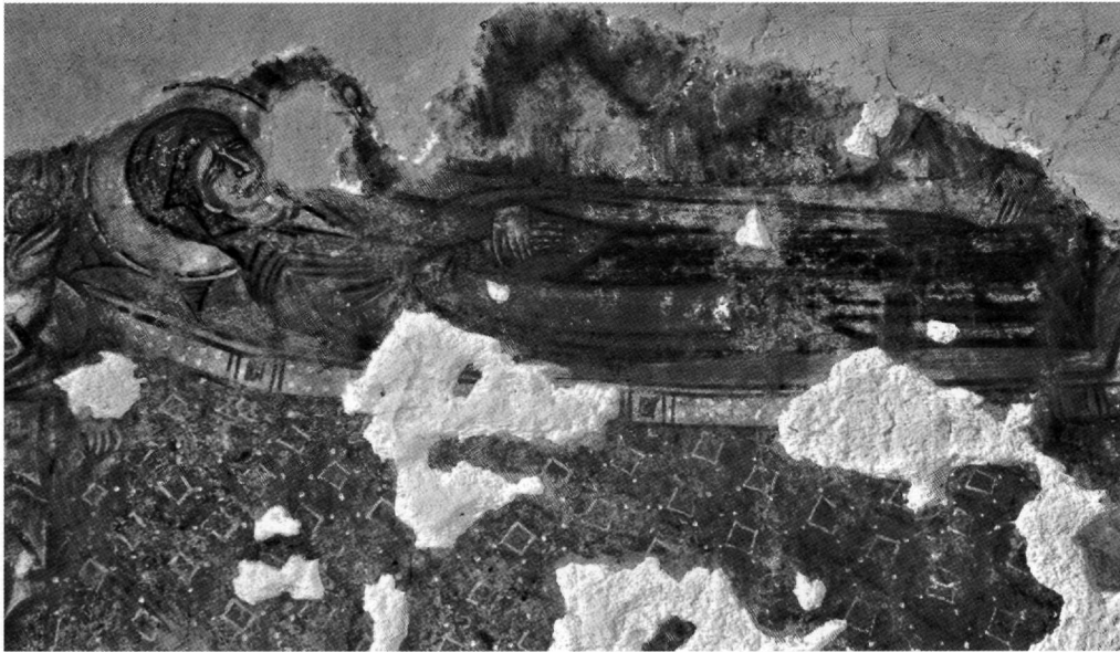
Εικ. 4. Η Κοίμηση της Θεοτόκου. Λεπτομέρεια.

ρουτίδες προβηβηκίας ηλικίας και με έντονη σύσπαση ματιών και φρυδιών, που εκφράζει θλίψη και οδύνη, ίσως απηχώντας έτσι τα γενικευμένα συναισθήματα των παρισταμένων στην επικείμενη ώρα.