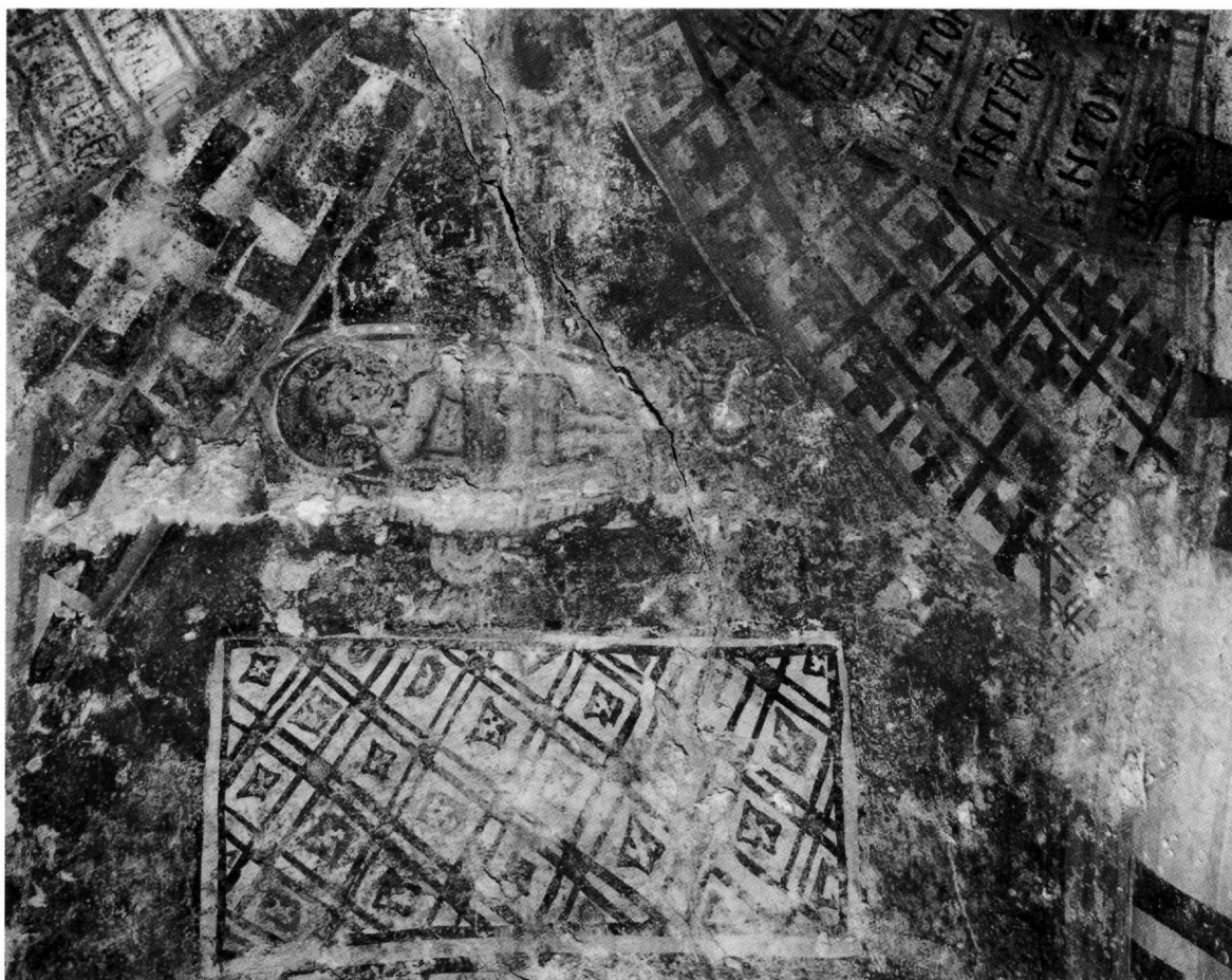
Εικ. 1. Ο Μελισμός και τμήμα από τους συλλειτουργούντες ιεράρχες.

στήθους (Εικ. 2), όπως ήδη σε ψηφιδωτό από τη μονή του Αγίου Μιχαήλ στο Κίεβο (1108-1113 περίπου) 7 , σε τοιχογραφίες στην Ευαγγελίστρια και στον Άγιο Νικόλαο στο Γεράκι Λακωνίας (τέλη 12ου και τελευταία 20ετία 13ου αι., αντίστοιχα) 8 και σε έργα του Παγωμένου 9 .