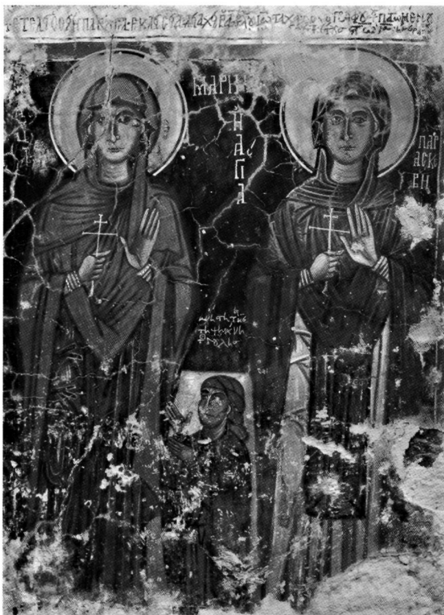
Εικ. 11. Οι αγίες Μαρίνα και Παρασκευή και ανώνυμη αφιερώτρια.

μα, με τα οποία έχουν απεικονιστεί οι δύο επόμενες αγίες. Η ΑΓΙΑ Η[Ρ]ΕΙΝΗ και [Η ΑΓΙΑ] ΚΥΡΗΑΚΥ (Εικ. 12), μορφές εντυπωσιακές, παριστάνονται ολόσωμες και μετωπικές, με την πρώτη ελάχιστα να προτάσσεται της δεύτερης. Η Ειρήνη κρατεί σταυρό μάργουρα στο δεξί της χέρι