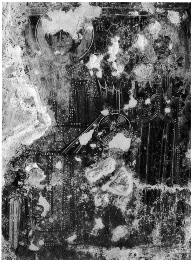
Εικ. 9. Ο αρχάγγελος Μιχαήλ, η αγία Βαρβάρα και ανώνυμη αφιερώτρια.

Με λευκωπή καλύπτρα στο κεφάλι, διανοσμένη με έγχρωμους στιγμωτούς ρόδακες, η αγία φορεί βαρύτιμο μανδύα, κοσμημένο με διάσπαρτο χαρακτηριστικό μοτίβο που δημιουργεί την εντύπωση πολύτιμων λίθων: λευκόστιγμα στεφάνη περιβάλλει λευκό κύκλο, με χρωματικά εναλλασσόμενο, έντονο κόκκινο ή πράσινο, εσωτερικό. Το διακοσμητικό αυτό θέμα φαίνεται να χρησιμοποιείται ευρύτατα στη μνημειακή ζωγραφική της νοτιότερης Ιταλίας κατά τον 13ο και τον 14ο αιώνα, όπως στο φαιλόνιο του αγίου Βασιλείου στην κρύπτη του San Vito Vecchio στην Gravina 75 , στον μανδύα ανώνυμης αγίας στη Santa Maria d'Elia στη Foggia 76 ή στο ένδυμα του Κωνσταντίνου στο παρεκκλήσιο του Αγίου Σιλβέστρου στους Santi Quattro Coronati στη Ρώμη 77 . Σε ανάλογη κοσμητική χρήση απαντά στο δεύτερο μισό του 13ου και στον 14ο αιώνα σε τοιχογραφίες της λατινοκρατούμενης Μάνης και της νησιωτικής Ελλάδας, όπως στους κώδικες που κρατούν οι απόστολοι Παύλος, Ιωάννης και Μάρκος στην Ανάληψη της Αγίτριας στη Μάνη (β' μισό 13ου αι.) 78 , στον χιτώνα της αγίας Ειρήνης στον Άγιο Δημήτριο στο Μακρυχώρι 79 , σπειρόμορφο εκεί, στην ποδέα της νεκρικής κλίνης στην Κοίμηση στον Άγιο Δημήτριο στο Πούρκο (τέλη 13ου αι.) και στον σάκκο του αρχαγγέλου Μιχαήλ στον Άγιο Νικόλαο στον Βύθουλα των Κυθήρων (13ος-14ος αι.) 80 . Όμοιο εντοπίζεται εξάλλου σε τοιχογραφίες ζωγράφων του κύκλου του Παγωμένου, όπως στην Παναγία στο Προδρόμι και στον Άγιο Ιωάννη στον