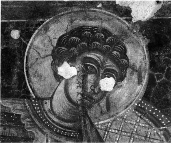
Εικ. 13. Ο άγιος Γεώργιος. Λεπτομέρεια.

δόκιμο στην εποχή βυζαντινό μεν, λατινογενή δε, όρο «ταβουλλάριος» ή και «νοτάριος» 119 .