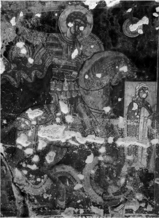
Εικ. 6. Ο δρακοντοκτόνος άγιος Γεώργιος και η αφιερώτρια Σταματινή.

και, πυκνότερος, διατρέχει το οφιοειδές σώμα του δράκοντα, πολλαπλά ελισσόμενο στα πόδια του αλόγου, το οποίο, με εύστοχο χρωματικό συνδυασμό, αποδίδεται τρισδιάστατο. Ιδιαίτερα εντυπωσιακό, ορμητικό σε κίνηση, το άτι έχει σχεδόν φυσιοκρατικά παρασταθεί ως ζωγραφική σπουδή δυτικού καλλιτέχνη. Έμφαση δίδεται στον δυνατό λαιμό, στην πλούσια καλλιγραφημένη χαιτή, στο μισάνοιχτο στόμα που αποκαλύπτει τα δόντια στο χρεμέτισμά του, όπως σε πίνακα με την Προσκύνηση των Μάγων του Bartolo di Fredi στην Εθνική Πινακοθήκη της Σιένας (1385-1388) 44 και ύστερα σε εικόνα ιδιωτικής