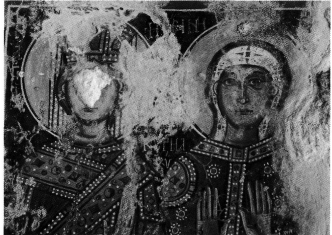
Εικ. 12. Οι αγίες Ειρήνη και η Κυριακή. Λεπτομέρεια.

Δύο τύποι γραπτού κοσμήματος διατηρούνται, που συμπληρώνουν τις τοιχογραφίες του μνημείου. Ο ένας, αποσπασματικά σωζόμενος, περιτρέχει ως ταινία τη βάση των τοίχων του κυρίως ναού, ενώ ο άλλος διανθίζει την ποδέα της αγίας τράπεζας στην παράσταση του Μελισμού (Εικ. 1), και, σε σπαράγματα, την ίδια την αγία τράπεζα στο ιερό. Ο πρώτος, γνωστός και από τον Άγιο Νικόλαο στη Μάζα 109 , επαναλαμβάνει πιο ελεύθερα, αλλά και συνοπτικά, το θέμα που κοσμεί τη βάση εικόνας με τη Θεοτόκο Ελεούσα στη μονή του Αγίου Νεοφύτου στην Πάφο (τέλη 12ου αι.) 110 και συντίθεται από χρωματικά εναλλασσόμενα όρθια και ανεστραμμένα ανθέμια που εγγράφονται σε τρίγωνα. Ο δεύτερος απαρτίζεται από πλέγμα ρόμβων με μικρά τετράφυλλα στο κέντρο, μοτίβο αρκετά διαδεδομένο, το οποίο κοσμεί, μεταξύ άλλων, ενισχυτικό τόξο στον Άγιο Κοσμά στα Φριλιγιάνικα των Κυθήρων (13ος αι.) 111 , το άγιο Μανδήλιο στο νότιο παρεκκλήσιο του ναού της Παναγίας στη Studenica (περ. 1235) και το μαξιλάρι της Άννας στο Γενέσιον του ναού του κράλη στην ίδια μονή (1313-1314) 112 , και αποτελεί το θέμα διακοσμητικής ταινίας στον βόρειο τοίχο του Αγίου Νικολάου στη Μάζα 113 .