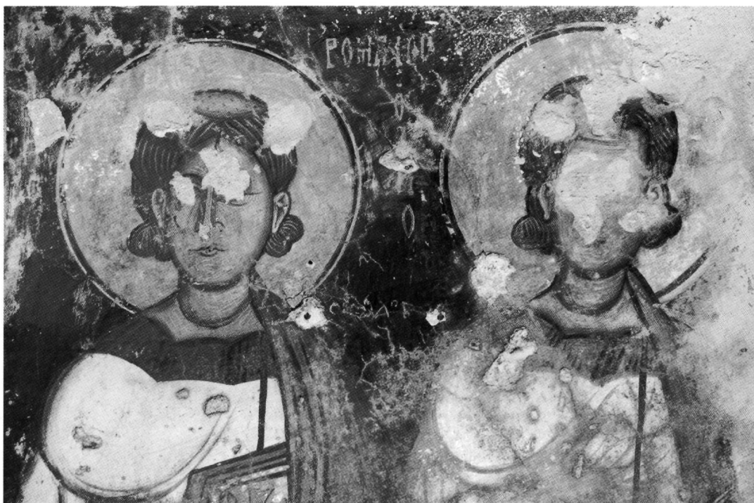
Εικ. 2. Ο Ρωμανός και αταύτιστος διάκονος. Λεπτομέρεια.

Το αρχιτεκτονικό βάθος στο σύνολό του, πολύ περισσότερο εμπλουτισμένο, αλλά ανάλογο στα κύρια, δομικά του συστατικά, ζωγραφίζεται αργότερα στον Ευαγγελισμό στην Παντάνασσα του Μυστρά (περ. 1428) 10 . Μπροστά στο κιβώριο, μόλις έχει φθάσει ο Γαβριήλ, αν κρύνουμε από το ελαφρά μετέωρο αριστερό του πόδι με το κεκαμμένο γόνατο και από το, ακόμη σε κίνηση, «σπηλαιόμορφο» απόπτρυγμα 11 του πολύπτυχου ιματίου του. Στην είσοδο του προστώου η Παναγία κάθεται σε ευρύ ημκυκλικό θρόνο 12 , με κιονίσκους στην πρόσοψη και ταινία πολύτιμων λίθων στο πάχος της απόληξης της πλάτης. Το σχήμα του θρόνου, η έντονη αντικίνηση της ευαγγελιζομένης και η στάση των χειρών της, με το δεξιό