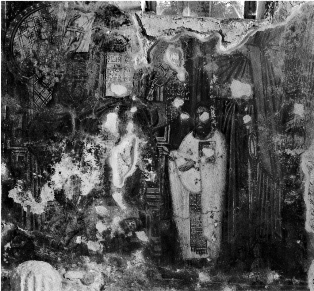
Εικ. 10. Ο ένθρονος Χριστός, ο άγιος Ιωάννης ο Πρόδρομος και ο Ιωάννης ιερέας ο νομικός.

στην Αγία μονή Βιάννου (15ος αι.), έργο του Αγγέλου 95 . Στον δυτικό τοίχο και αριστερά της εισόδου, σε θέση συνήθη, ως φύλακές της 96 , Η ΑΓΙΑ ΜΑΡΗ[ΝΑ] και Η ΑΓΙΑ ΠΑΡΑΣΚΕΥΗ (Εικ. 11), εικονίζονται ολόσωμες και μετωπικές, με σταυρό στο δεξί χέρι και σεβίζουσες με το αριστερό, με την παλάμη προς τα έξω, χειρονομία που επίσης συμβολίζει αγνότητα και παρθενία 97 . Ανάμεσά τους, σε ιδιαίτερο πίνακα με φόντο φωτεινό, ανώνυμη αφιερώτρια προστρέχει ικέτις στην, πιθανότατα