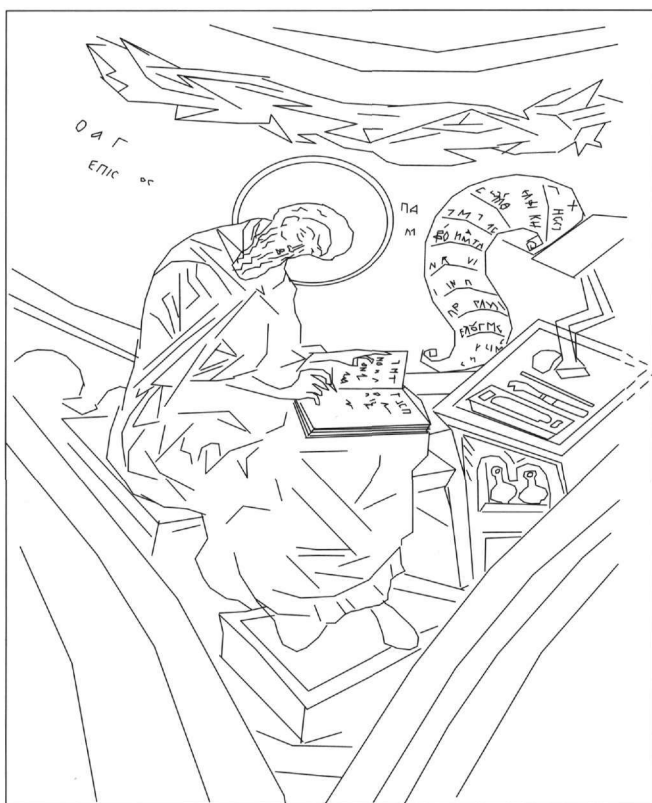
Εικ. 6. Ο άγιος Γρηγόριος ο Παλαμάς. Τοιχογραφία στο νότιο παρεκκλήσιο της μονής Βλατάδων (τελευταίο τέταρτο 14ου αι.) (σχέδιο ΑΙ. Τριφονοβα).

δων (Εικ. 6), καθώς και στο ναό του Αγίου Δημήτριου (μετά το 1368) 19 .