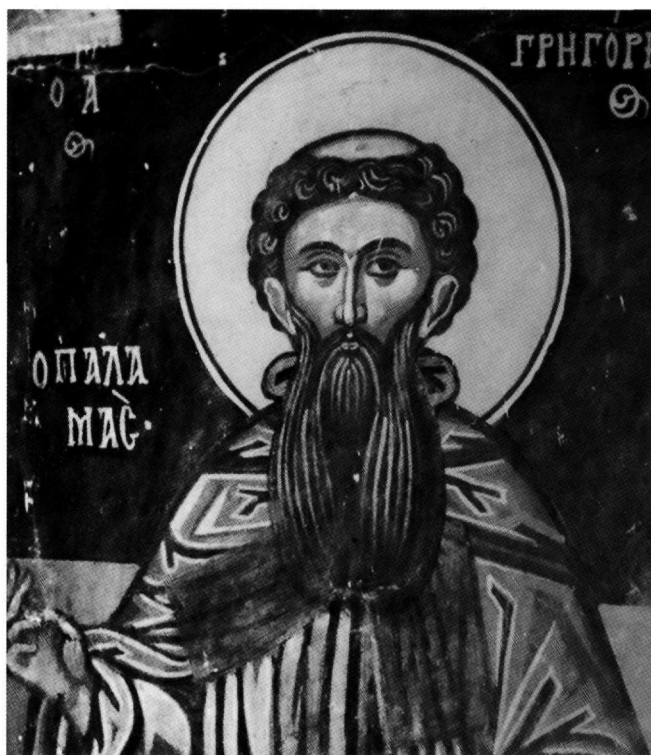
Εικ. 8. Ο άγιος Γρηγόριος ο Παλαμάς. Τοιχογραφία στον νάρθηκα του Αγίου Γεωργίου του Βουνού (δεύτερο μισό 16ου αι.). Λεπτομέρεια.

Η προσωνυμία του αγίου Γρηγορίου του Παλαμά «Νέος Χρυσόστομος» 37 , με την οποία όμως αποκαλείται σχετικά σπάνια, οφείλεται στο γεγονός ότι ο Παλαμάς θεωρήθηκε ιάξιος και ισοστάσιος με τον άγιο Ιωάννη τον Χρυσό-