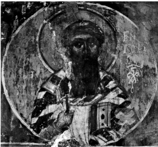
Εικ. 1. Ο άγιος Γρηγόριος ο Παλαμάς. Τοιχογραφία στον κυρίως ναό του Αγίου Γεωργίου του Βουνού.