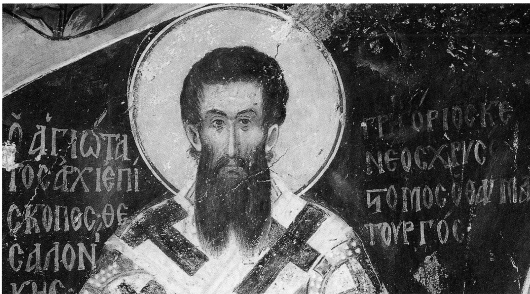
Εικ. 4. Ο άγιος Γρηγόριος ο Παλαμάς. Τοιχογραφία στο παρεκκλήσιο των Αγίων Αναργύρων στη μονή Βατοπεδίου (γύρω στο 1371 ή τέλη 14ου-αρχές 15ου αι.). Λεπτομέρεια.

(γύρω στο 1371 ή τέλη 14ου-αρχές 15ου αι.) 16 (Εικ. 4), όπου μάλιστα συνοδεύεται από τον άγιο Ιωάννη τον Χρυσόστομο.