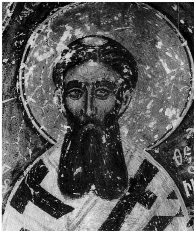
Εικ. 3. Ο άγιος Γρηγόριος ο Παλαμάς. Τοιχογραφία στο ναό των Αγίων Τριών στην Καστοριά (1400/1). Λεπτομέρεια.

Η τοιχογραφία του αγίου Γρηγορίου του Παλαμά στο ναό του Αγίου Γεωργίου του Βουνού αποτελεί πιθανότατα την πρωιμότερη έως τώρα γνωστή απεικόνισή του σε ναό της Καστοριάς. Στην ίδια πόλη απεικονίζεται, στις αρχές του 15ου αιώνα, στο ναό των Αγίων Τριών (Γουρία, Αβίβου και Σαμωνά) (1400/1) 15 , όπου αποδίδεται ολόσωμος, μέσα στη κόγχη του διακονικού (Εικ. 3), συνοδευόμενος από τον άγιο Εύπλο. Στους Αγίους Τρεις ο άγιος Γρηγόριος ο Παλαμάς αποδίδεται, όπως και στον Άγιο Γεώργιο του Βουνού, ως μεσήλικας ιεράρχης, με καστανή κόμη και παπαλήθρα και ομοιόχρωμη γενειάδα. Είναι ενδεδυμένος με πολυσταύριο φαιλόνιο και κρατάει κλειστό κώδικα ευαγγελίου. Ανάλογη θέση απεικόνισης μέσα σε κόγχη, όχι του διακονικού, αλλά της πρόθεσης, κατέχει ο άγιος στο παρεκκλήσιο των Αγίων Ανάργυρων στη Μονή Βατοπεδίου