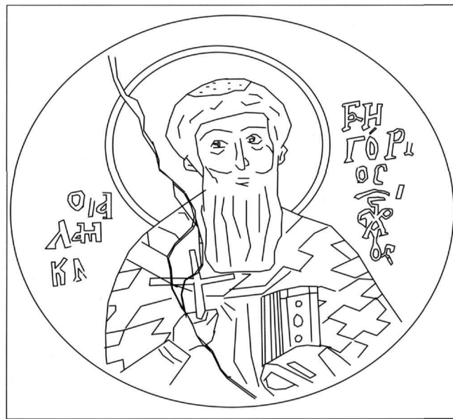
Εικ. 2. Ο άγιος Γρηγόριος ο Παλαμάς. Τοιχογραφία στον κυρίως ναό του Αγίου Γεωργίου του Βουνού (σχέδιο Αl. Trifonova).

Στη δεύτερη ζώνη με τους αγίους σε προτομή, μέσα σε μετάλλια, επάνω από τη νότια θύρα εισόδου, ανάμεσα στον άγιο Ερμόλαο και στον άγιο Άβιβο, εικονίζεται ένας ιεράρχης (Εικ. 1 και 2). Για τον άγιο αυτό έχουν εκφρασθεί οι απόψεις ότι είναι «αδιάγνωστος ιεράρχης» 6 και ότι είναι ο «ΓΡ[Η]ΓΟ[ΡΙ]ΟΣ», πολύ πιθανόν ο Θαυματουργός 7 . Η μορφή του αγίου δεν σώζεται σε καλή κατάσταση λόγω της αλλοίωσης των χρωμάτων και της ρωγμής που την διατρέχει. Επιπλέον, η τοιχογραφία καλύπτεται σήμερα με πανί για να την προστατεύσει από ενδεχόμενη αποκόλληση του κονιάματος από την τοιχοποιία, γεγονός που την καθιστά δυσδιάκριτη, ενώ η επιγραφή που την συνοδεύει είναι, κάτω από τις συνθήκες αυτές, σχεδόν δυσανάγνωστη. Ο άγιος εικονίζεται σε προτομή, μέσα σε μετάλλιο με γαλάζιο βάθος. Αποδίδεται ως μέσης ηλικίας ιεράρχης, με καστανή