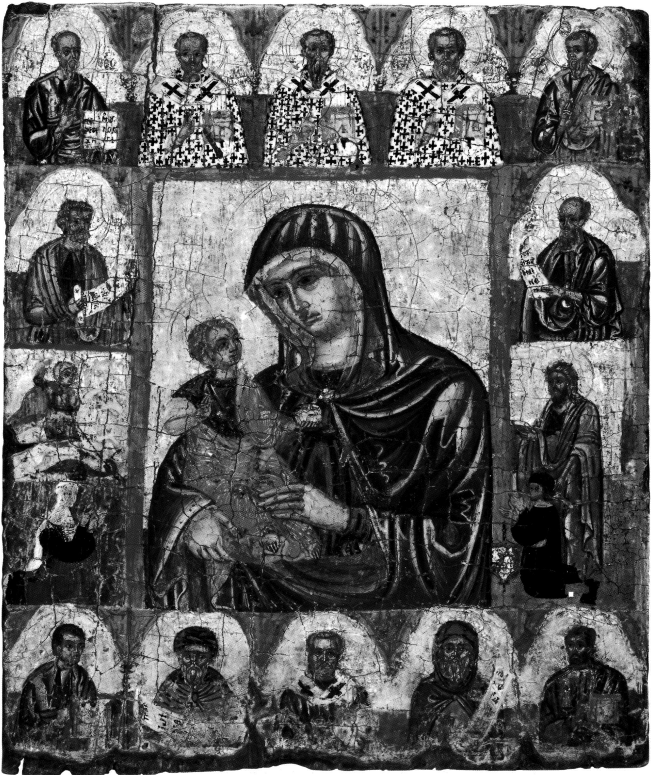
Fig. 1. Zanzia, église de Panagia Éléousa. Madre della Consolazione, 1510. Icône attribuée à Syméon Axentis.