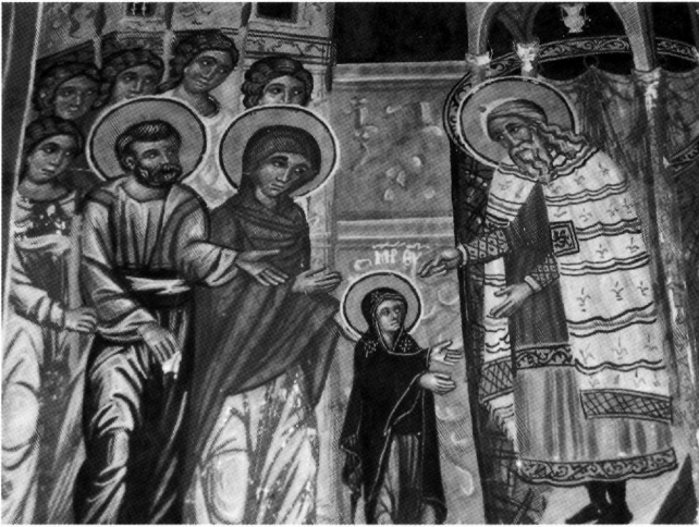
Fig. 4. Galata, église de Saint-Sozoméno, 1513. Présentation de la Vierge au Temple, détail.