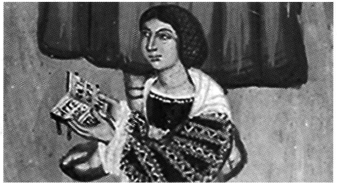
Fig. 9. Galata, église de Théotokos/Archangélos, 1514. Fresque dédicatoire, détail.