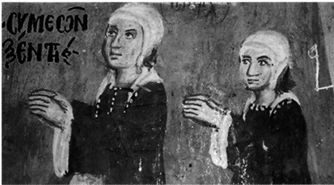
Fig. 8. Galata, église de Théotokos/Archangélos, 1514. Fresque dédicatoire, détail.

Ces rapports et cette continuité entre Philippe Goul et les peintres qui ont suivi dans un temps immédiat, ont été jusqu'à présent faussés par la datation en 1502 des fresques de Pa-