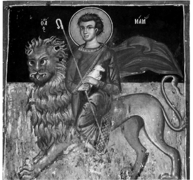
Fig. 5. Galata, église de Saint-Sozoméno, 1513. Saint Mamas.

Nous proposons d'attribuer à Syméon Axentis, ou à son atelier, certaines des fresques (à notre connaissance encore inédites) qui subsistent à l'église de Panagia à Érimi, près de Limassol, comme p. ex. les Pères dans l'abside et saint Damien.