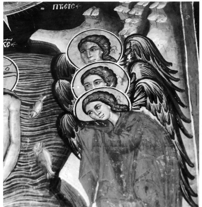
Fig. 6. Galata, église de Saint-Sozoméno, 1513. Baptême du Christ, détail.

Si les rapports notés dans cette recherche entre l'icône de Zanatzia et des fresques de Philippe Goul sont surtout iconographiques, les liens qu'on décèle avec Syméon Axentis sont plus profonds. Ils se situent dans le maniement du pinceau, dans la façon de dessiner les contours (les traits du visage de la Vierge et du Christ, les yeux de la Vierge), de modeler les volumes (avec p. ex. un triangle clair au-dessus de la lèvre, du côté éclairé du visage), de dessiner les sourcils avec quelques lignes. On retrouve cette façon de rendre les visages non seulement dans les traits de sainte Anne dans la Présentation de la Vierge au Temple, de saint Mamas, ou des anges dans le Baptême du Christ à Saint-Sozoméno en 1513 (Fig. 4, 5 et 6), mais aussi dans les portraits de Mandéléna et de ses enfants à Théotokos/Archangélos en 1514 (Fig. 7 et 8) 33 . Le geste rapide qui trace des lignes parallèles et qui laisse voir le mouvement de haut vers le bas, pour indiquer les parties éclairées des plis, se rencontre dans le maphorion de la Vierge de l'icône et dans l'habit de saint Jean-Baptiste dans l'image dédicatoire de Théotokos/Archangélos, pour ne mentionner qu'une seule fresque (Fig. 9).