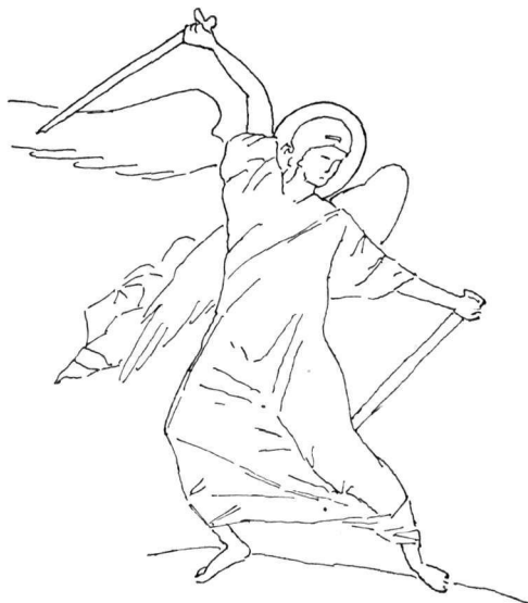
Εἰκ. 4. Ὁ ἐξολοθρευτὴς Ἄγγελος. Λεπτομέρεια ἐκ τοιχογραφίας τοῦ παρεκκλησίου τῆς Μονῆς τῆς Χώρας Κωνσταντινουπόλεως.

Καιρὸς ἤδη γὰ ἔλθωμεν εἰς τὰ δύο πρόσωπα τῆς συνθέσεως, τὸν Ἄρχάγγελον καὶ τὸν Ἄρχιππον. Ὁ Ἄρχάγγελος Μιχαὴλ εἰς τὴν ἡμετέραν εἰκόνα ἐπαναλαμβάνει εἰς τὴν ὅλην παράστασιν, πλὴν τῆς διατάξεως τῶν πτερυγῶν καὶ τοῦ ἱματίου, τὴν μικρογραφίαν τοῦ Μηνολογίου τοῦ Βατικανοῦ (εἰκ. 1), ἀπὸ τὴν ὁποίαν ἔχει ἐκφύγει κάπως ὁ ζωγραφήσας τὴν εἰκόνα τῆς Μονῆς