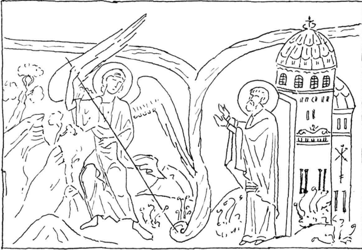
Εἰκ. 1. Μικρογραφία τοῦ Μηνολογίου τοῦ Βασιλείου Β' εἰς τὴν Βιβλιοθήκην τοῦ Βατικανοῦ.

δὲν ἀπατῶμαι, ἢ παλαιότερα γνωστὴ ἀπεικόνισις τοῦ θέματος, ὅπως καὶ εἰς ἄλλα συγγενῆ μνημεῖα τῶν χρόνων τῶν Κομνηνῶν 1 , εἰκονίζονται δύο ποταμοί, σχηματίζοντες δύο τόξα, πού πλαισιώνουν, κατὰ τρόπον λίαν διακοσμητικόν, τὰς μορφὰς τῆς συνθέσεως, τὸν Ἄρχαγγελον δηλαδὴ καὶ τὸν Ἄρχιεπίσκοπον, καὶ ἔπειτα, συνενούμενοι, κατέρχονται κατακορύφως πρὸς τὰ