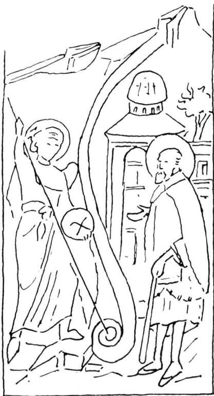
Εἰκ. 2. Τοιχογραφία εἰς τὴν Γκρατσάνιτσαν τῆς Σερβίας.

Ἡ ζωγραφικὴ τῶν Παλαιολόγων διεισήρθη ἀμετάβλητον σχεδὸν εἰς τὰς γενικὰς γραμμὰς τὴν παράστασιν