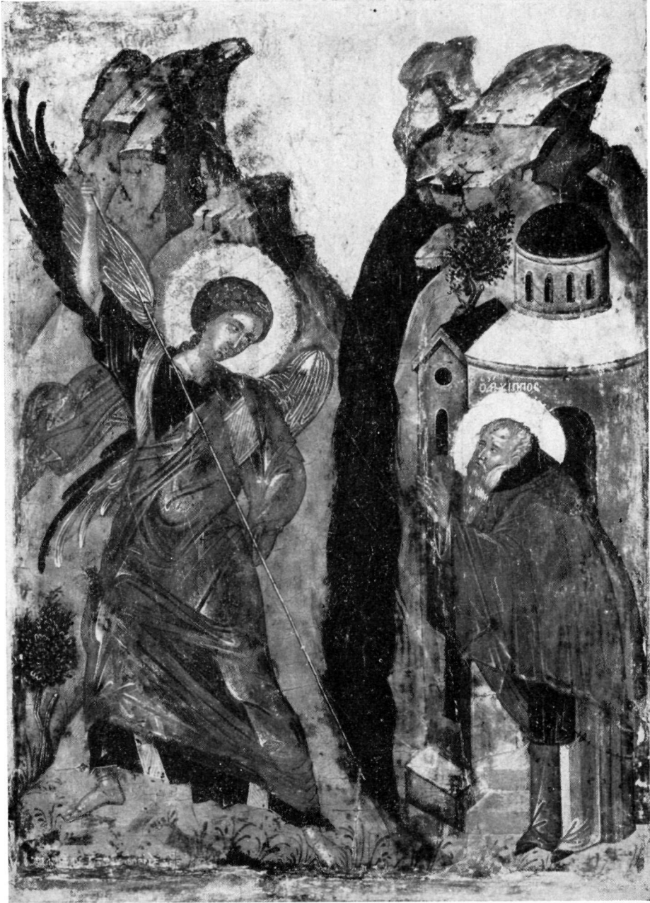
Τὸ ἐν Χώναις θαῦμα τοῦ Ἀρχαγγέλου Μιχαήλ. Εἰκὼν τῆς Συλλογῆς Δ. Λοβέρδου.