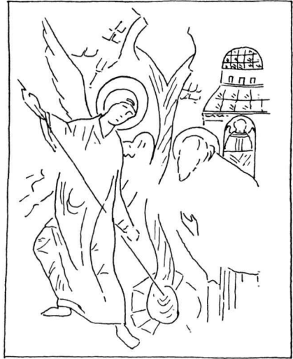
Εἰκ. 3. Εἰκὼν εἰς τὸ Μουσεῖον Βελιγραδίου.

Οὐσιώδης εἶναι ἐπίσης ἡ διαφορὰ τῶν ἔργων τῆς ἐποχῆς τῶν Παλαιολόγων ἀπὸ τὰ παλαιότερα καὶ ὡς πρὸς τὴν ἀπεικόνισιν τῶν βράχων. Εἰς τὴν μικρογραφίαν τοῦ Μηνολογίου τοῦ Βατικανοῦ (εἰκ. 1) οἱ βράχοι εἶναι χαμηλοὶ καὶ σχεδὸν ὑποτυπώδεις, συντελοῦντες οὕτω διὰ τῆς μικρότητός των εἰς τὴν ἕξαρσιν τῆς πρὸ αὐτῶν μεγαλοπρεποῦς μορφῆς τοῦ Ἀρχαγγέλου. Εἰς τὴν ἐκ τῶν χρόνων τῶν Κομνηνῶν εἰκόνα τῆς Μονῆς Σινᾶ, τὴν ὁποίαν ἀνεφέραμεν ἀνωτέρω 3 , οἱ βράχοι ἔχουν ἔξαφανισθῆ. Οὗτοι ἐπανερχονται εἰς τὰ μνημεῖα τῶν χρόνων τῶν Παλαιολόγων ὑπὸ μορφήν ἐπιβλητικὴν, δεσπύζοντες τῆς ὅλης συνθέσεως μὲ