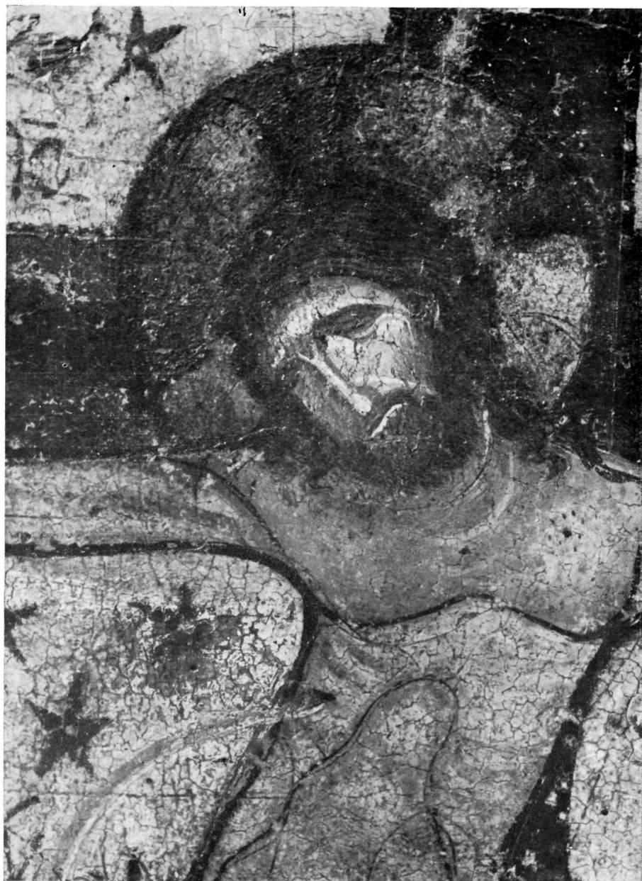
Ὁ Χριστὸς τῆς εἰκόνης τῆς Σταυρώσεως (λεπτομέρεια τοῦ πίν. 54).