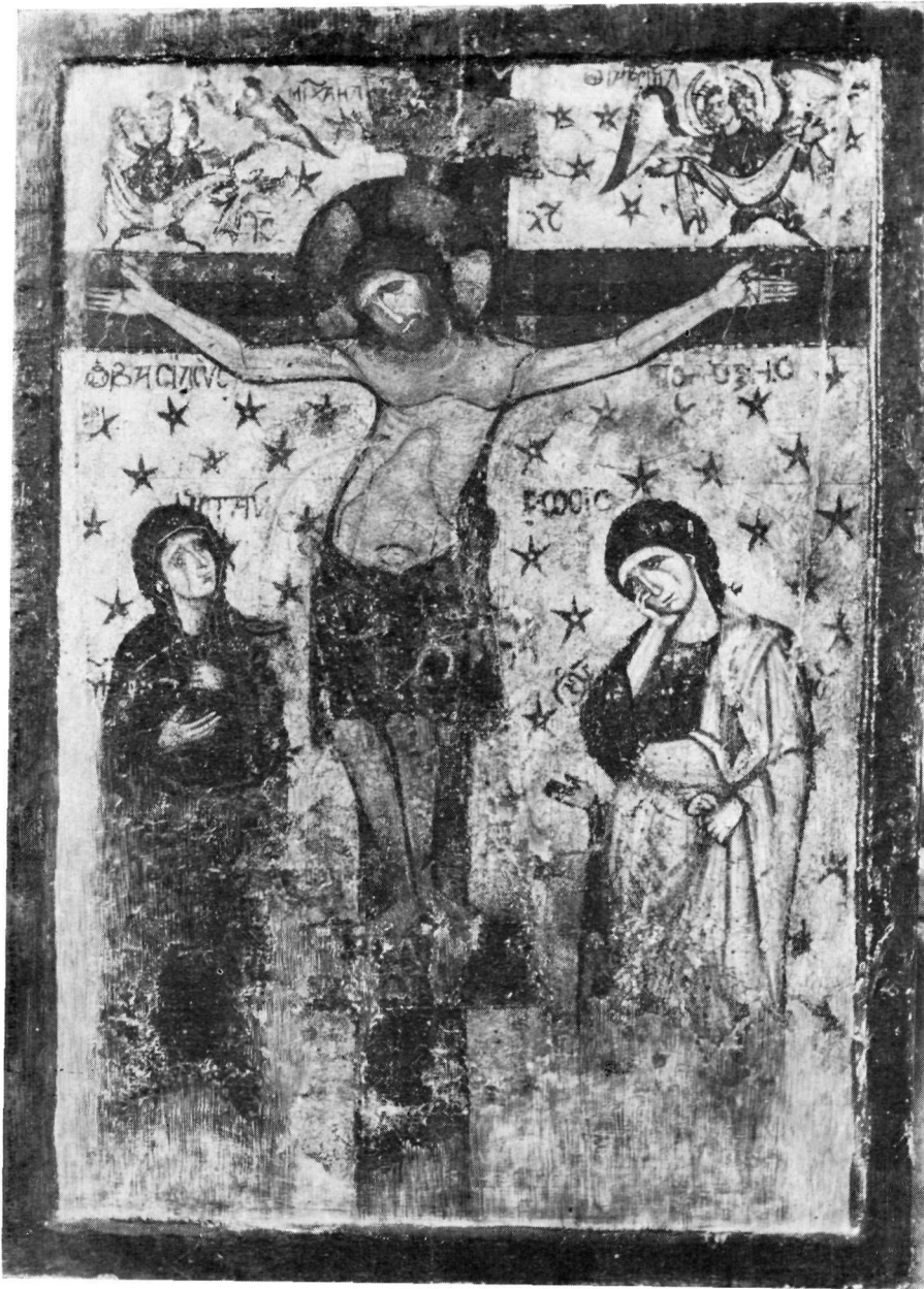
Εἰκὼν τῆς Σταυρώσεως. Βυζαντινὸν Μουσεῖον Ἀθηνῶν.