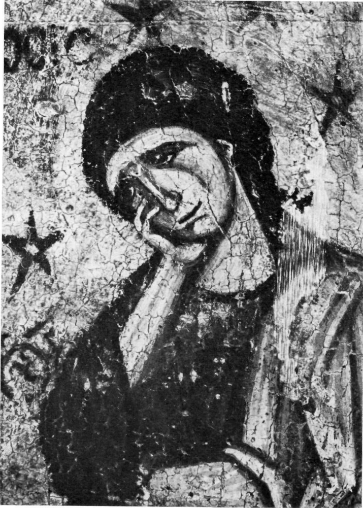
Ὁ Ἅγ. Ἰωάννης τῆς εἰκόνης τῆς Σταυρώσεως (λεπτομέρεια τοῦ πίν. 54).