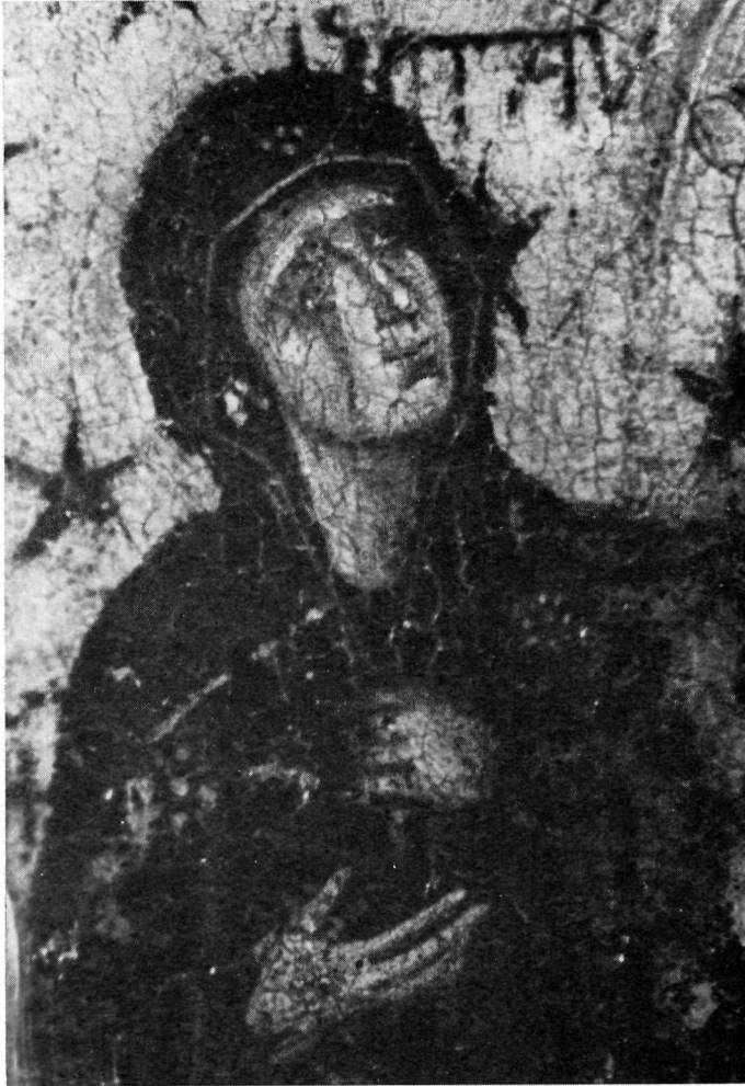
Ἡ Θεοτόκος τῆς εἰκόνης τῆς Σταυρώσεως (λεπτομέρεια τοῦ πίν. 54).