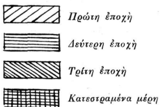
Είχ. 1. Σχεδιάγραμμα τῶν διαφορῶν ἐποχῶν τῆς εἰκόνας τῆς Σταυρώσεως.