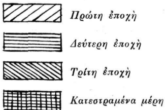
Είχ. 1. Σχεδιάγραμμα τῶν διαφορῶν ἐποχῶν τῆς εἰκόνας τῆς Σταυρώσεως.