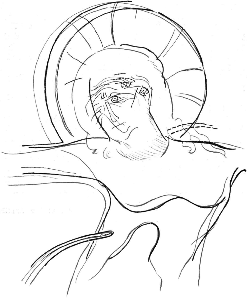
Είχ. 2. Σχεδιάγραμμα με τὰ διακρινόμενα στὴν ἀκτινογραφικὴ πλάκα ἀρχαιότερα πρόσωπα.