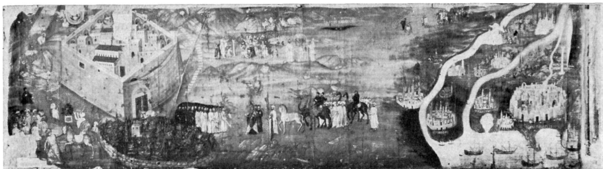
Εἰκὼν ἐπιμίμων τῆς Μονῆς Σινᾶ καὶ ἱστορικῶν σκηνῶν τῆς ἐρήμου.