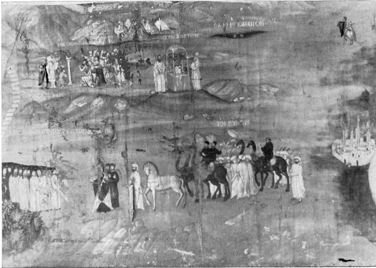
Λεπτομέρεια τοῦ πίνακος 1. Ἡ προσέλευσις τοῦ Ἀρχιεπισκόπου τοῦ Σινᾶ εἰς τὴν Μονὴν καὶ σκηναὶ τῆς Π. Διαθήκης.