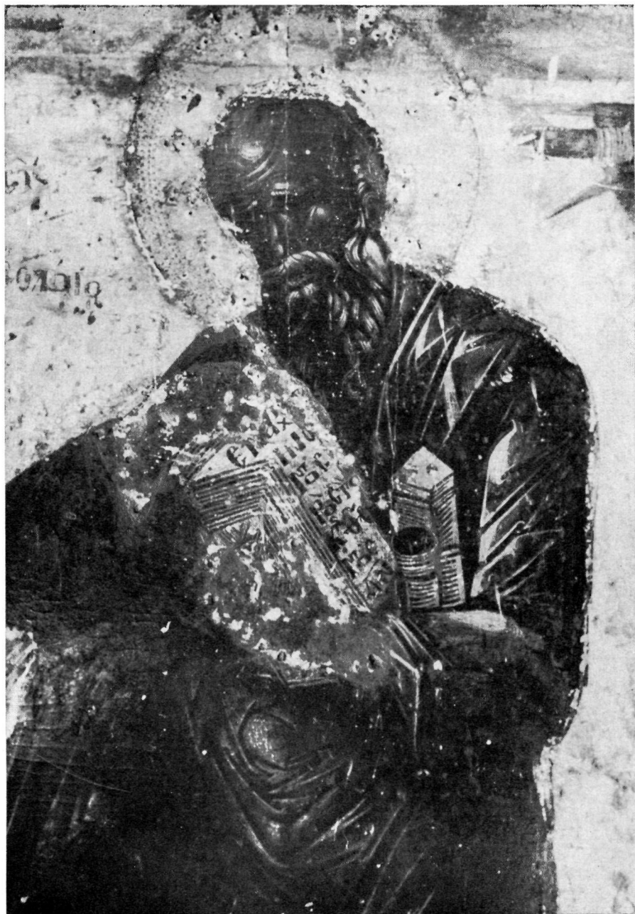
Λεπτομέρεια τῆς εἰκόνης Πίν. 35.