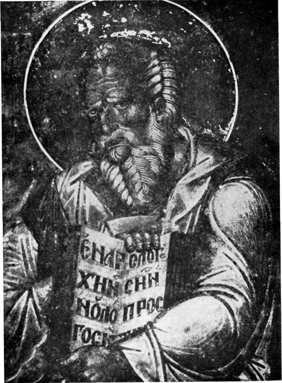
Ὁ Ἅγιος Ἰωάννης ὁ Θεολόγος (1389). Τοιχογραφία Μονῆς Ἁγίου Ἀνδρέου παρὰ τὰ Σκόπια (Ραδοζιέις).