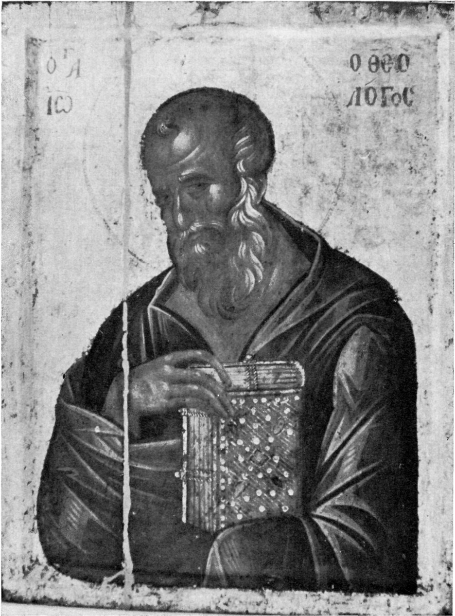
Φωτογραφία Φ. Ζαχαρίου

Ὁ Ἅγιος Ἰωάννης ὁ Θεολόγος. Εἰκὼν ἐκ τῆς Μεγάλης Δεήσεως τῆς Μ. Χελανδαρίου Ἁγίου Ὄρους.