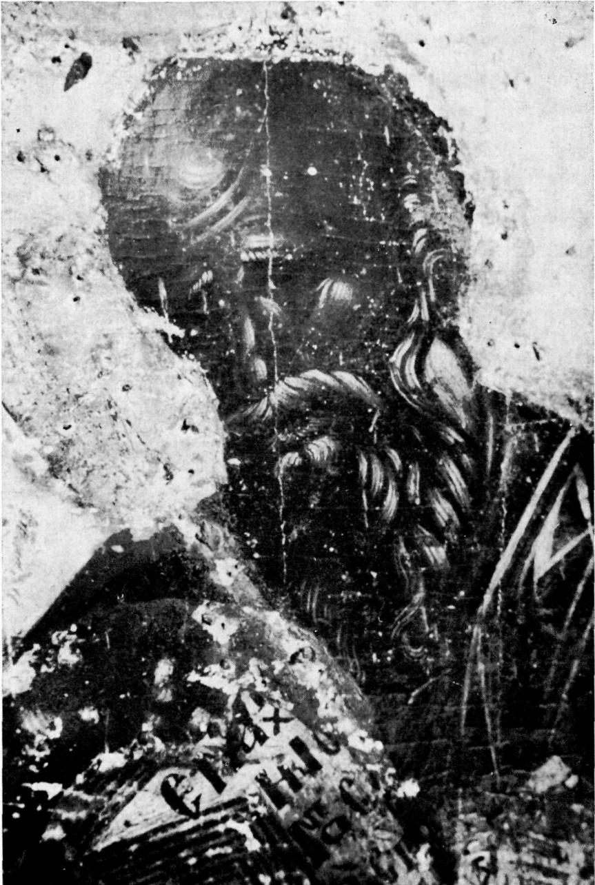
Λεπτομέρεια τῆς εἰκόνας Πίν. 35.