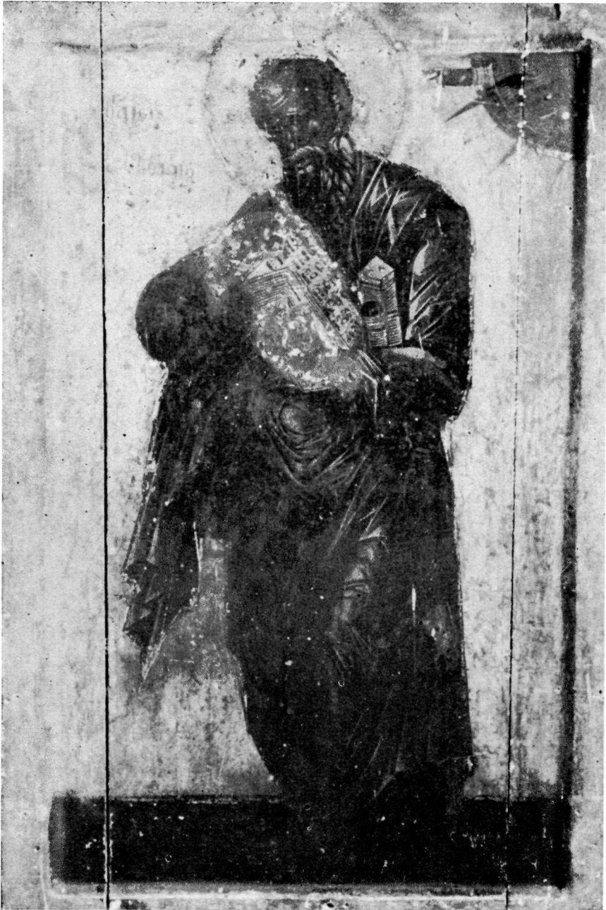
Ὁ Ἅγιος Ἰωάννης ὁ Θεολόγος. Εἰκὼν εἰς τὴν Φανερωμένην Ζακύνθου καταστραφεῖσα τὸ 1953.