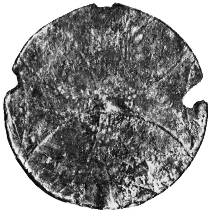
Εύλογία τοῦ Ἁγίου Μάμα Βυζαντινὸν Μουσεῖον Ἀθηνῶν