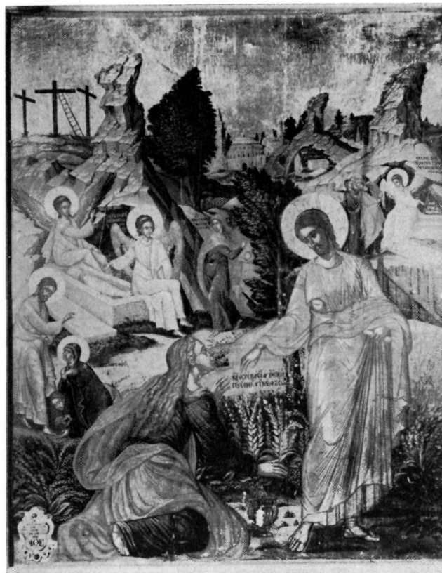
2. Εικόνα Μιχαήλ Δαμασκηνοῦ. "Αγιος Μηνάς Ἡρακλείου.