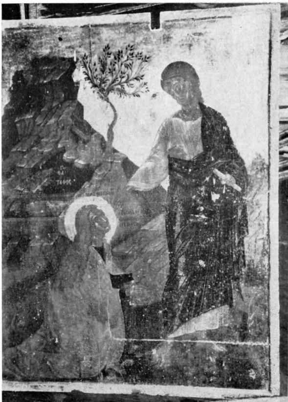
1. Εικόνα Παλαιού Μουσείου Ζακύνθου.