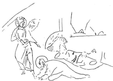
Εικ. 10. Τοιχογραφία Θεοφάνη του Έλληνας, Volotono.

Ἡ περίπτωση αὐτὴ δὲν εἶναι ἡ μόνη ὅπου διαπιστώνουμε τὴν συγγένεια τῶν δύο αὐτῶν θεμάτων. Στὸ Volotono, τὸ 1360, ὁ Θεοφάνης ὁ Ἕλληνας ζωγραφίζει τὸ «Μὴ μοῦ ἄπτου» 2 (εικ. 10) σὲ ἀπόλυτη ὁμοιότητα καὶ ἀντιστοιχία μετὰ τὴν Αἰμορροούσα τῆς Μονῆς τῆς Χώρας στὴν Κωνσταντινούπολη 3 . Ἡ ἐξάρτηση τοῦ Volotono ἀπὸ τὴν Κωνσταντινούπολη εἶναι γνωστὴ, ἀλλὰ κάνει πραγματικὰ ἐντύπωση ἡ τόση ὁμοιότης ποὺ καὶ παλιότερα εἶχε παρατηρηθῆ 4 καὶ βεβαιώνει πὼς ὁ καλλιτέχνης ἔχει τὴν ἐλευθερίανὰ δανεῖζεται εἰκονογραφικὰ στοιχεῖα ἀπὸ διαφορετικὰ πρότυπα, ὅταν αὐτὸ τὸν βοηθάει γιὰ τὴ σύνθεση.