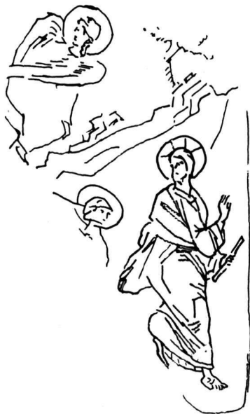
Εἰκ. 8. Τοιχογραφία Dečani.

Πραγματικά ἡ ἔντονη κίνηση φυγῆς τοῦ Χριστοῦ στοῦ « Μὴ μοῦ ἄπτου » τοῦ Dečani 1 (εἰκ. 8) εἶναι ἀνάλογη μὲ τὴν κλίση τοῦ σώματος τοῦ Χριστοῦ στὶς δυτικῆς παραστάσεις τοῦ « Μὴ μοῦ ἄπτου » π.χ. στοῦ Ἴσπανικὸ παρεκκλήσι τῆς Santa Maria Novella στὴ Φλωρεντία στὴ σύνθεση τοῦ Taddeo Gaddi 2 καὶ στὴ Maestà τοῦ Duccio 3 ,