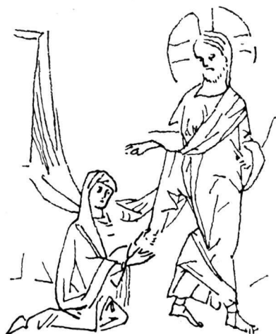
Εικ. 9. Το θαύμα της Αίμορροούσας. Μικρογραφία χειρογράφου Ευαγγελίου (Par. Gr. 54).

χειρόγραφο Par. 54 1 π.χ., (εικ. 9) με την παράσταση στο Dečani, θα δούμε ότι ο Χριστός έχει ακριβώς την ίδια τάση φυγής, πράγμα που φανερώνει ένδεχόμενη σχέση μεταξύ του Κωνσταντινοπολίτικου αυτού χειρόγραφου και του Σέρβικου μνημείου.