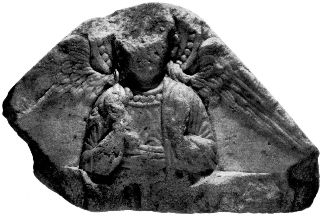
Bas. relief byzantin de la Collection de l'Ermitage.