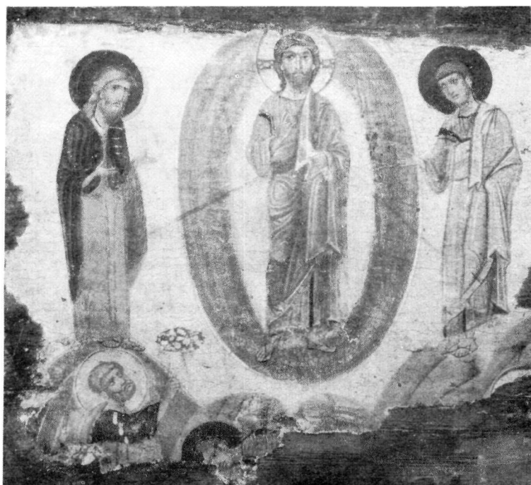
ERMITAGE β. Μεταμόρφωσις.