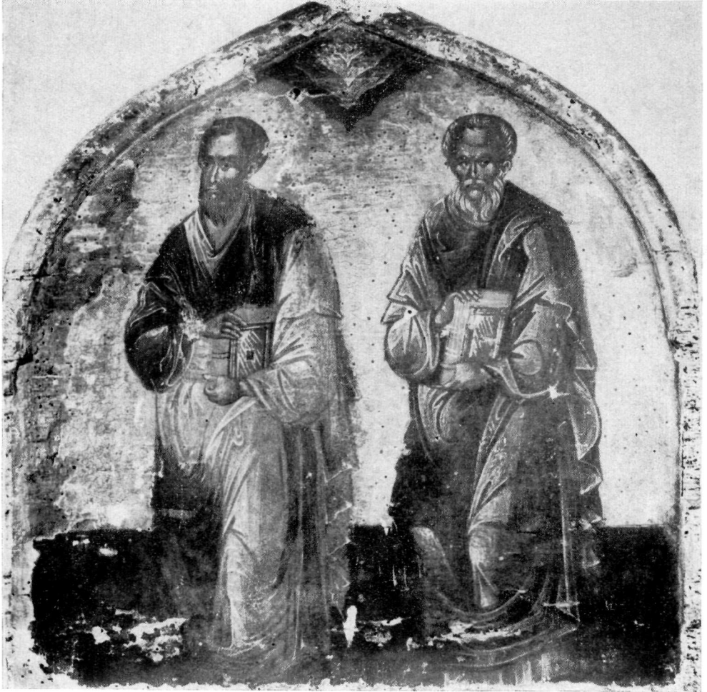
ΜΟΥΣΕΙΟ ΘΕΣΣΑΛΟΝΙΚΗΣ Ἐπιστολικά (τμήμα).