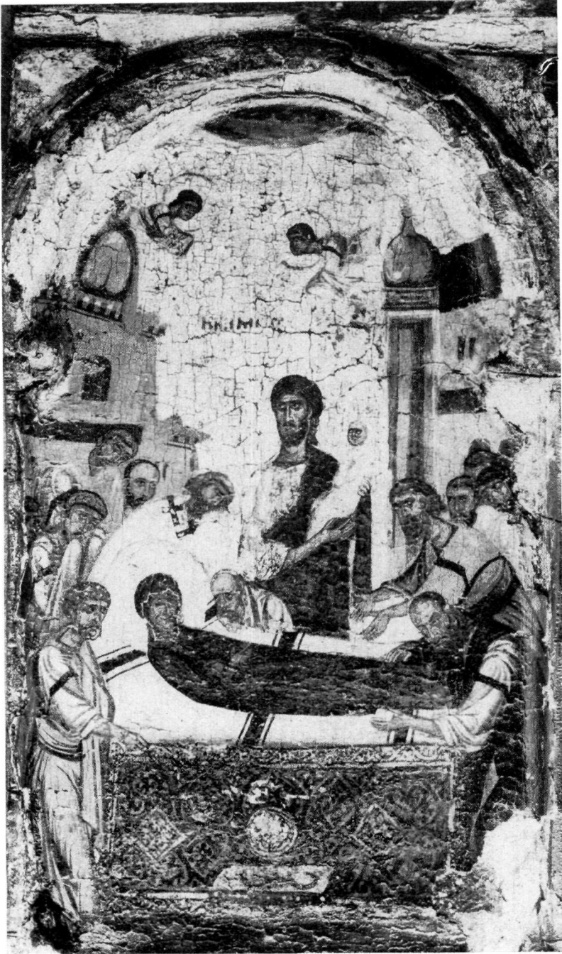
ΜΟΝΗ ΛΑΥΡΑΣ Κόμησης τῆς Θεοτόκου.