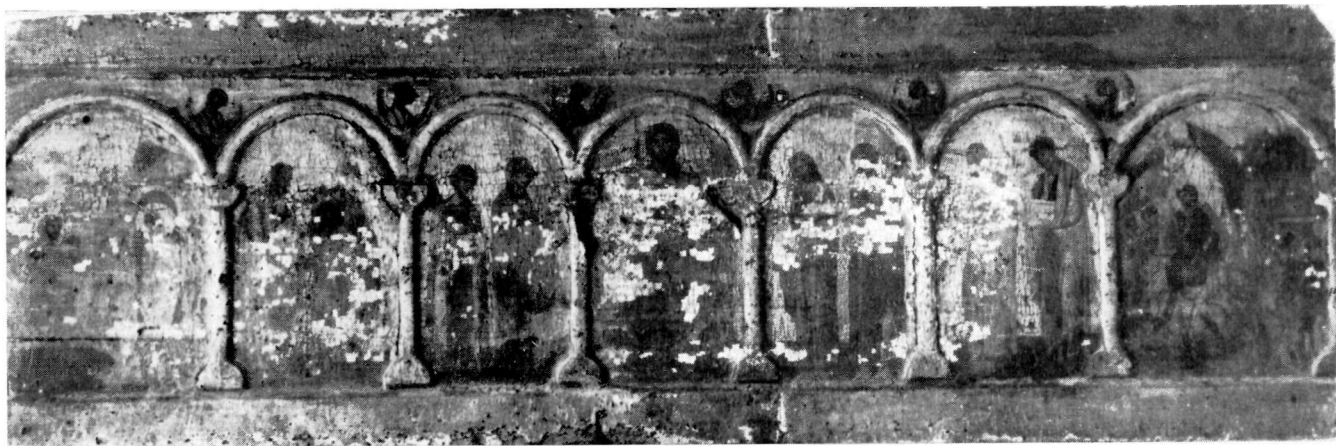
ΜΟΝΗ ΒΑΤΟΠΕΔΙΟΥ Εικόνα ἐπιστολίου. Μεσαῖο τμήμα.