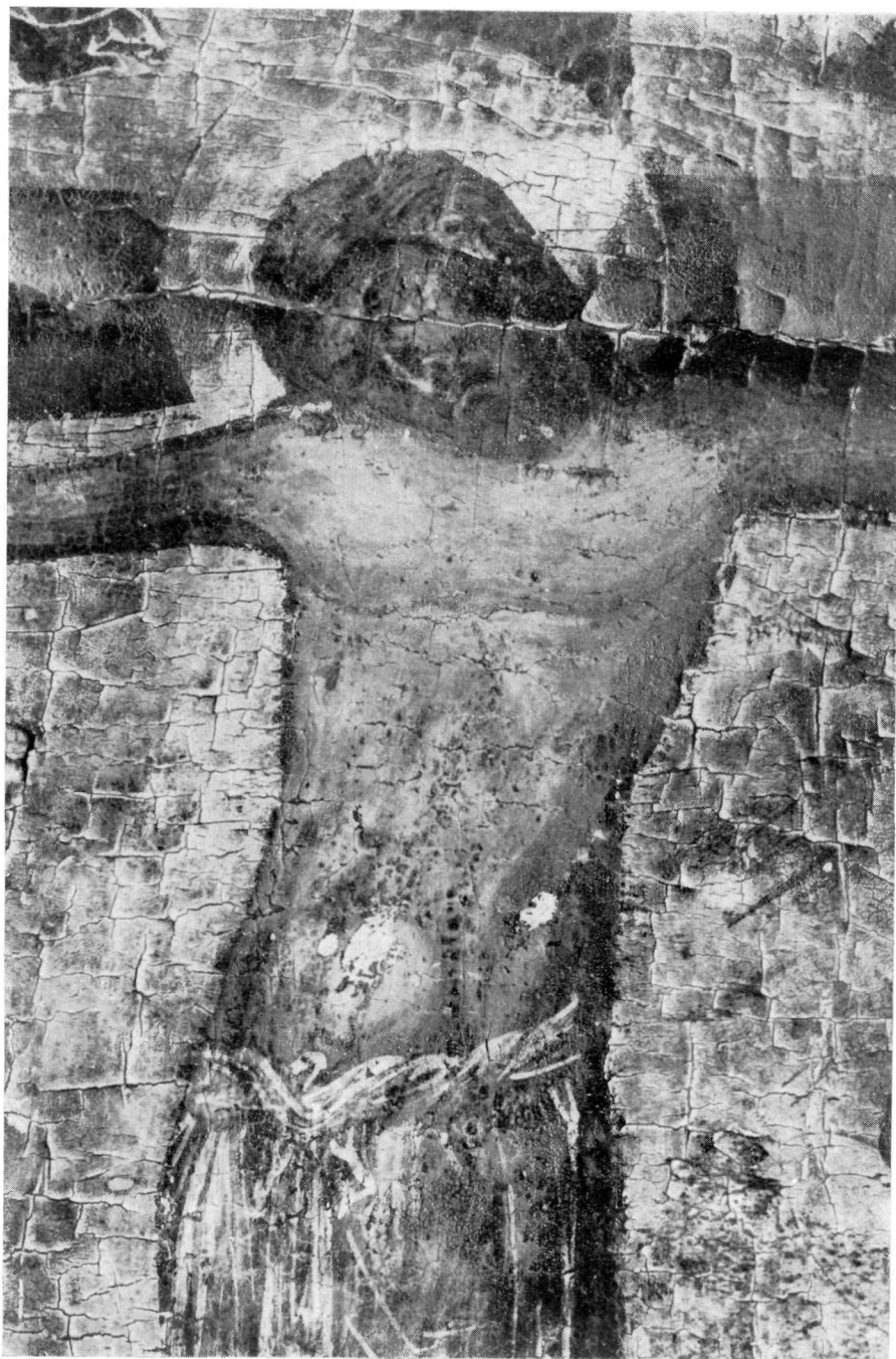
ΜΟΝΗ ΒΑΤΟΠΕΔΙΟΥ Λεπτομέρεια τοῦ πίν. 82.