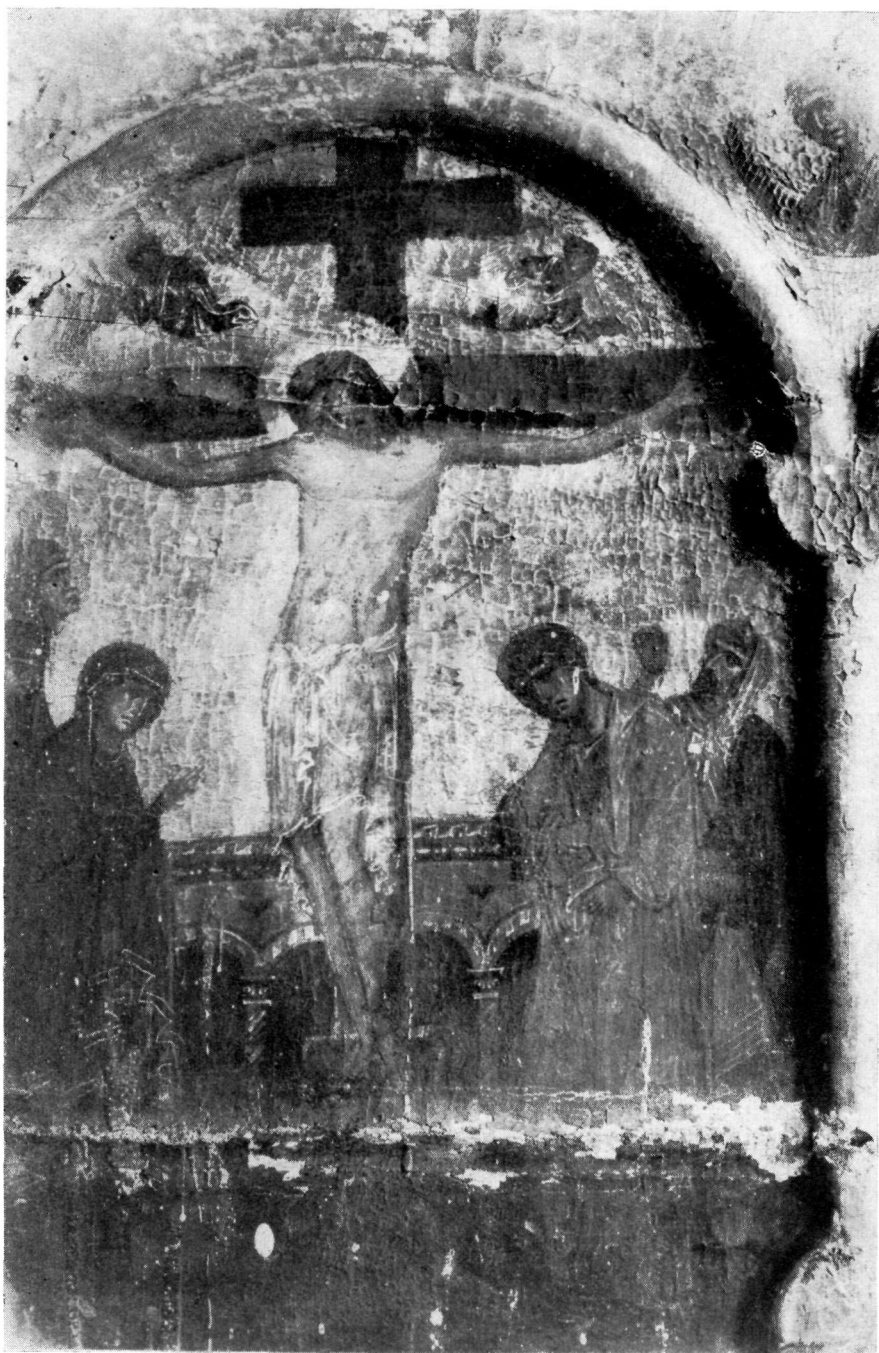
ΜΟΝΗ ΒΑΤΟΠΕΔΙΟΥ Σταύρωση. Λεπτομέρεια τοῦ πίν. 79.