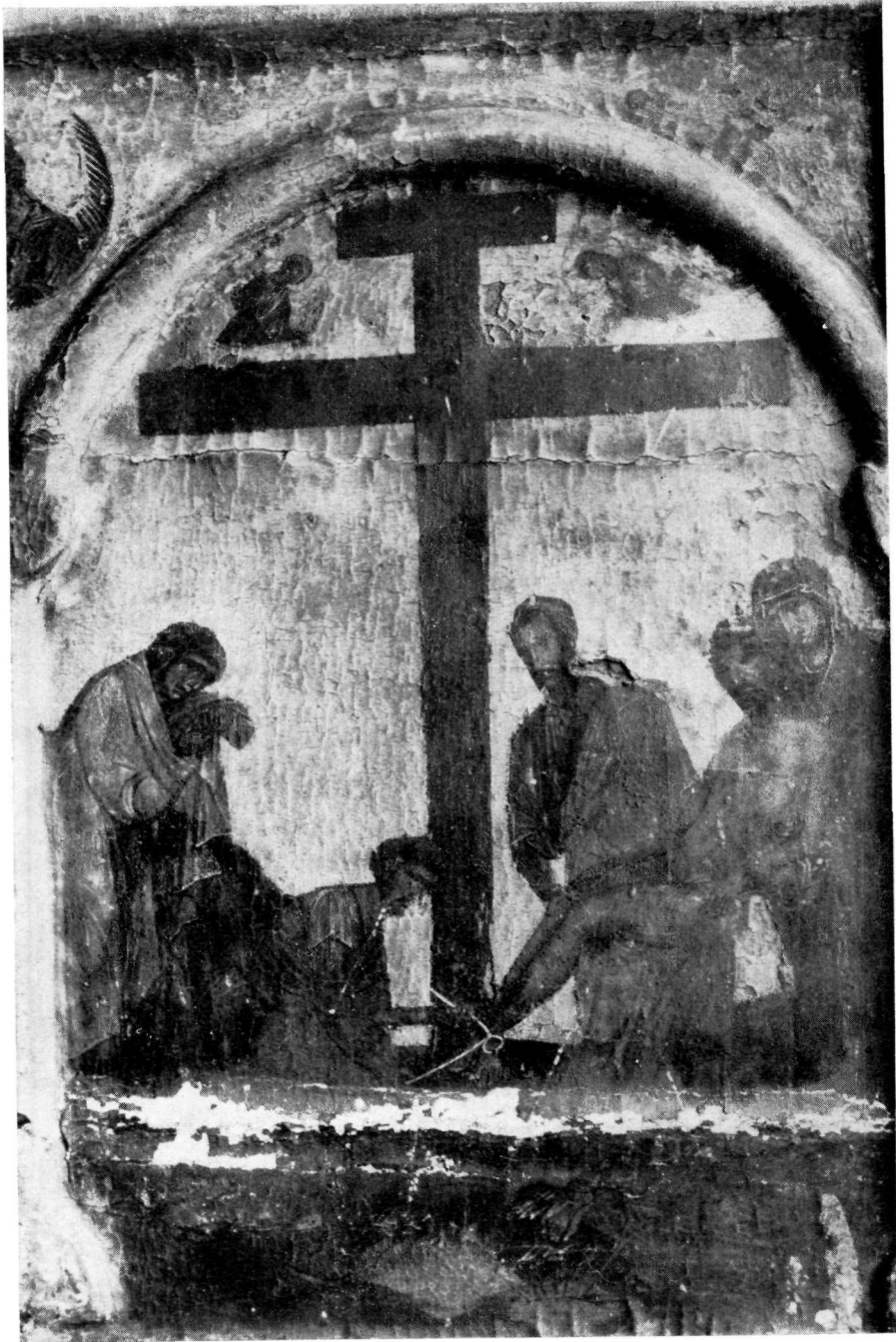
ΜΟΝΗ ΒΑΤΟΠΕΔΙΟΥ Ἀποκαθήλωσις. Λεπτομέρεια τοῦ πίν. 79.