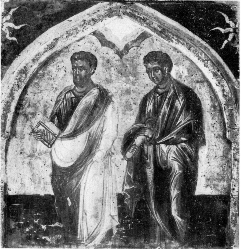
ΜΟΥΣΕΙΟ ΜΠΕΝΑΚΗ Ἀποστολικὰ (τμήμα).