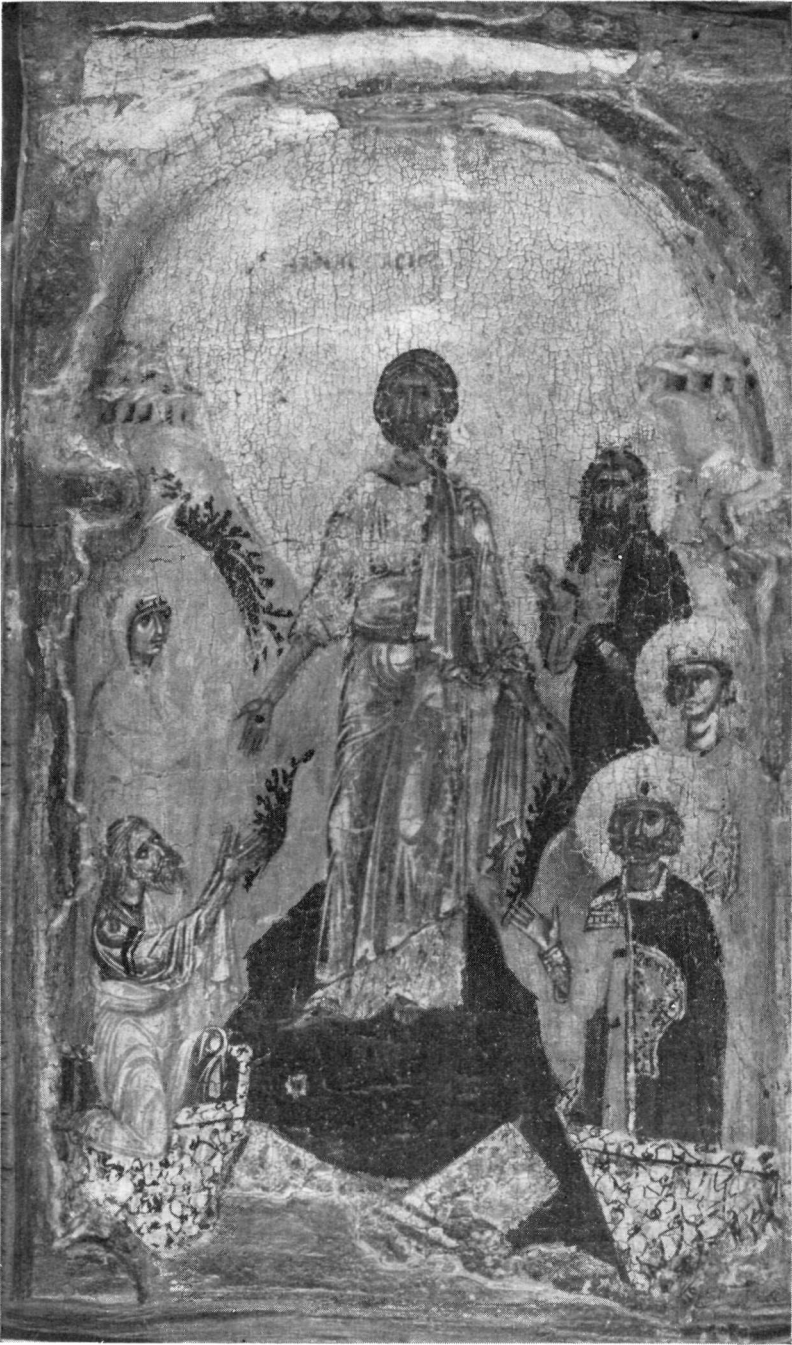
ERMITAGE Εἰς Ἄδου Κάθοδος.