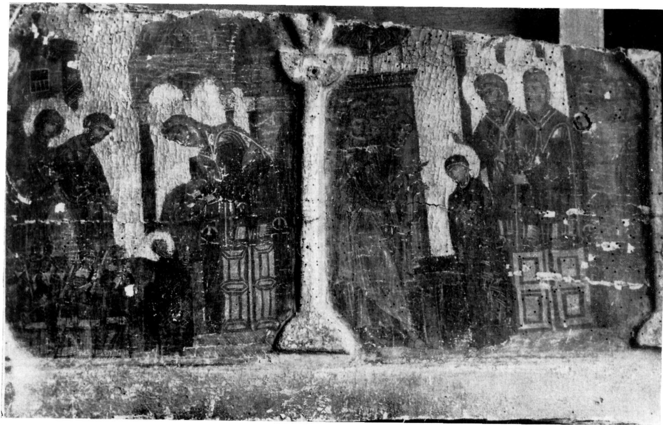
ΜΟΝΗ ΒΑΤΟΠΕΔΙΟΥ Εικόνα ἐπιστυλίου. Πρώτο τμήμα.