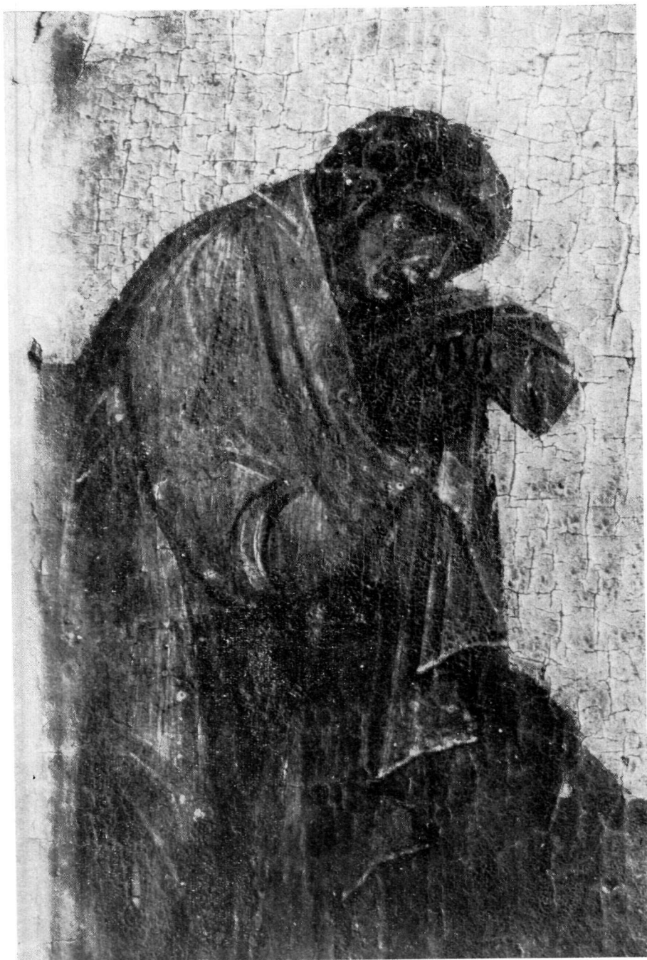
ΜΟΝΗ ΒΑΤΟΠΕΔΙΟΥ Λεπτομέρεια τοῦ πίν. 83.