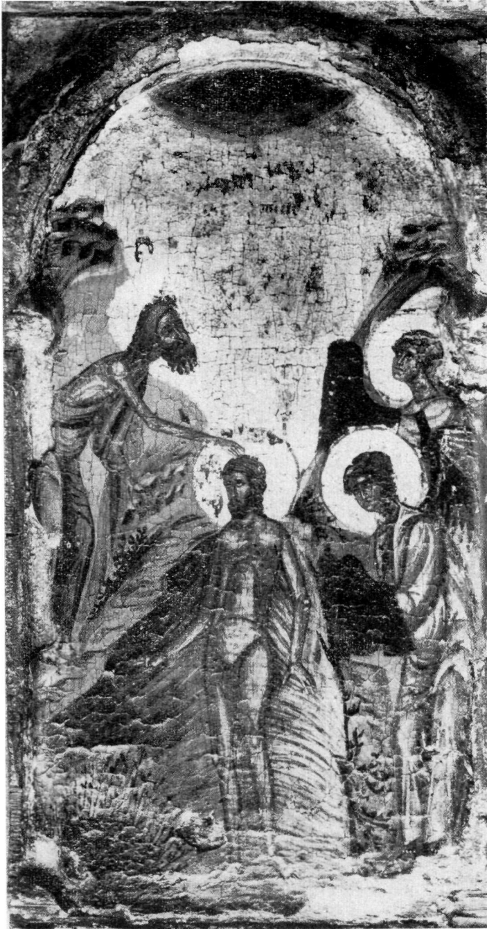
ΜΟΝΗ ΛΑΥΡΑΣ Βάπτισις.