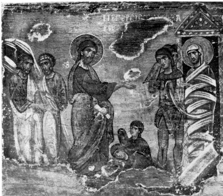
ΙΔΙΩΤΙΚΗ ΣΥΛΛΟΓΗ α. Ἐγερσις τοῦ Λαζάρου.