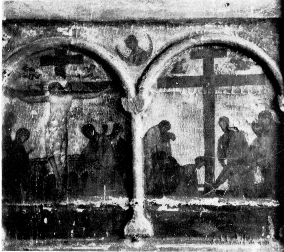
ΜΟΝΗ ΒΑΤΟΠΕΔΙΟΥ Εικόνα ἐπιστυλίου. Τελευταῖο τμήμα.