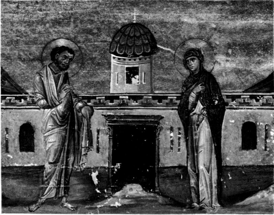
α. Μικρογραφία. Βιβλιοθήκη Βατικανού (Vat. gr. 1613).