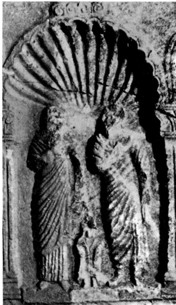
γ. Στήλη ἀπὸ πορόλιθο.