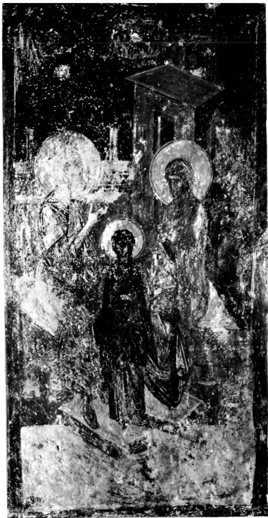
α. Τοιχογραφία. Περιβλεπτος Μυστρά.