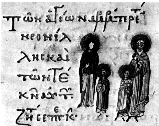
α. Μικρογραφία. Βιβλιοθήκη Βατικανού (Vat. gr. 1156).