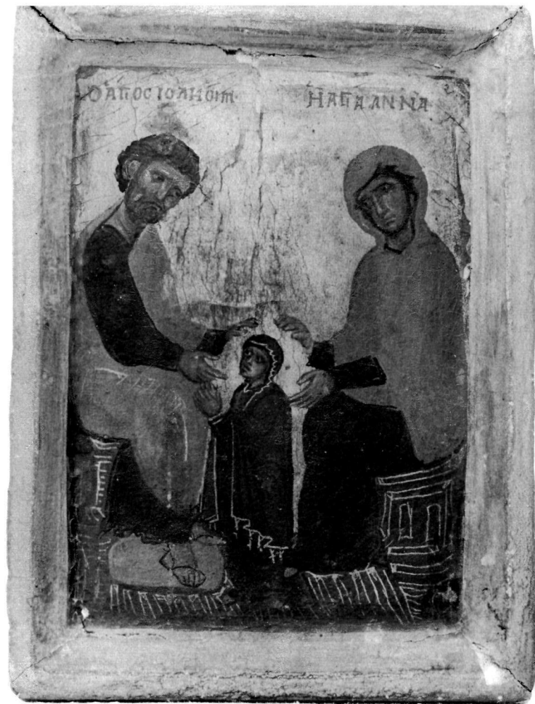
α. Εικόνα. Μονή Σινᾶ.