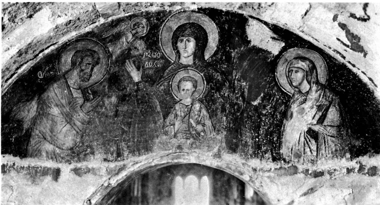
Τοιχογραφία. Ἄφεντικό Μυστρά.