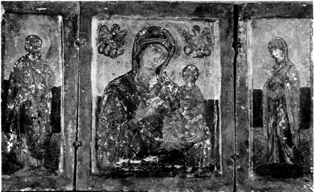
β. Εικόνα. Μονή Σινᾶ.