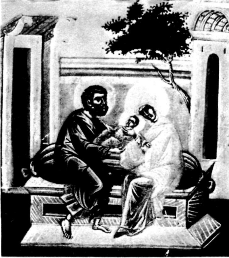
α. Εικόνα. Λεπτομέρεια. Βυζαντινό Μουσείο.