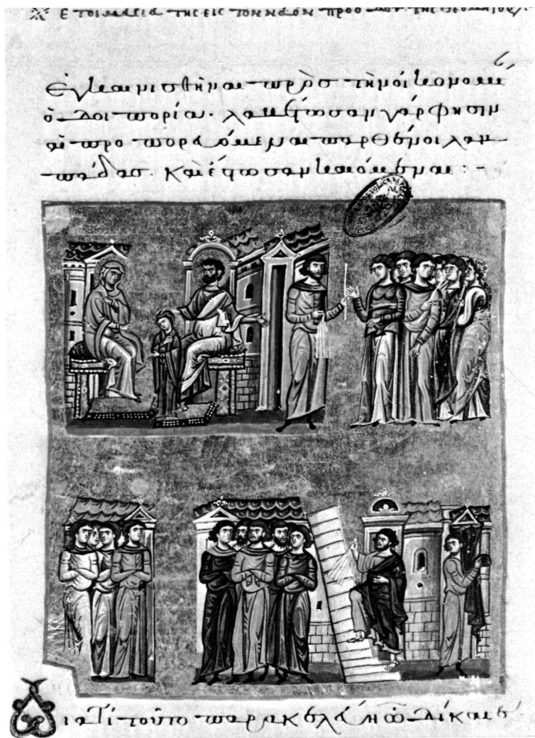
β. Μικρογραφία. Βιβλιοθήκη Βατικανού (Vat. gr. 1162).