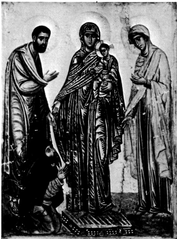
α. Εικόνα. Μονή Σινά.