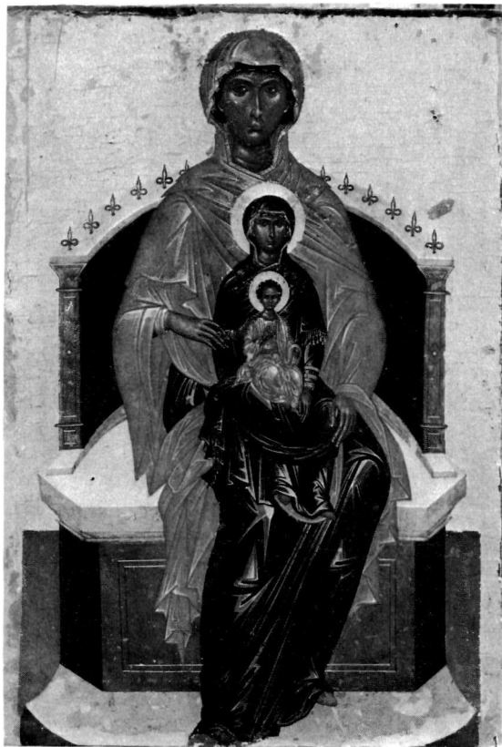
α. Εικόνα. Μουσείο Ζακύνθου.