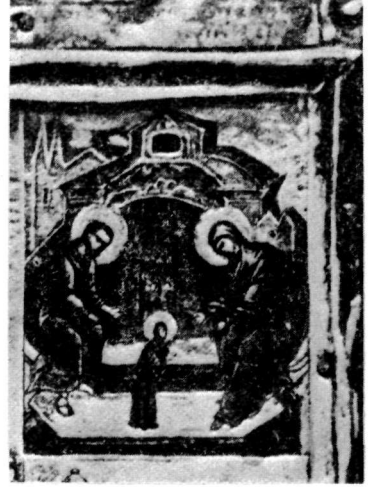
β. Εικόνα. Λεπτομέρεια. Μουσείο του Ermitage.