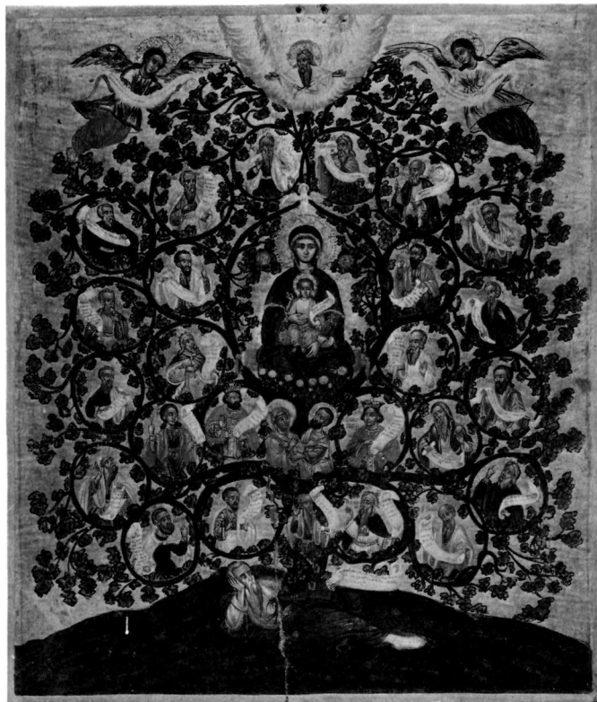
β. Εικόνα. Μονή Σινᾶ.