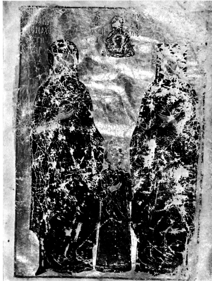
β. Μικρογραφία. Bodleian Library 'Οξφόρδης (gr. 35).