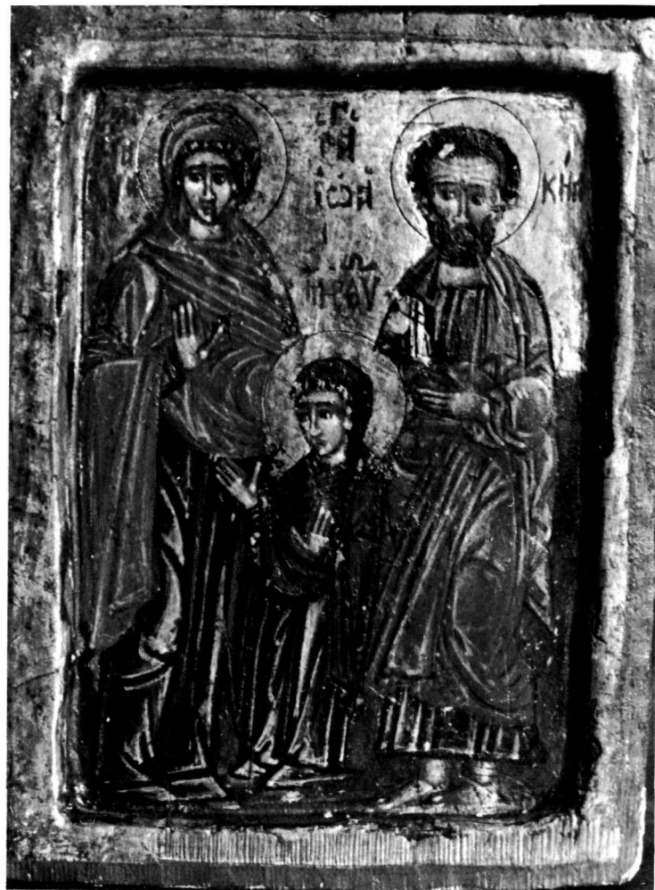
β. Εικόνα. Βυζαντινὸ Μουσεῖο.