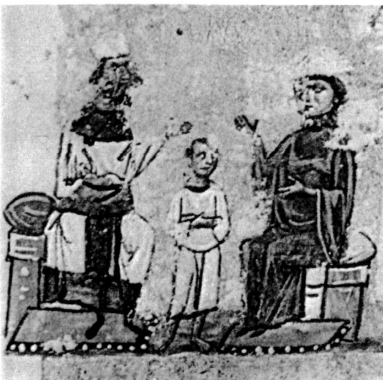
β. Μικρογραφία. Βιβλιοθήκη Βατικανού (Vat. gr. 1927).