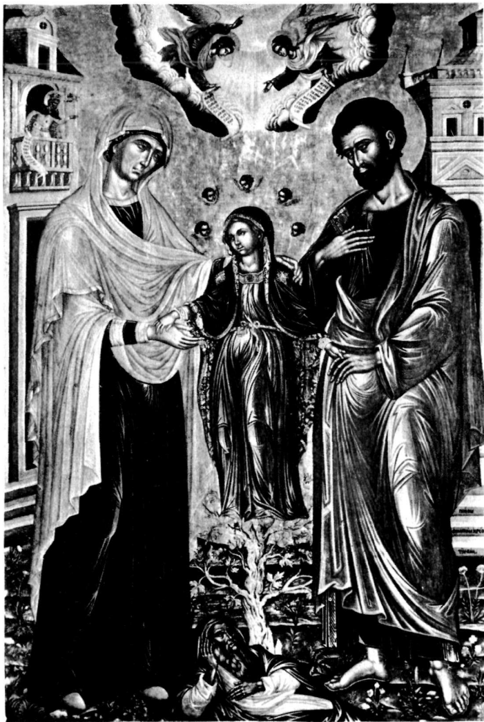
α. Τοιχογραφία. Ναός Μονής Φανερωμένης Σαλαμίνας.