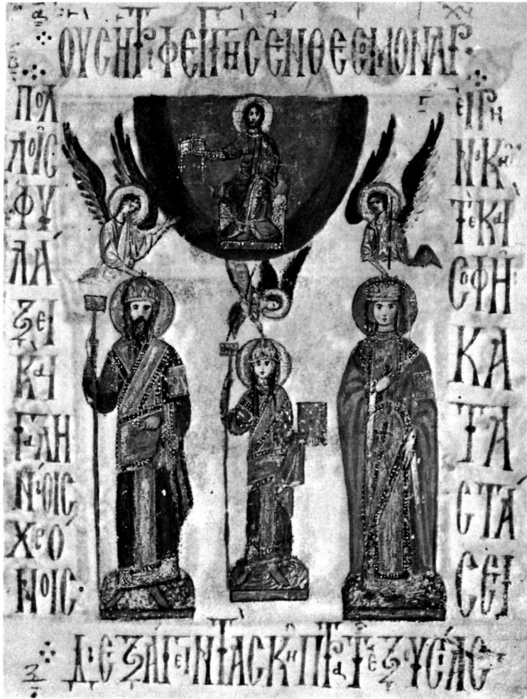
α. Μικρογραφία. Βιβλιοθήκη Βατικανού (Barb. gr. 372).