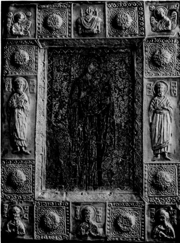
γ. Εικόνα. Μονή Βατοπεδίου Ἄθω.