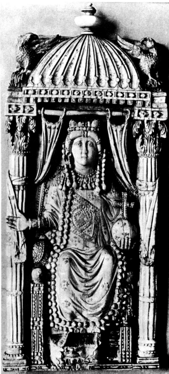
β. Αυτοκράτειρα ἐπί πλακός ἐξ ἑλεφαντοστοῦ εἰς τὸ Kunsthistorisches Museum Βιέννης.