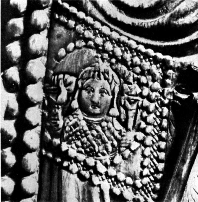
α. Ὁ ἐπὶ τοῦ ταβλίου τῆς ἐπὶ τοῦ πίν. 70α αὐτοκρατείας εἰκονιζόμενος αὐτοκράτωρ ὕπατος.