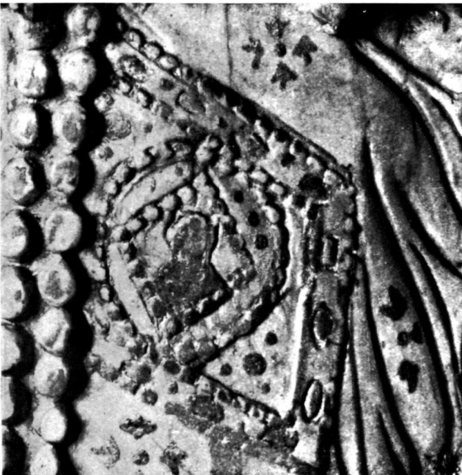
β. Ἡ ἐπὶ τοῦ ταβλίου τῆς ἐπὶ τοῦ πίν. 70β αὐτοκρατείας ἀπεικόνισις πόλεως.