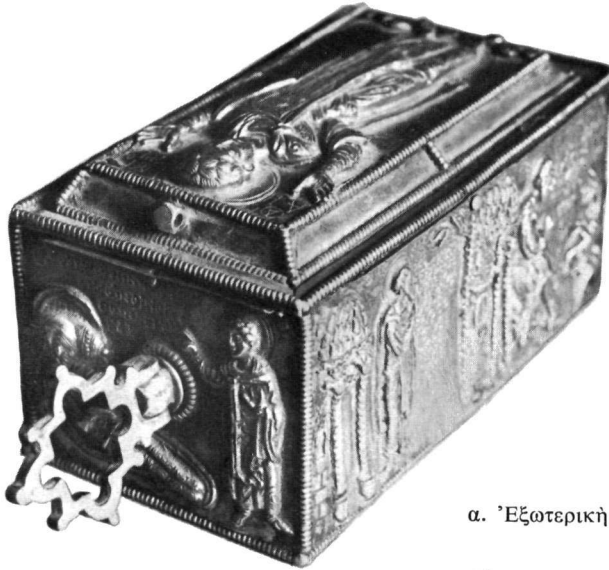
α. Ἐξωτερικὴ ἄποσις.