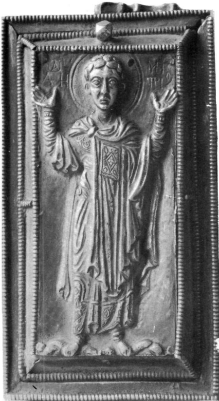
β. Τὸ ἄνω κάλυμμα.