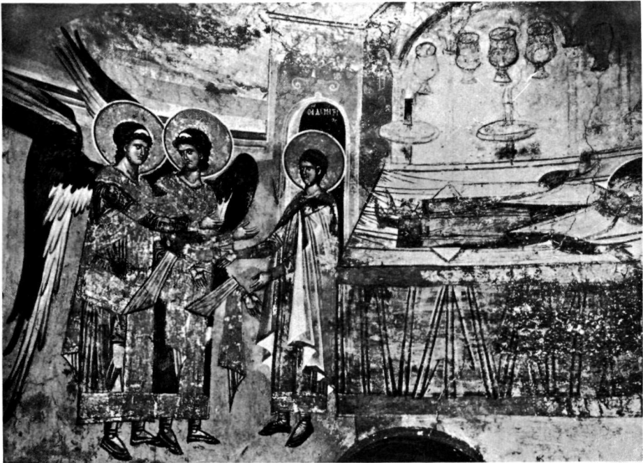
α. Τὸ ὄραμα τοῦ Ἰλλουστρίου.