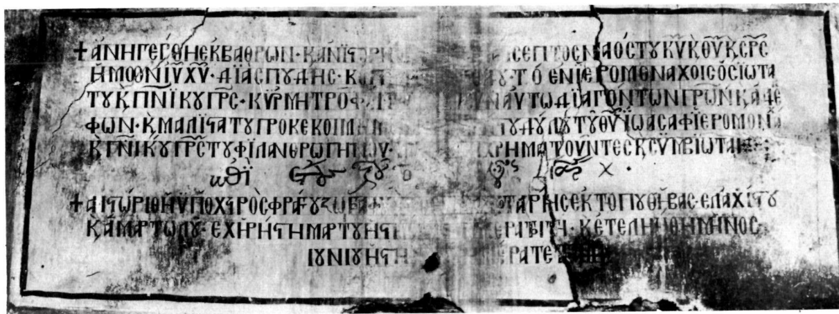
α. Βελτσίστα. (Κληματιά). Ν. Μεταμορφώσεως. Κτητορική επιγραφή.