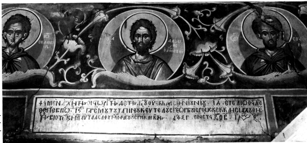
β. Κράψη. Ν. Ἁγ. Νικο- λάου. Κτητορική ἐπιγρα- φή με στηθάρια ἁγίων.