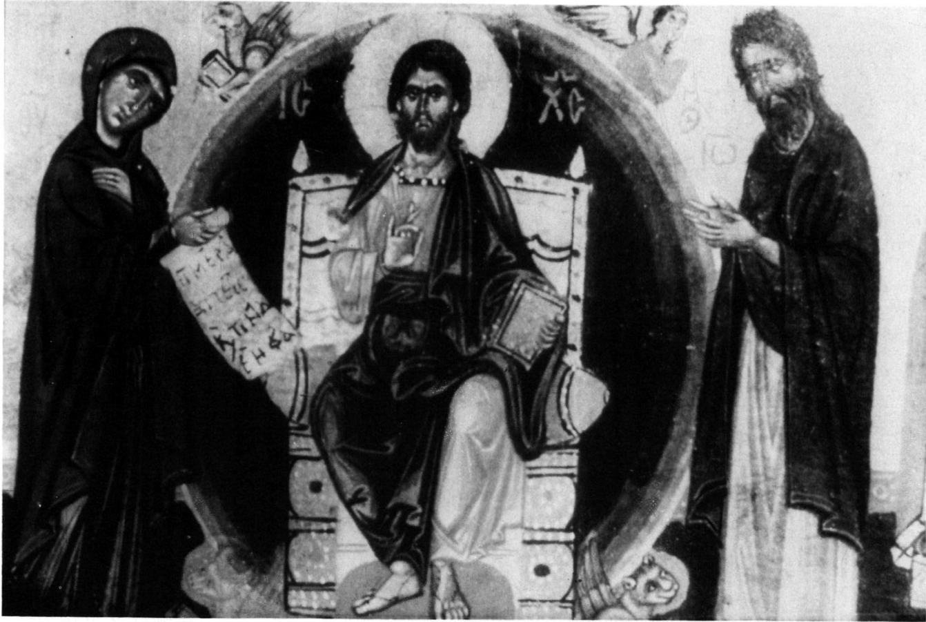
Εικόνα τοῦ Σινᾶ. Ἡ Δέησις (λεπτομέρεια).