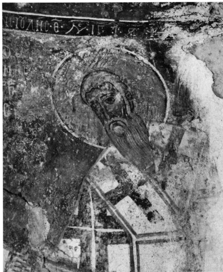
Ἄμαρι Ρεθύμνου. Ναὸς Ἁγίας Ἄννας. 1. Δεξιὸ τμήμα ἀψίδας Ἱεροῦ. Μορφή ἀγγέλου διακόνου καὶ ἁγίου Ἀνδρέα ἀπὸ τὴν παράσταση τῆς Θείας Λειτουργίας. 2. Λεπτομέρεια τῆς εἰκ. 1.