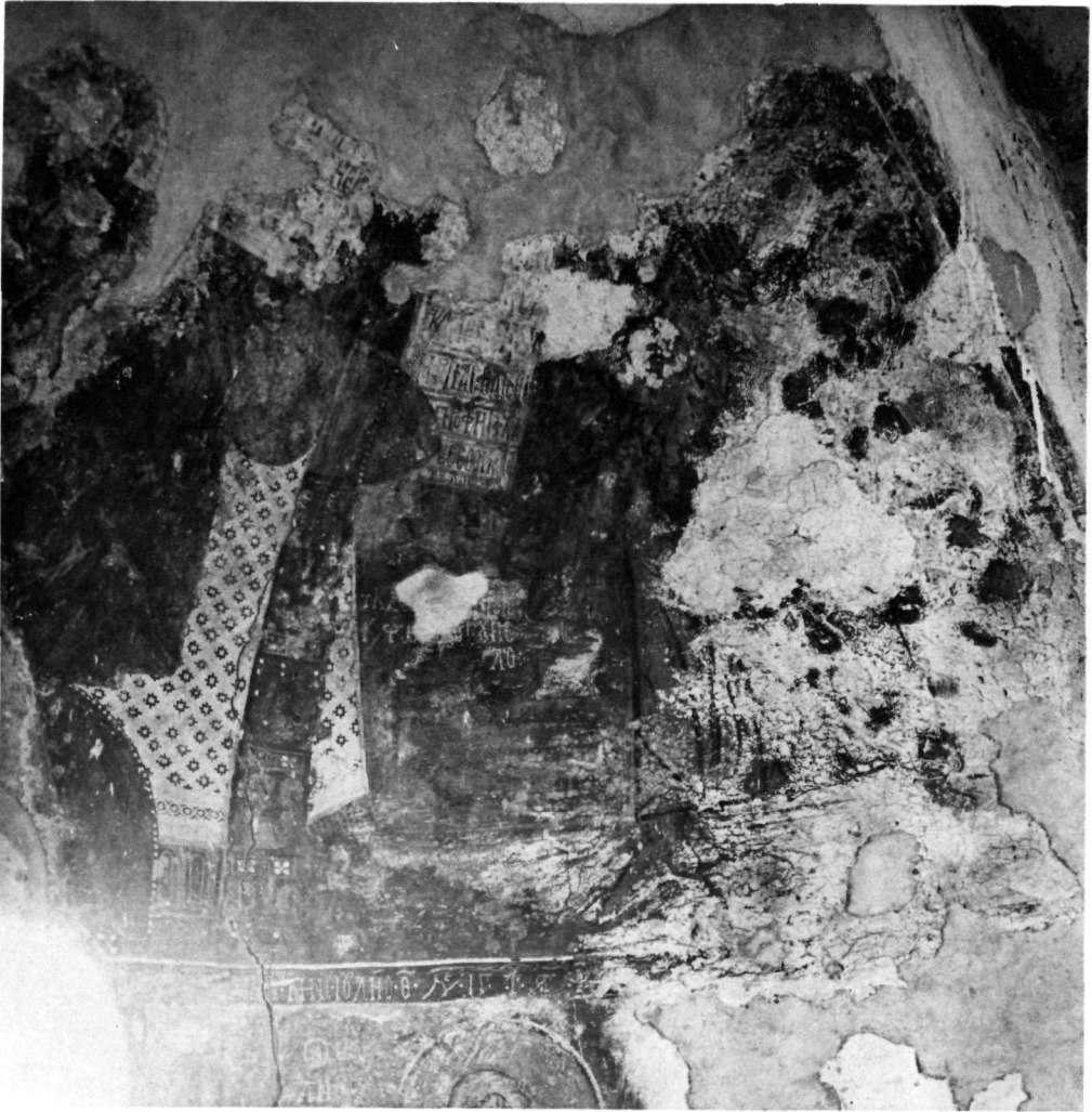
Ἄμαρι Ρεθύμνου. Ναός Ἁγίας Ἄννας. Τμήμα ἀπὸ τὴν παράσταση τῆς Δεήσεως στὴν κόγχη τοῦ Ἱεροῦ.