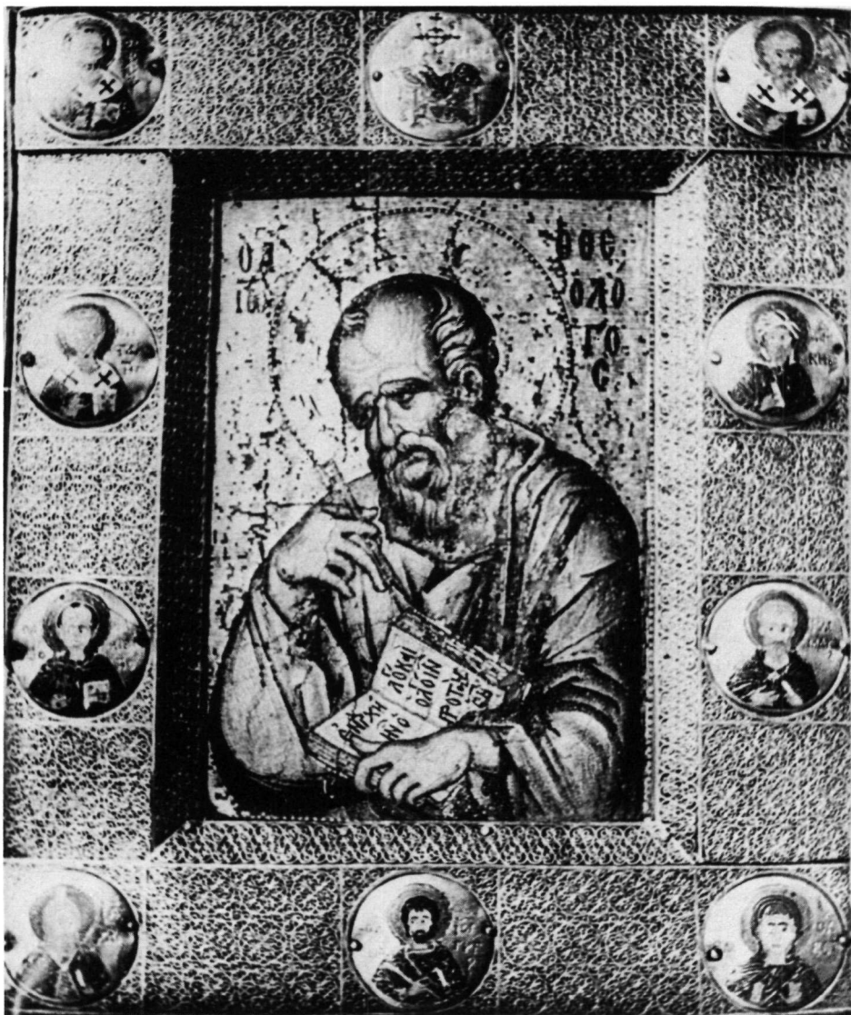
Athos, Monastère de Lavra. Icône en mosaïque de saint Jean le Théologien. (Photo Ph. Zachariou).