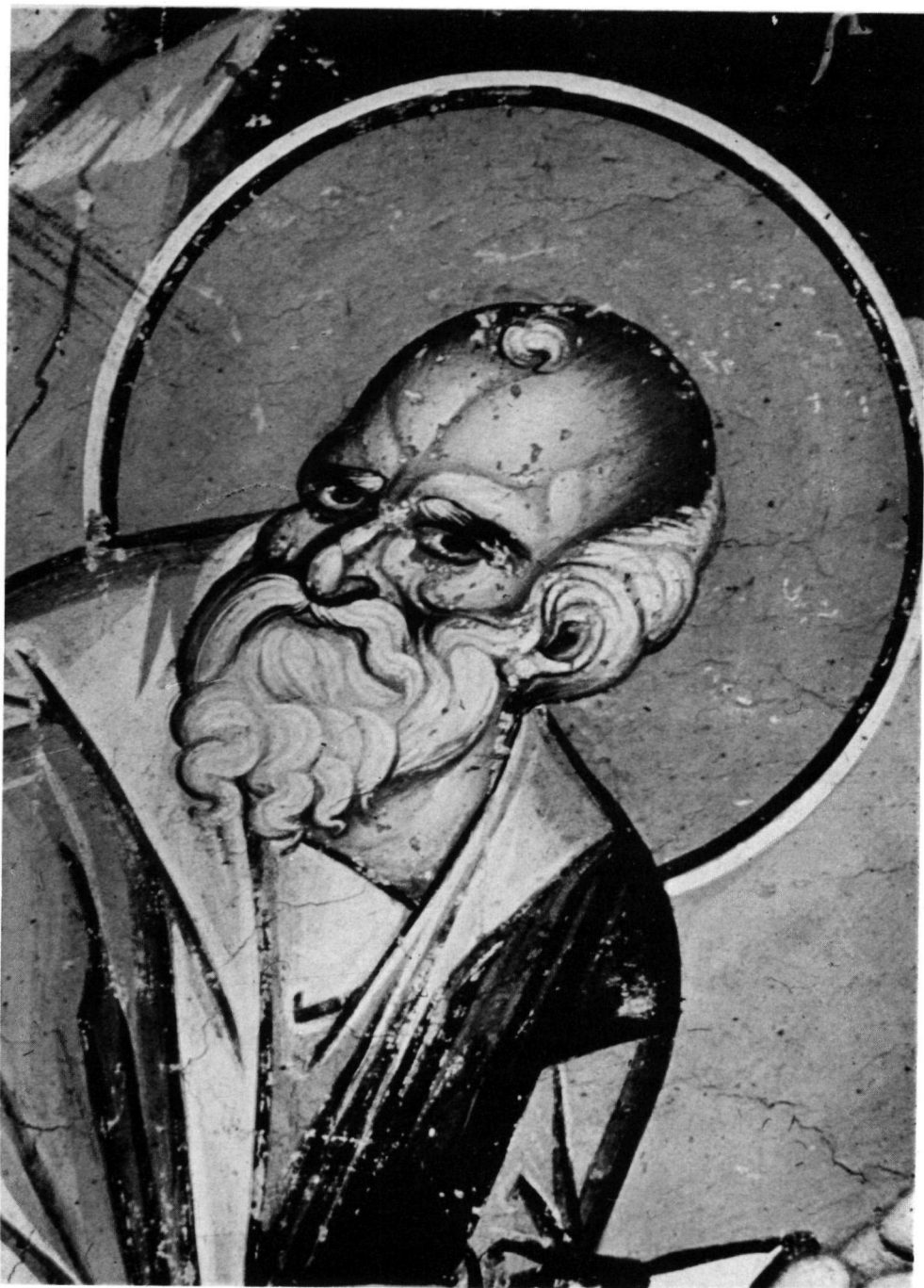
Détail de la pl. 13.