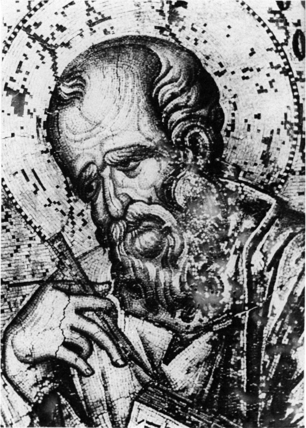
Détail de l'icone pl. 11.