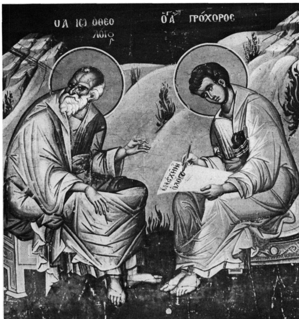
Athos, Protaton. Saint Jean le Théologien dictant à Prochoros. Peinture murale.