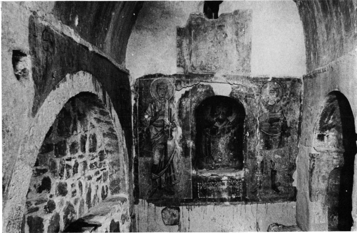
Νάξος, Πρωτόθρονη, τὸ ἀνατολικὸ τμήμα ΒΔ παρεκκλησίου. Ἀριστερά, ἡ ἐπιγραφή τοῦ 1056, ἐπάνω ἀπὸ τὸ ἀρκυσόλιο.