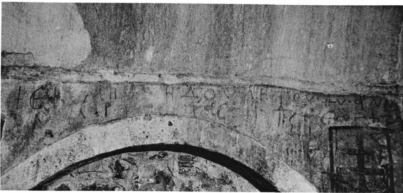
Νάξος, Πρωτόθρονη, ΒΔ παρεκκλήσιο. Ὁ βόρειος τοῖχος μετὰ τὴν ἐπιτάφια ἐπιγραφὴ τοῦ 1056.