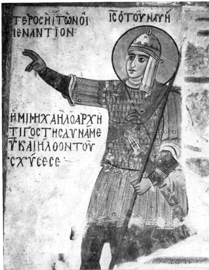
Ἡ τοιχογραφία τοῦ Ἰησοῦ τοῦ Ναυῆ εἰς τὸ Καθολικὸν τῆς Μ. Ὁσίου Λουκά.

Ἡ παλαιοχριστιανικὴ αὐτὴ μορφή ἐπιζῆ οὕτω καὶ κατὰ τοὺς μετὰ τὴν Εἰκονομαχίαν χρόνους, ἀλλ' ἀρκετὰ τροποποιημένη ὡς πρὸς τὸ καταυχέ- σιον ἰδίως, τὸ ὁποῖον δὲν εἶναι πλέον μεταλλικὸν καὶ συμφυῆς μὲ τὸ κρά-