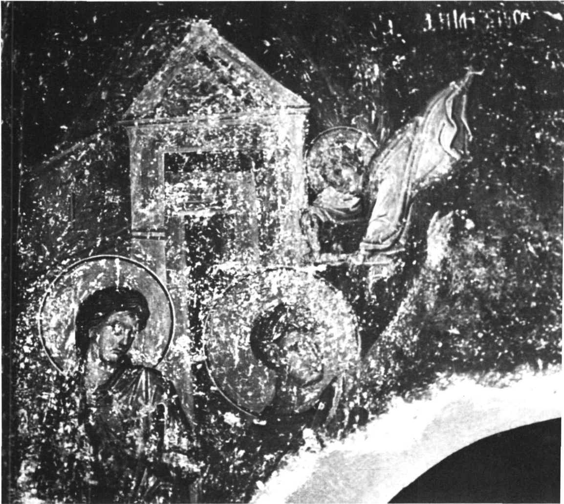
Τὸ ἄριστερὸν μέρος τῆς συνθέσεως.