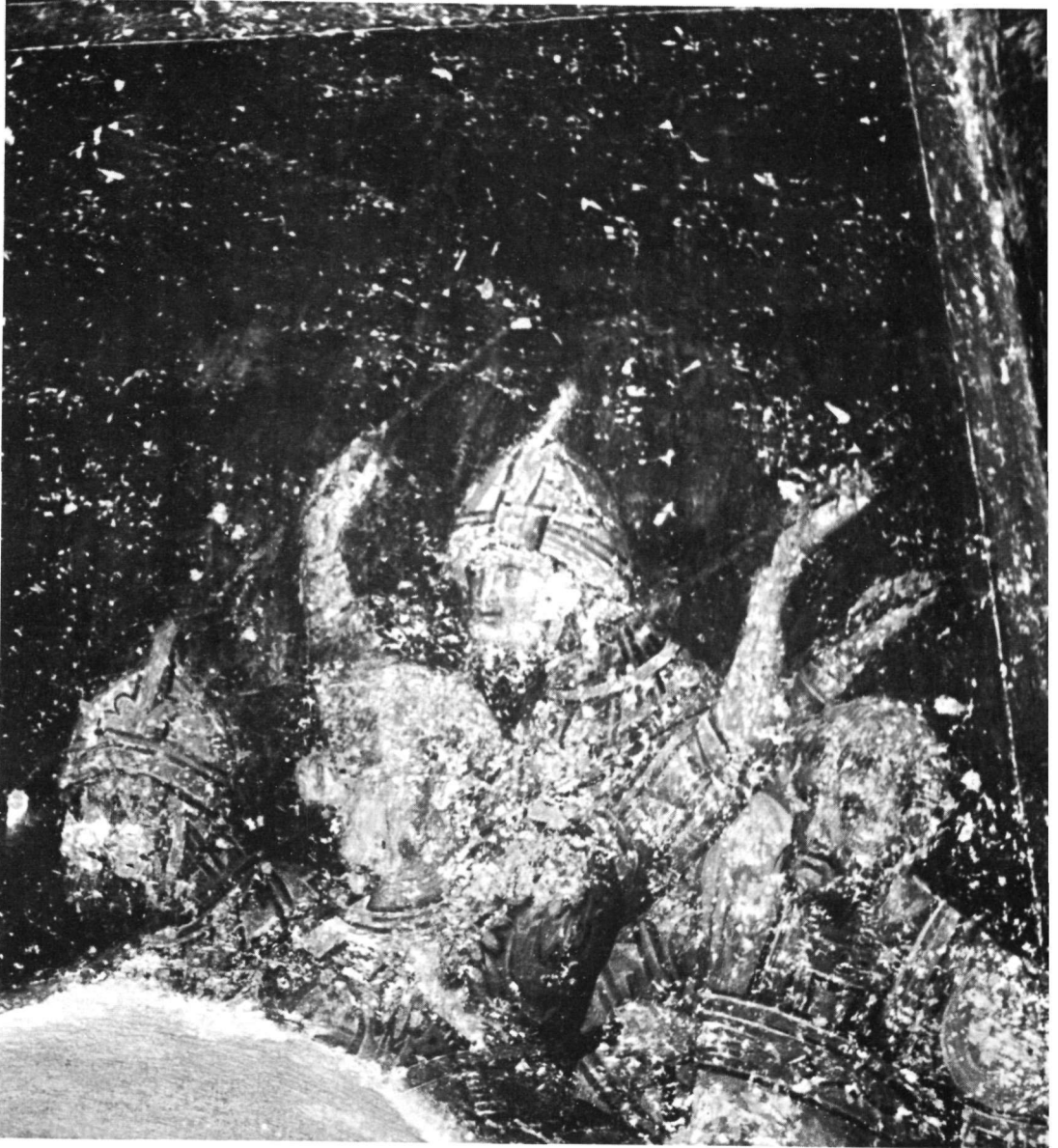
Τὸ δεξιὸν μέρος τῆς συνθέσεως.