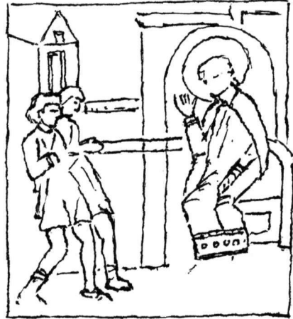
Εἰκ. 2. Ὁξφόρδη. Βιβλ. Bodleian. Κώδ. Gr. Th. F. 1.

Καὶ θὰ ἠδύνατο ἴσως νὰ ὑποτεθεῖ ὅτι ἡ τελειοποίησις τῆς συνθέσεως