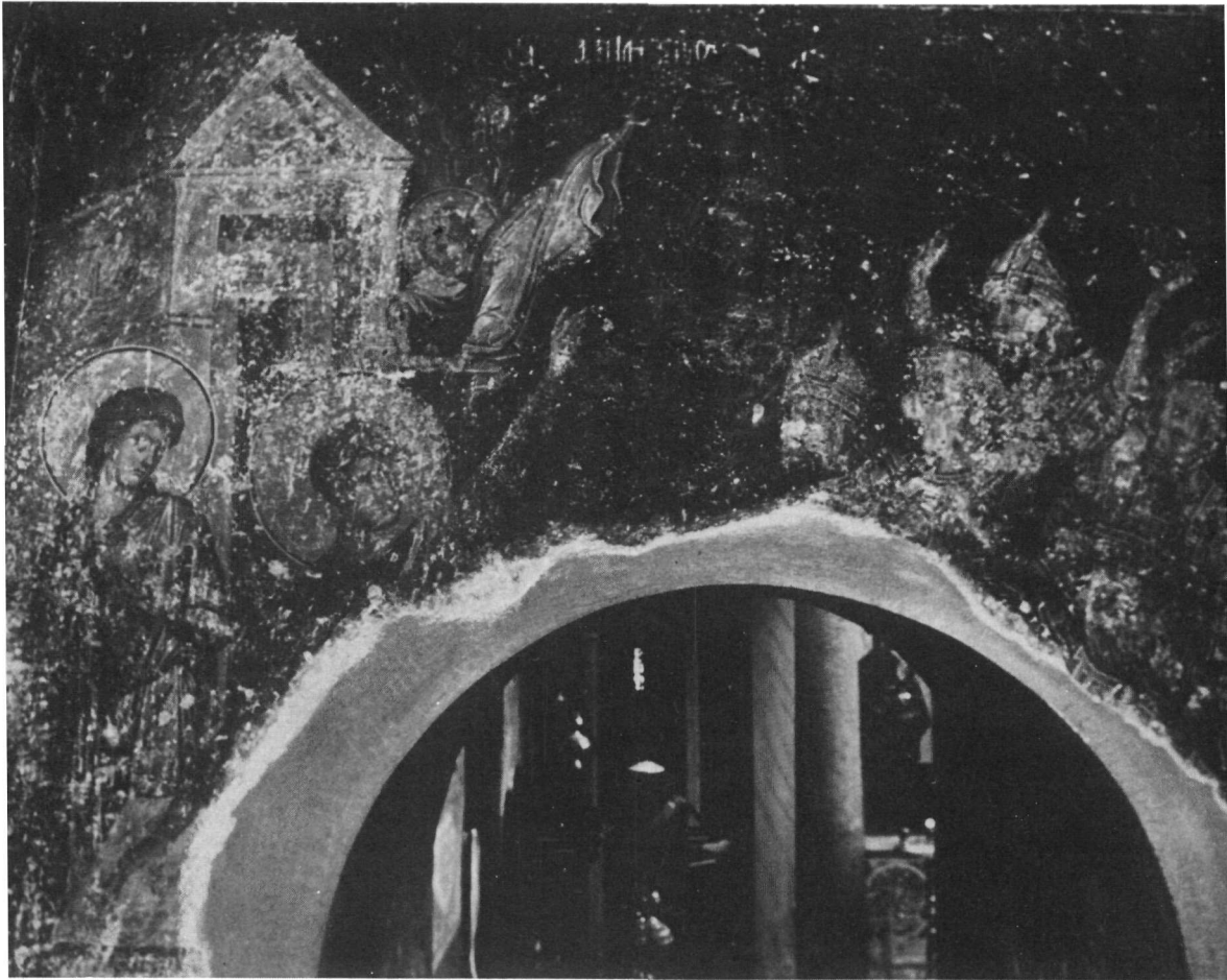
Θεσσαλονίκη. Ναός Ἁγίων Ἀποστόλων. Ἡ τοιχογραφία μετὰ τὸν καθαρισμόν.