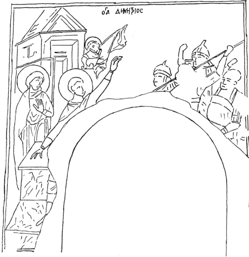
Εἰκ. 1. Ἡ κατάσταση τῆς τοιχογραφίας περὶ τὸ 1927.

πρὸς τὰ ἄνω. Ὅπισθεν αὐτοῦ ἴσταται ὄρθιος ὁ ὑπηρέτης τοῦ Λοῦπος στρέφων καὶ αὐτὸς τὴν κεφαλὴν πρὸς δεξιὰ καὶ κάμπτων τὴν ἀριστεράν του χεῖρα πρὸ τοῦ στήθους μὲ τὴν παλάμην πρὸς τὰ ἔξω. Ὑπεράνω τοῦ Ἀ-