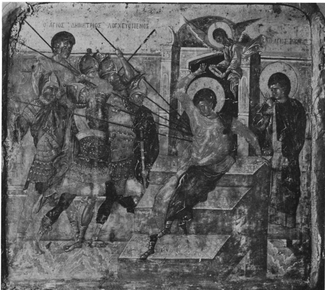
Ἅγ. Ὁρος. Μονὴ Λαύρας. Εἰκὼν (φωτογρ. Μ. Χατζηδάκη).