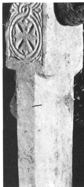
Ναός Ἁγίου Ἰωάννου τοῦ Θεολόγου Γαρδενίτσας. α - β. Κομμάτια κοσμήτη. γ. Ἀπότμημα πεσίσκου με σύμφυτο κιονίσκο.