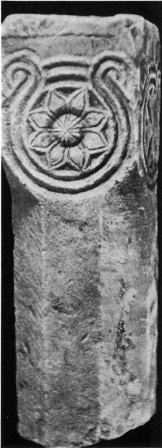
Ναός Ἁγίου Φιλίππου τῆς Κουνιώτικης Πούλας. α. Τμήμα στέψεως. β. Δυὸ πλευρὲς κιονίσκου.