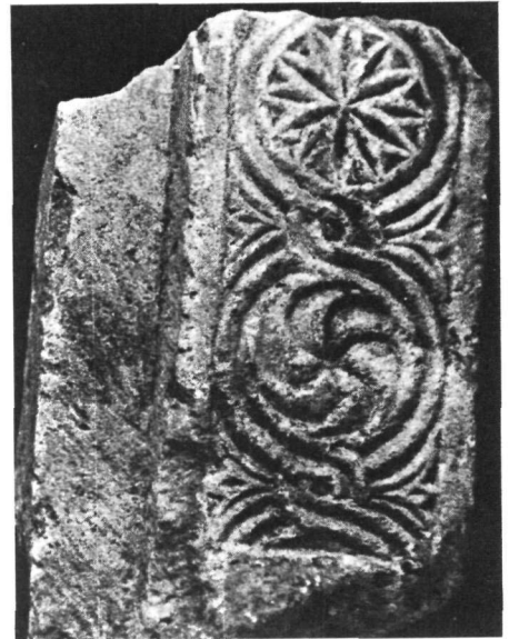
Ναός Ἁγίου Φιλίππου τῆς Κουινιώτικης Πούλας. α. Θωράκιο τέμπλου. β. Τεμάχιο πεσσίσκου.