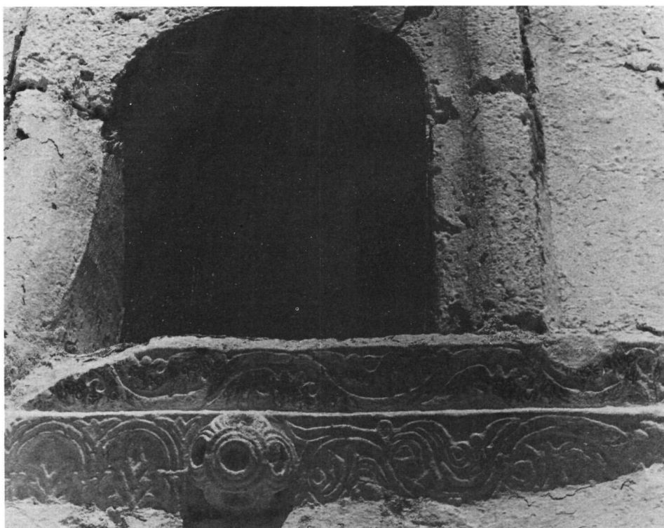
α. Ναός Ἁγίου Νικολάου Καστανέας. Ἐντειχισμένο ἐνεπίγραφο γείσο. β. Ναός Ἁγίας Τριάδας κοντὰ στὸ χωριὸ Λαγκάδα. Ἐντειχισμένος ἐνεπίγραφος κοσμήτης.