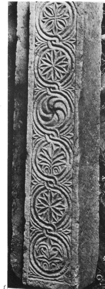
α. Ναός Ἁγίου Ἰωάννου Κούνου. Ἐντειχισμένα θωράκια καὶ πεσσίκος. β. Λεπτομέρεια τῆς προηγούμενης εἰκόνας. γ. Ναός Ἁγίων Θεοδώρων Καφιόνας. Πεσσίκος μετὰ τὸ χάραγμα Μιχαήλ.