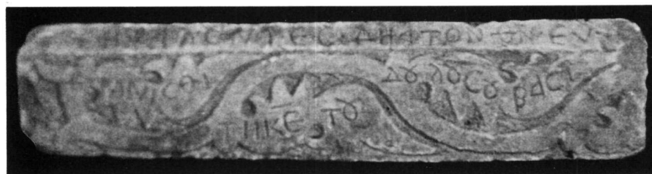
Ναός Ἁγίου Φιλίππου τῆς Κουνιώτικης Πούλας. α - γ. Τμήματα κοσμήτου ἀπὸ τὸ μαρμάρινο τέμπλο. δ. Μέρος ἐπιστέψεως τοῦ κοσμήτη.