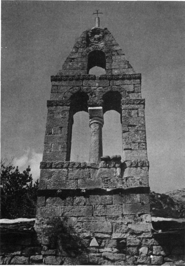
α. Ναός Ἁγίου Ἰωάννου τοῦ Θεολόγου Γαρδενίτσας. Στέψη θωρακίου. β. Ναός Ἁγίου Νικολάου Καστανέας. Τὸ κωδωνοστάσιο.