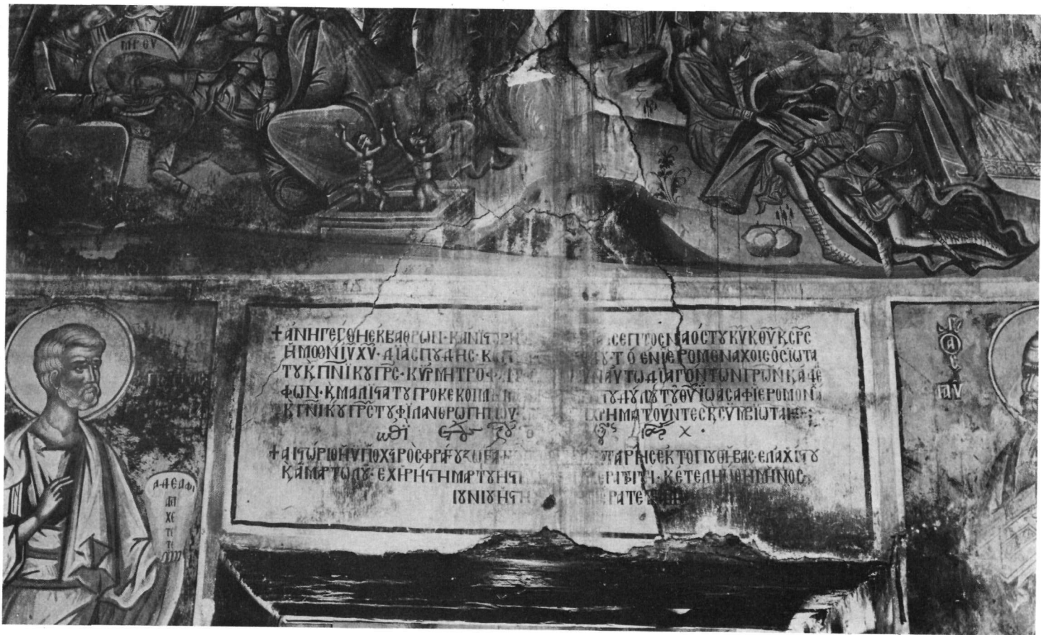
Βελτισία (Κληματιά). Ν. Μεταμορφώσεως. Ἡ κτητορική ἐπιγραφή.