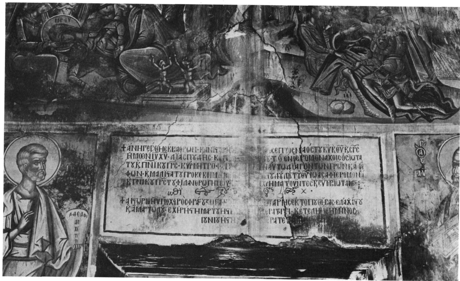
Βελτσιστα (Κληματιά). Ν. Μεταμορφώσεως. Ἡ κτητορική ἐπιγραφή.