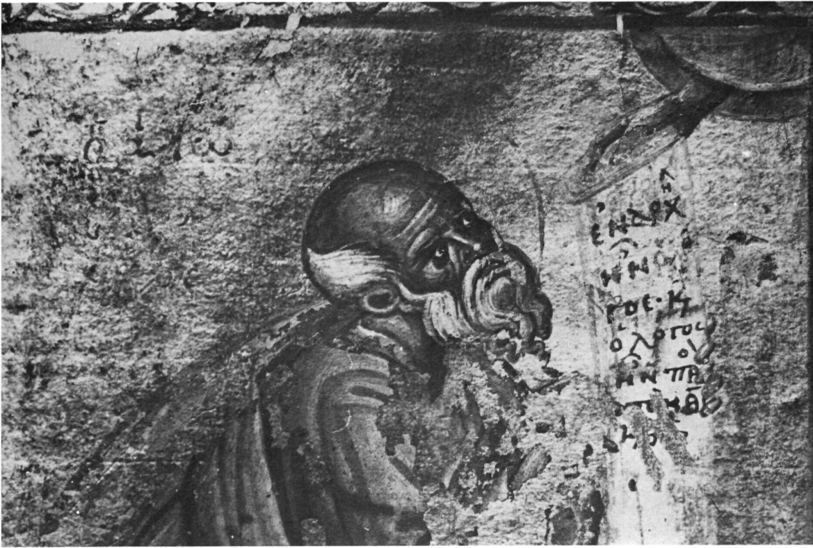
Ὁ Εὐαγγελιστὴς Ἰωάννης. Λεπτομέρεια τοῦ πίν. 54.