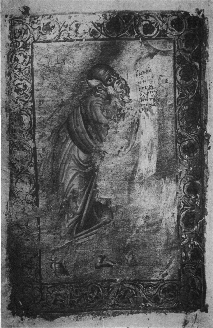
Ἄθος. Μ. Ἰβήρων. Εὐαγγελιστάριον. Ὁ Εὐαγγελιστὴς Ἰωάννης.