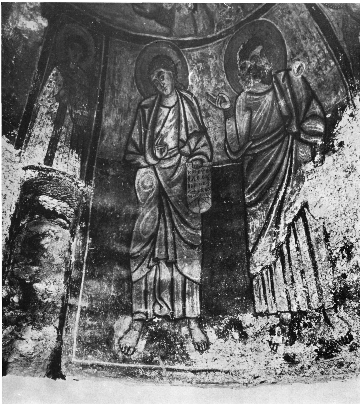
Ταξιάρχης στο Μαρκόπουλο. Ἐπὶ τῇ διακόσμησιν τοῦ τρούλλου. Ὁ Ἅγιος Παντελεήμων καὶ οἱ προφῆτες Μιχαίας καὶ Ἰωήλ.