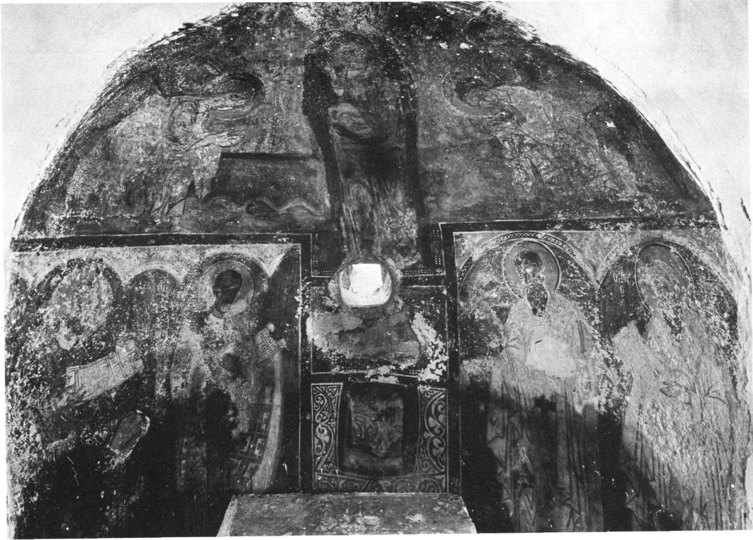
Ταξιάρχης στο Μαρκόπουλο. Οι τοιχογραφίες της κόγχης του ιεροῦ.