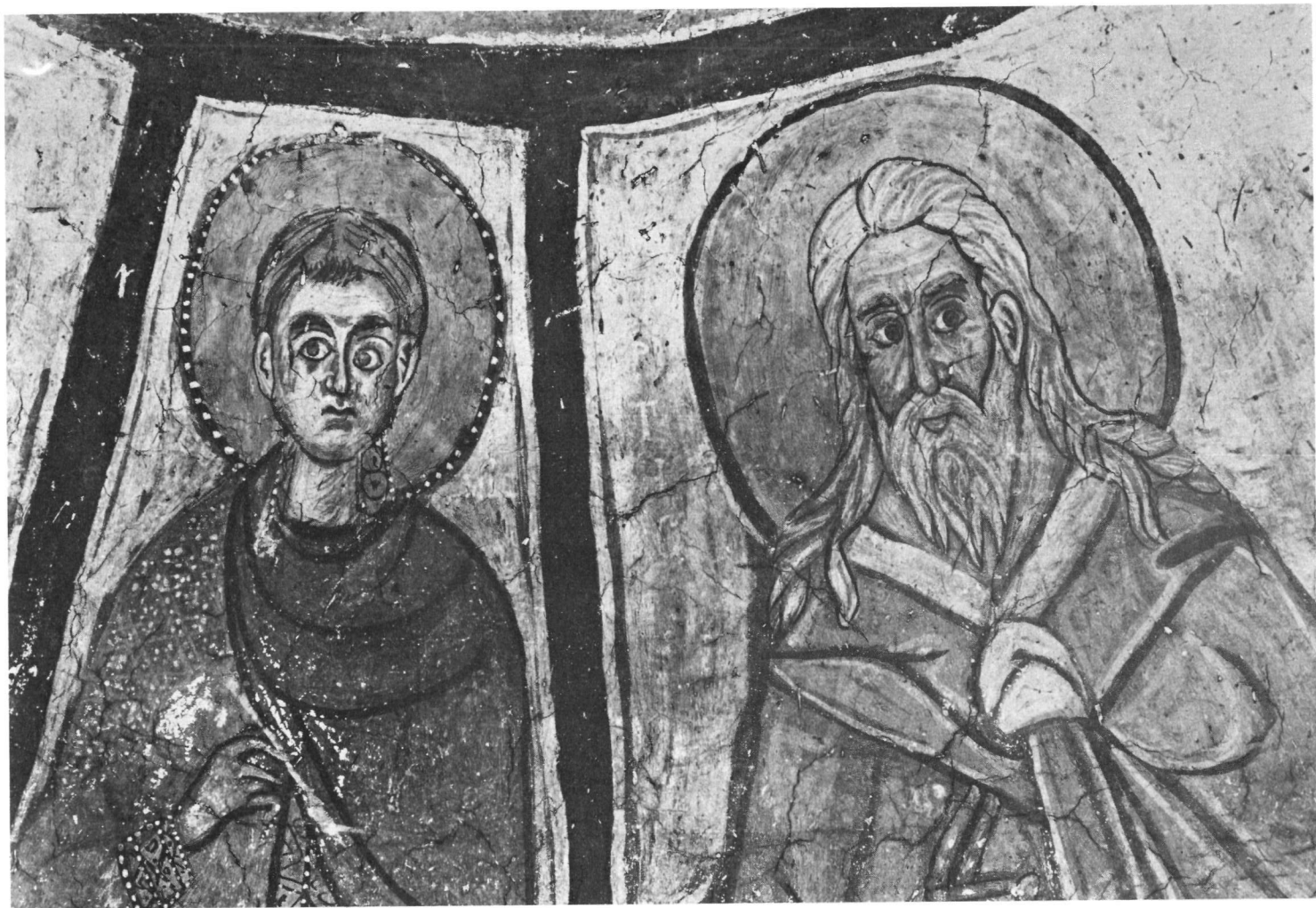
Ταξιάρχης στο Μαρκόπουλο. Ὁ Ἅγιος Κοσμάς καὶ ὁ προφήτης Ἡλίας (λεπτομέρεια).