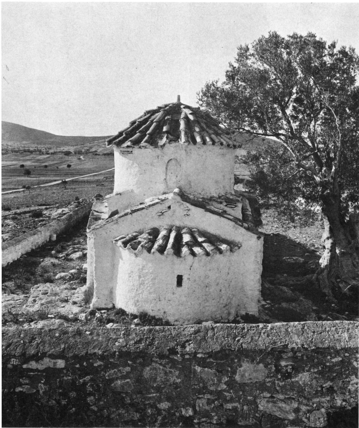
Ταξiάρχης στο Μαρκόπουλο. "Αποψη από ανατολικά.