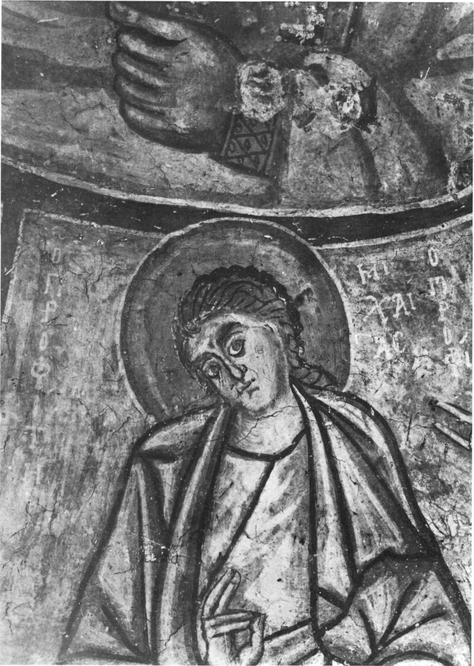
Ταξιάρχης στο Μαρκόπουλο. Ὁ προφήτης Μιχαίας (λεπτομέρεια).