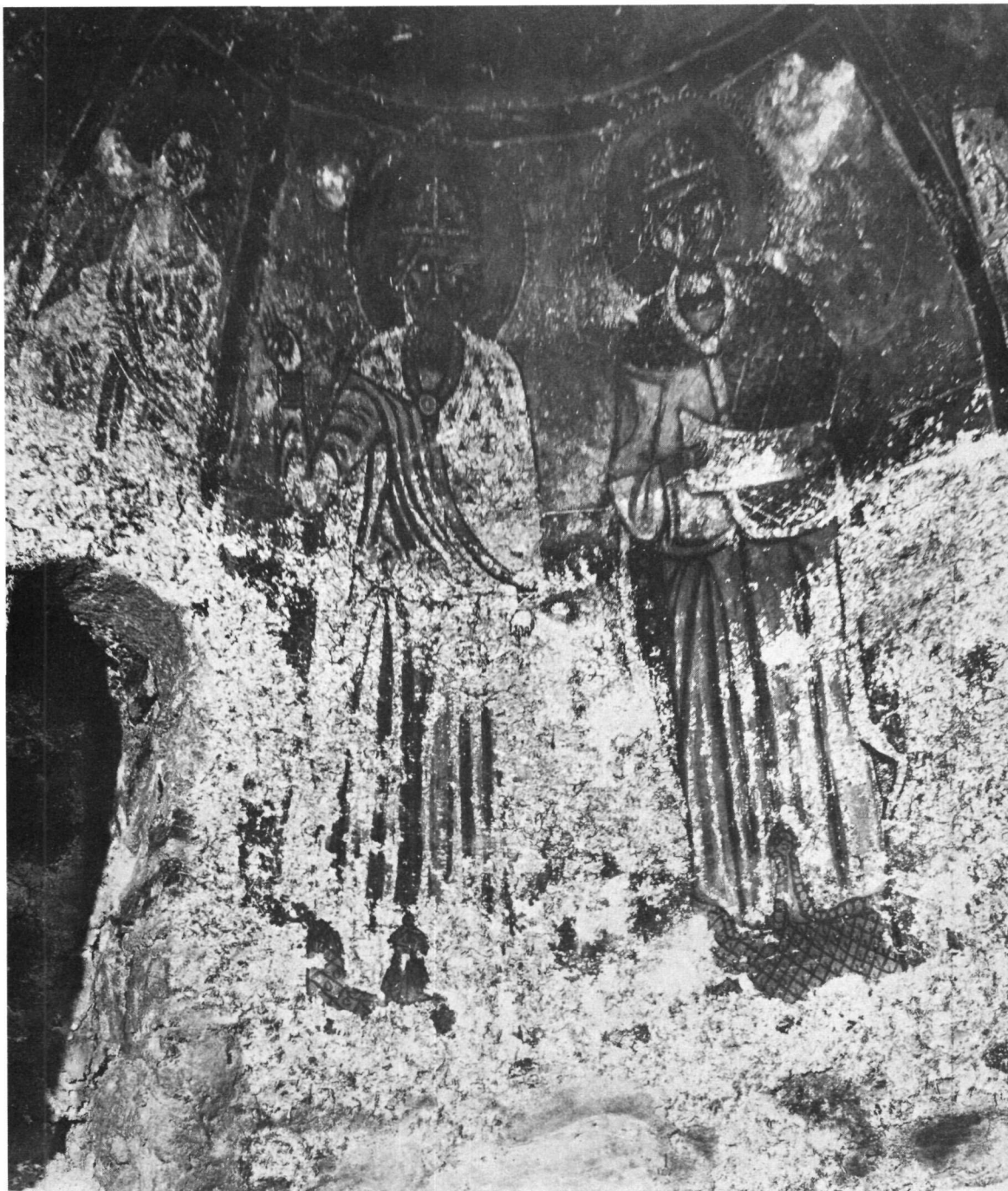
Ταξιάρχης στο Μαρκόπουλο. Ἀπὸ τὴ διακόσμηση τοῦ τρούλλου. Ὁ Ἅγιος Δαμιανὸς καὶ οἱ προφῆτες Σολομὼν καὶ Δαβὶδ.