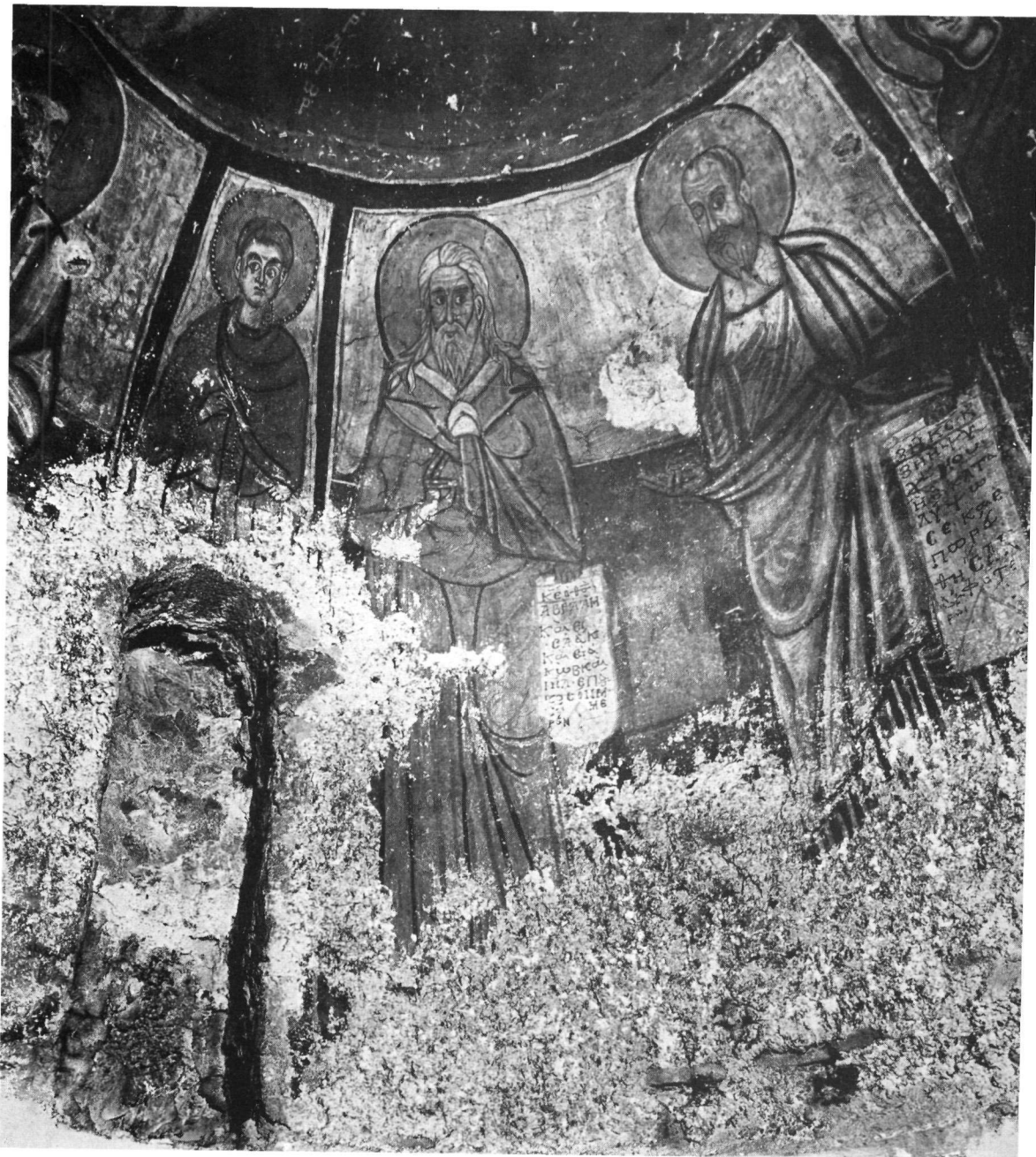
Ταξιάρχης στο Μαρκόπουλο. Ἀπὸ τῆ διακόσμησι τοῦ τρούλλου. Ὁ Ἅγιος Κοσμάς καὶ οἱ προφῆτες Ἡλίας καὶ Ἐλισσαῖος.