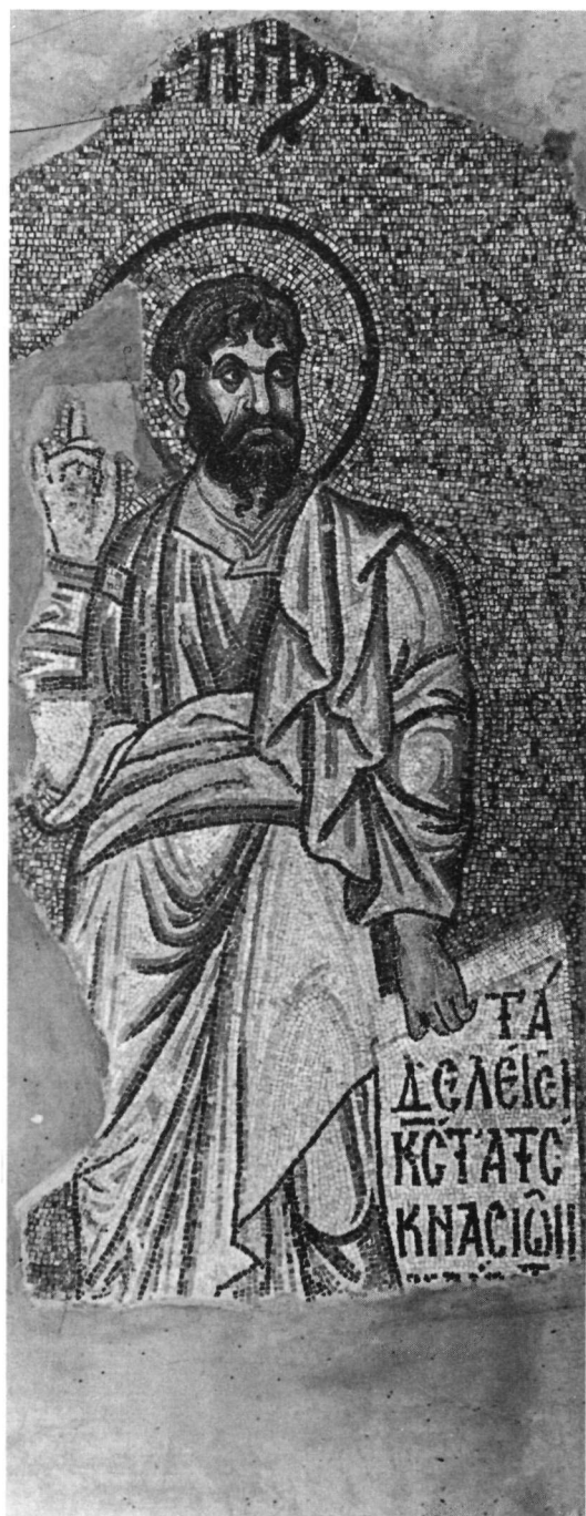
β. Δαφνί. Ὁ προφήτης Ἰωήλ.