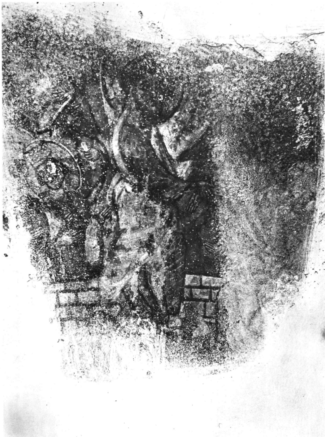
Ταξιάρχης στο Μαρκόπουλο. Ἡ εἰς Ἄδου Κάθοδος.