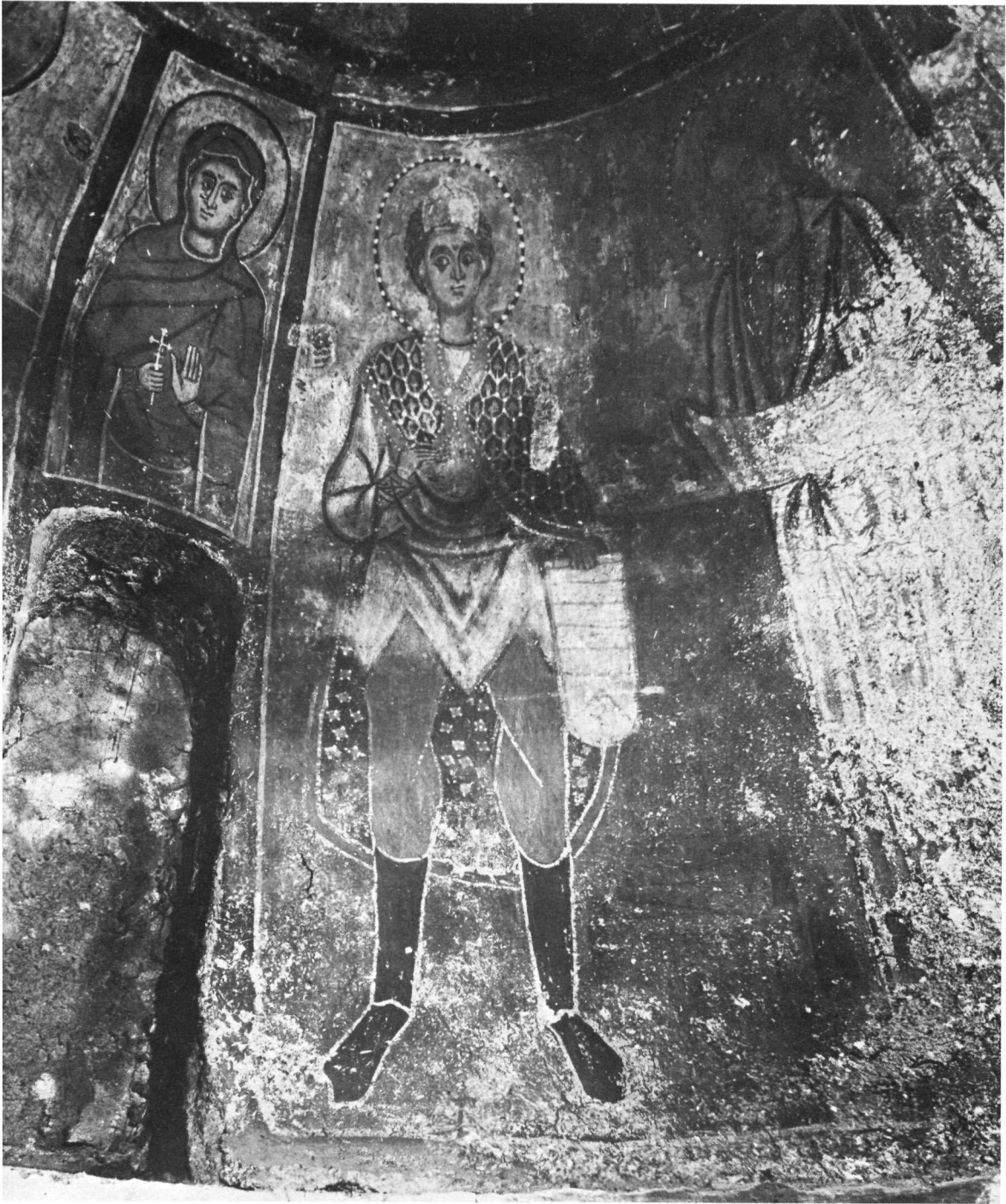
Ταξιάρχης στο Μαρκόπουλο. Ἐπὶ τῆ διακόσμηση τοῦ τρούλλου. Ἡ Ἁγία Θεοδότη καὶ οἱ προφῆτες Δανιὴλ καὶ Μαλαχίας.