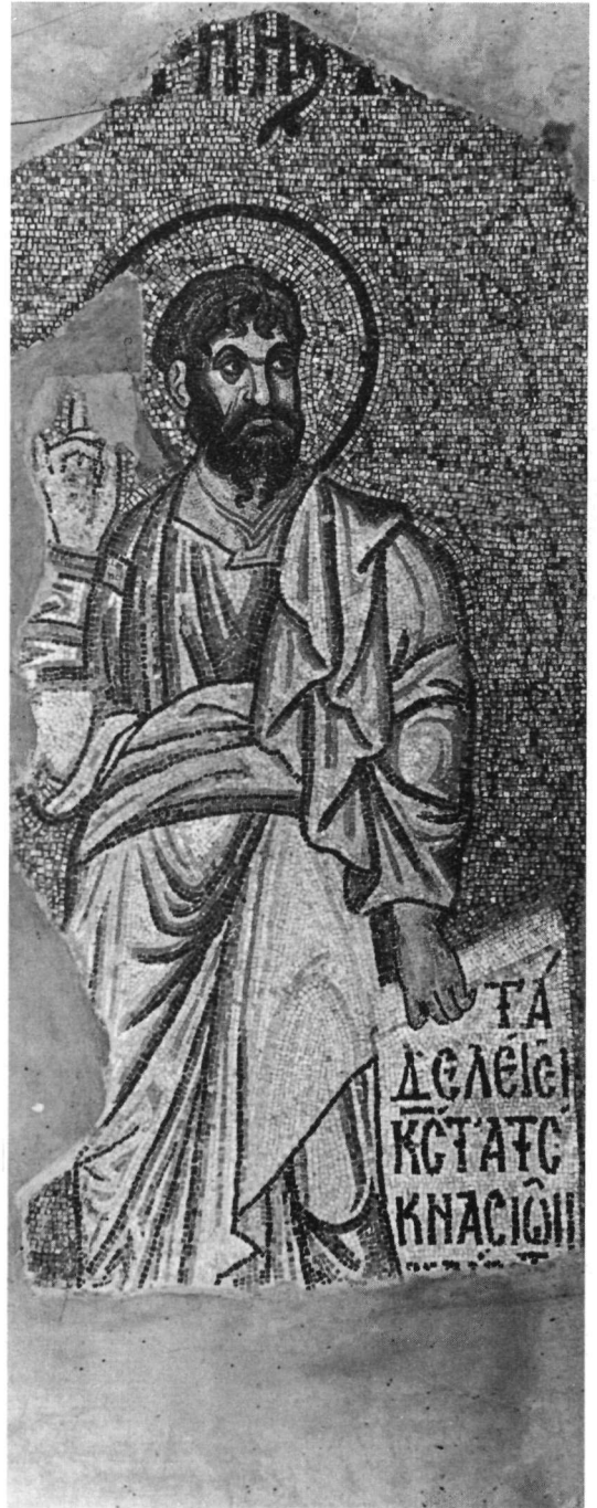
β. Δαφνί. Ὁ προφήτης Ἰωήλ.