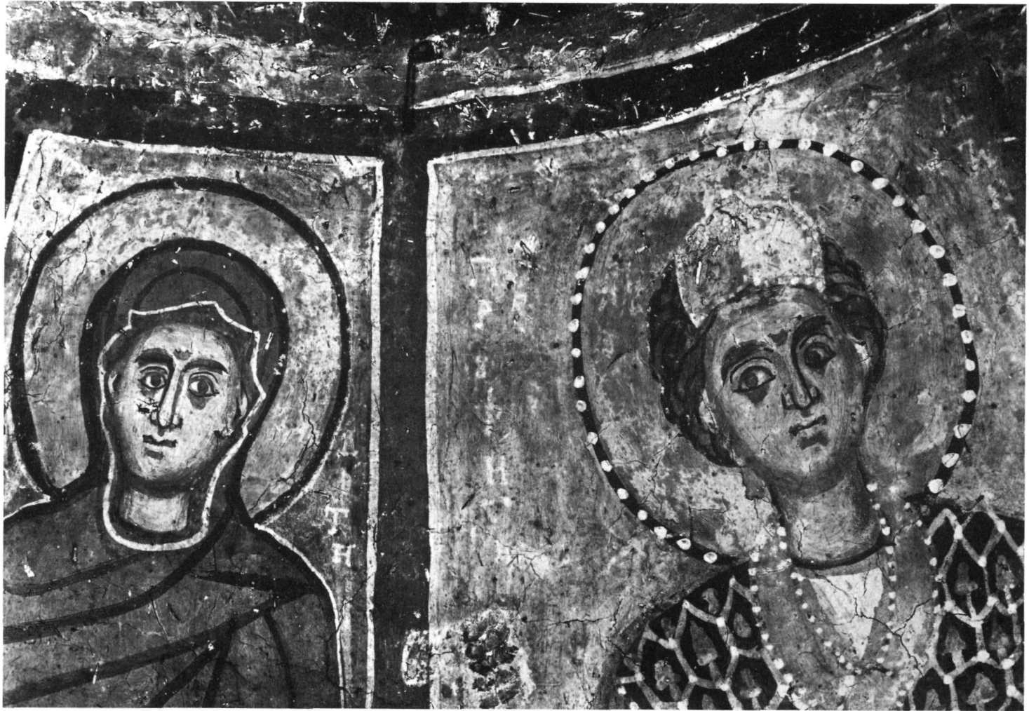
Ταξιάρχης στο Μαρκόπουλο. Ἡ Ἁγία Θεοδότη καὶ ὁ προφήτης Δανιήλ (λεπτομέρεια).