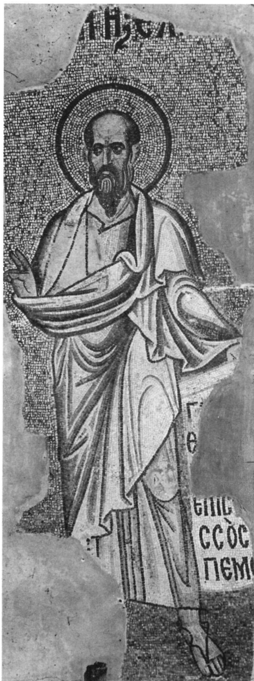
α. Δαφνί. Ὁ Προφήτης Ἐλισσαῖος.