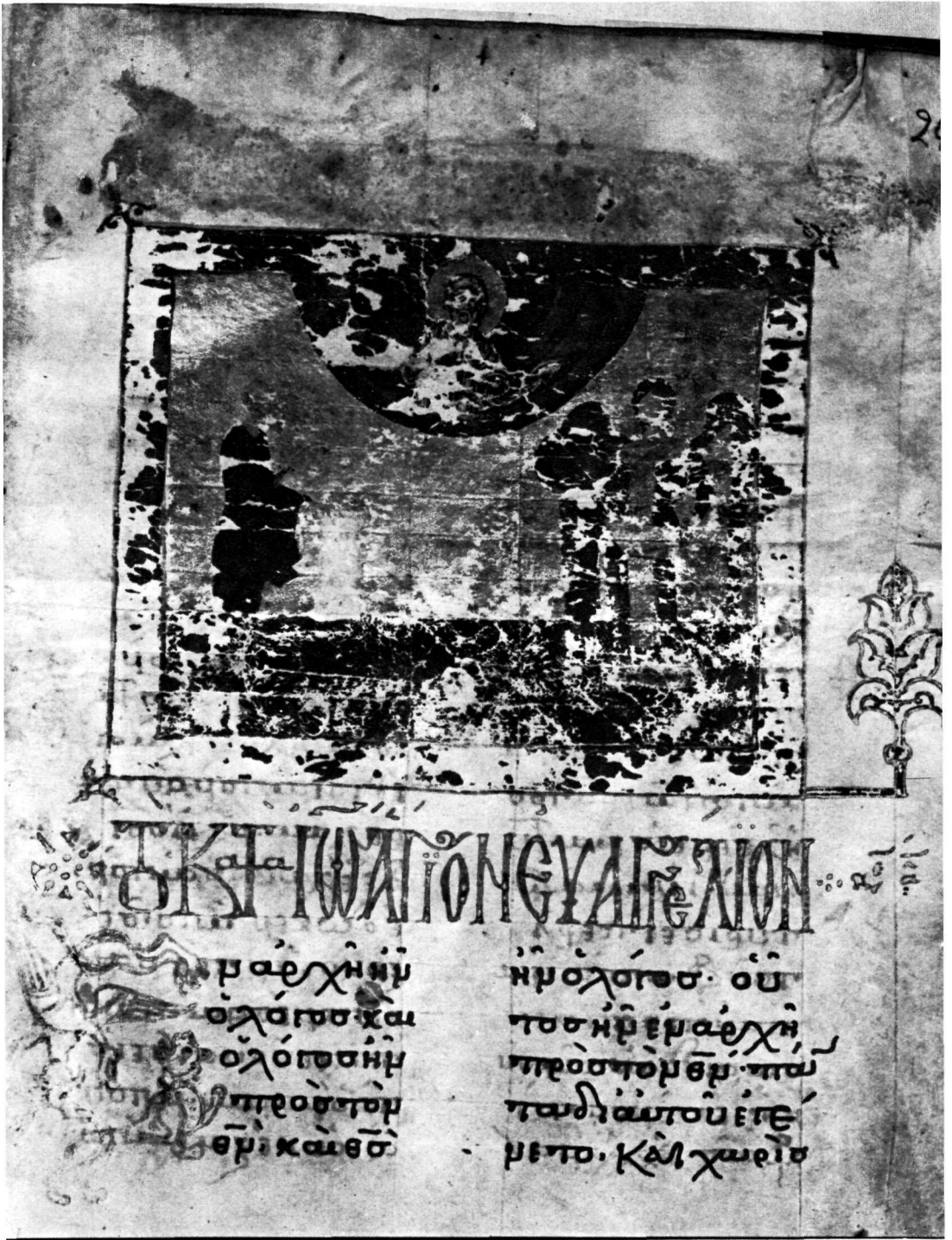
Τετραεὐάγγελιο Γυμνασίου Μυτιλήνης 9, φ. 243r.