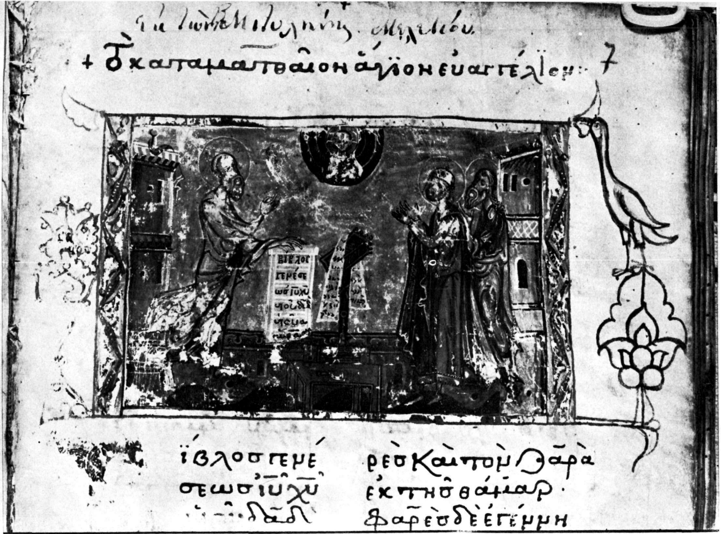
Τετραεὐαγγέλιο Γυμνασίου Μυτιλήνης 9, φ. 7r.