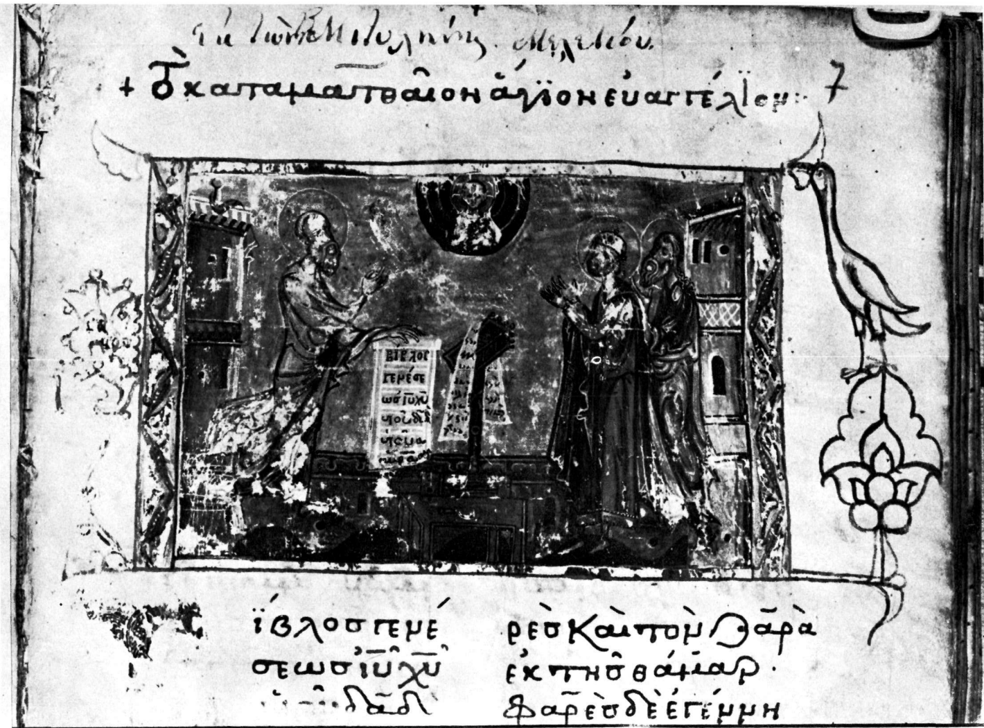
Τετραεὐαγγέλιο Γυμνασίου Μυτιλήνης 9, φ. 7r.