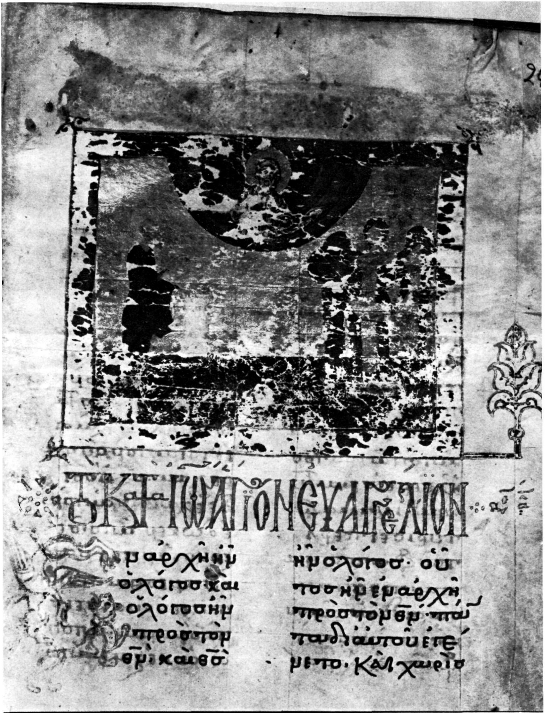
Τετραεὐάγγελιο Γυμνασίου Μυτιλήνης 9, φ. 243r.