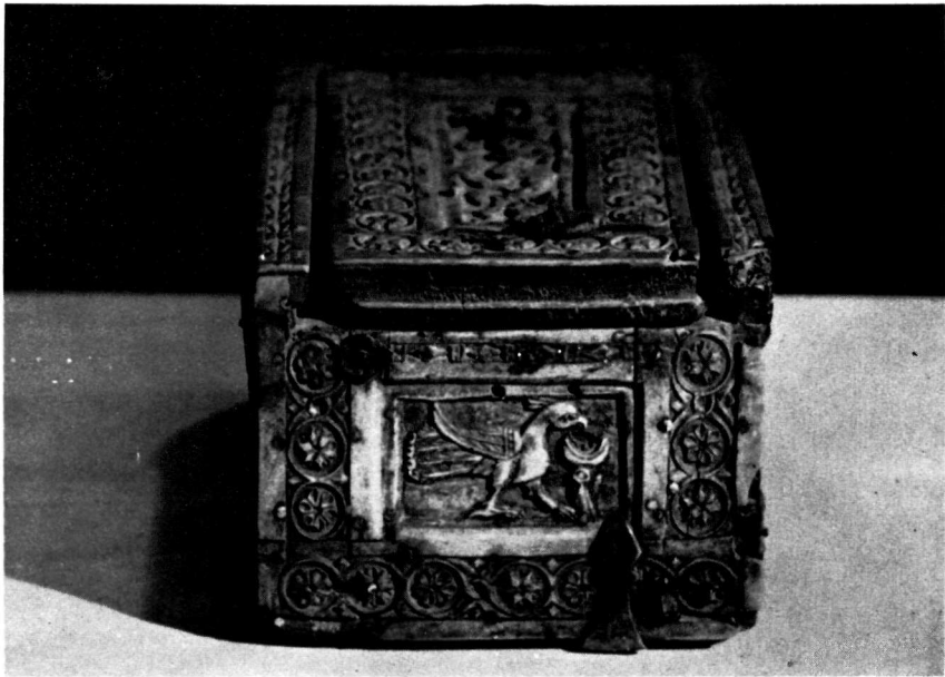
α. Ἡ δεύτερη μακριὰ πλευρά. Ἀριστερά, ζῶα πού τρέχουν καί δεξιὰ φτερωτοὶ γρύπες. β. Ἡ μικρὴ πλευρὰ μὲ τὸ παγῶνι πού πίνει ἀπὸ περιρραντήριο.