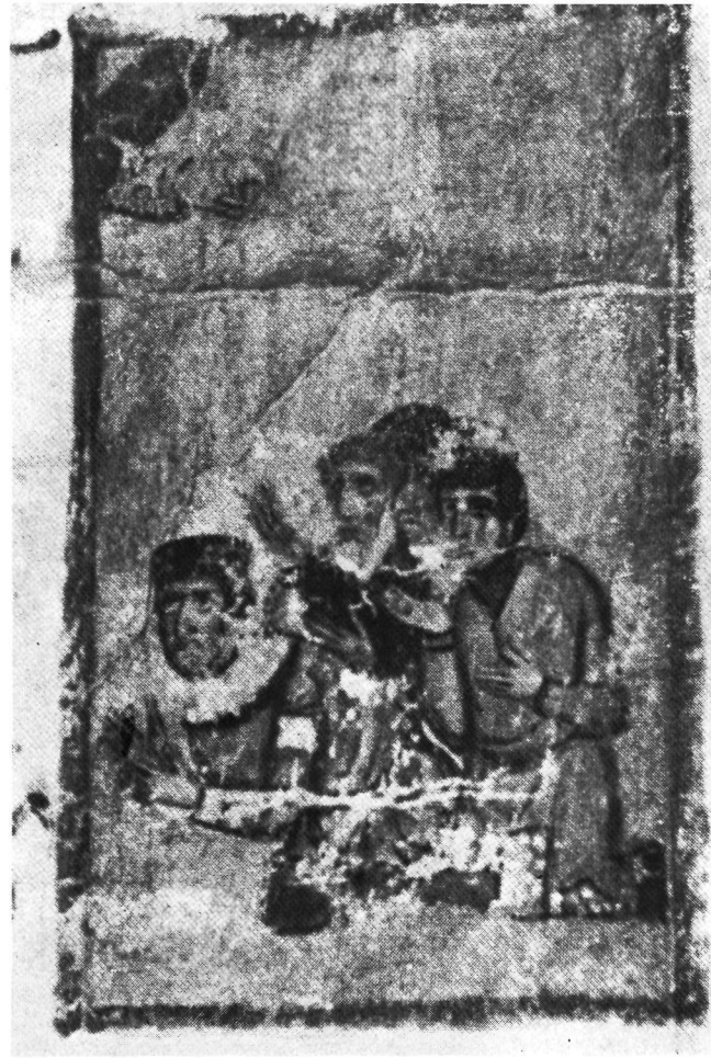
α. Λένινγκραντ, 'Ακαδημία τῶν Ἐπιστημῶν, κῶδ. Ι. β. Λένινγκραντ, 'Ακαδημία τῶν Ἐπιστημῶν, κῶδ. Ι.