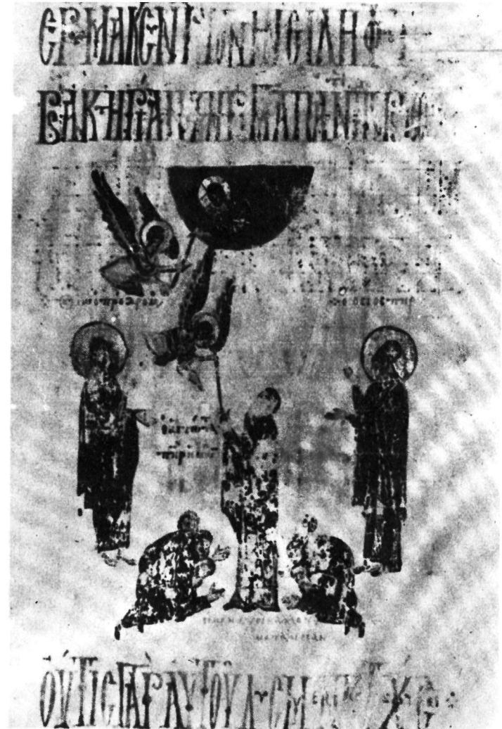
α. Λονδίνο, Βρετανικού Μουσείου κώδ. Add. 52, φ. 191v. β. Λονδίνο, Βρετανικού Μουσείου κώδ. Addit. 19352, φ. 192.