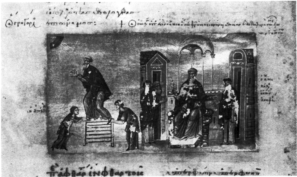
α. Vaticanus Gr. 394, φ. 17v. β. Vaticanus Gr. 394, φ. 78v.