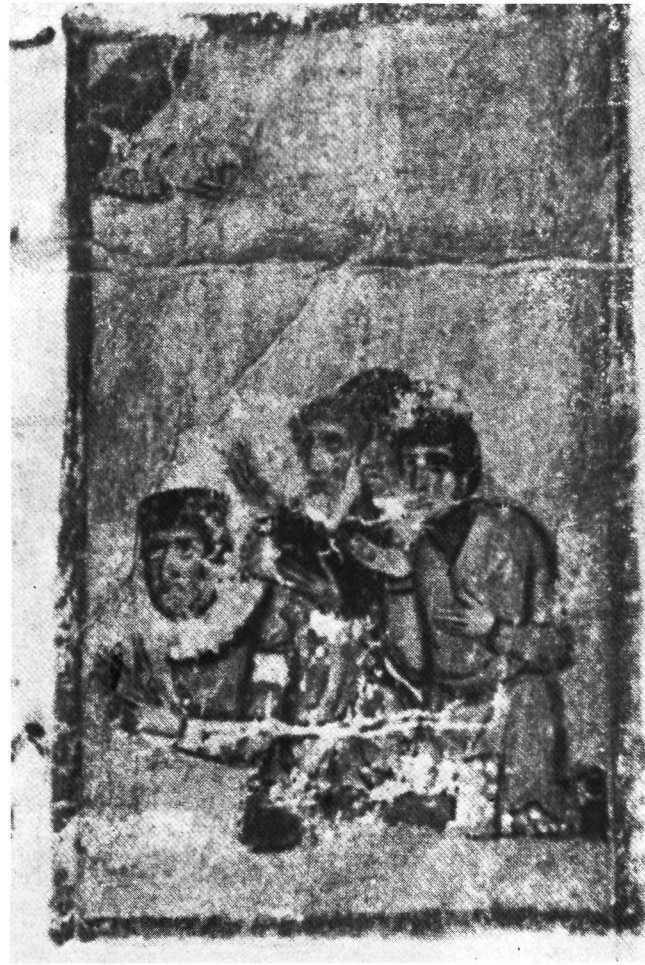
α. Λένινγκραντ, 'Ακαδημία τῶν Ἐπιστημῶν, κῶδ. Ι. β. Λένινγκραντ, 'Ακαδημία τῶν Ἐπιστημῶν, κῶδ. Ι.