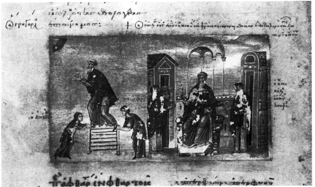
α. Vaticanus Gr. 394, φ. 17v. β. Vaticanus Gr. 394, φ. 78v.