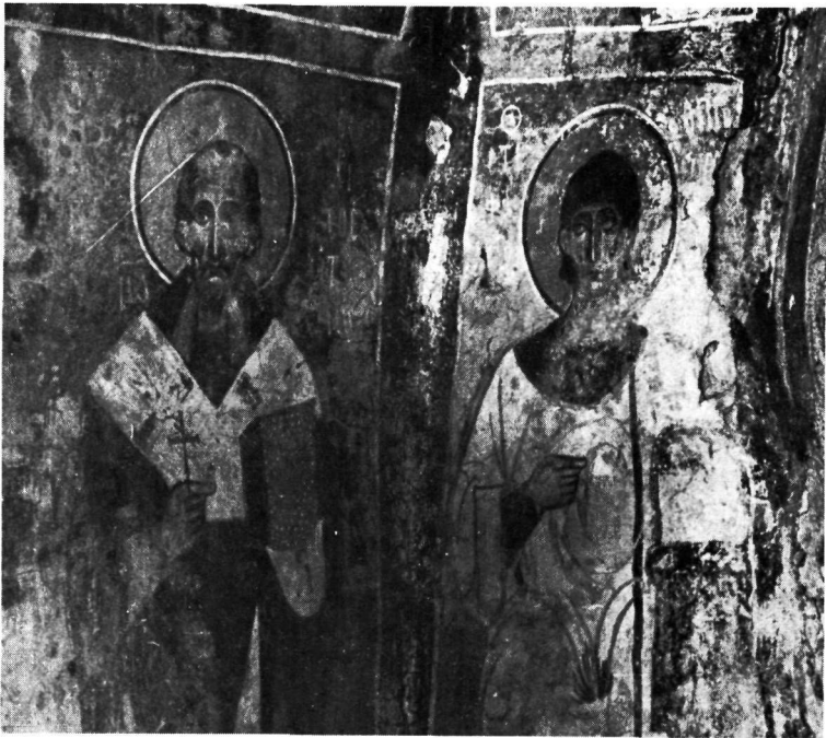
Άγιος Νικήτας Κηπούλας. α. Άρχων Μιχαήλ και υπόλειμμα Άγίου Μανδηλίου. β. Άγιος Χρυσόστομος και Στέφανος.