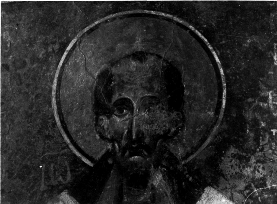
Άγιος Νικήτας Κηπούλας. α. Άγιος Στέφανος, λεπτομέρεια του Πίν. 65β. β. Χρυσόστομος, λεπτομέρεια του Πίν. 65β.