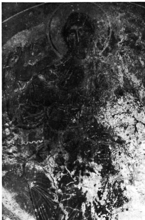
Ἅγιος Νικήτας Κηπούλας. Ἡ κεφαλὴ τῆς Πλατυτέρας. Ὁ Χριστὸς τῆς Ἀναλήψεως.