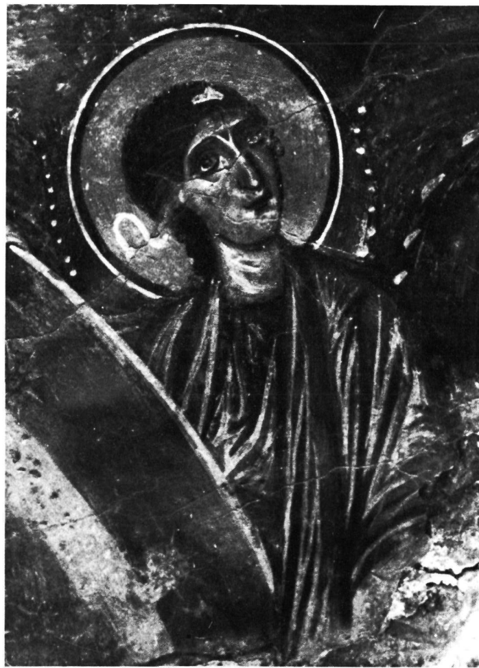
Άγιος Νικήτας Κηπούλας. α. Ὁ ΒΑ ἄγγελος τῆς Ἀναλήψεως. β. Ὁ ΒΑ ἄγγελος τῆς Ἀναλήψεως.