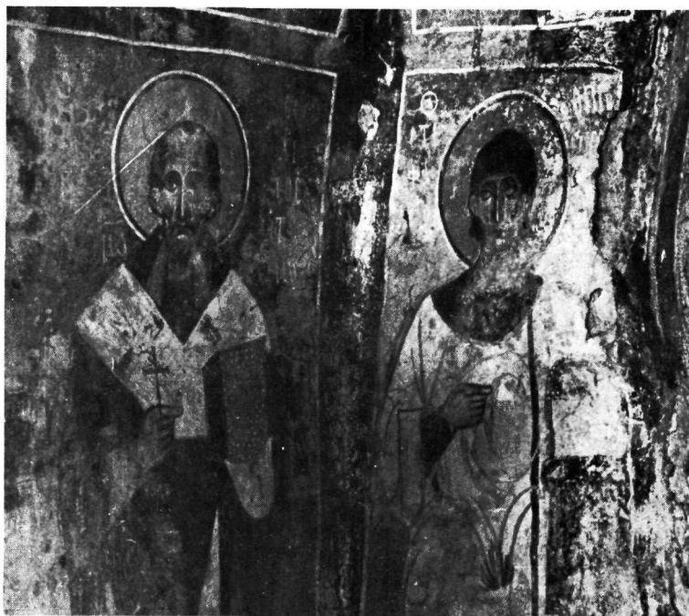
Ἅγιος Νικήτας Κηπούλας. α. Ἄρχων Μιχαήλ καὶ ὑπόλειμμα Ἁγίου Μανδηλίου. β. Ἅγιος Χρυσόστομος καὶ Στέφανος.