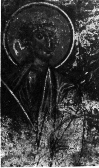
α. Άγιος Νικήτας Κηπούλας. Ὁ ΝΔ ἄγγελος τῆς Ἀναλήψεως.