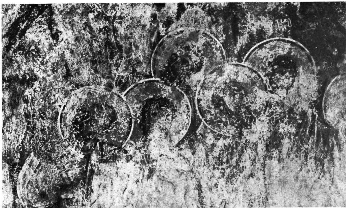
Ἅγιος Νικήτας Κηπούλας. α. Βόρειο ἡμιχόριο τῆς Ἀναλήψεως (ἐπάνω, κεφαλές Ἀποστόλων ἀπὸ τὴν Ἀνάληψη τοῦ α' στρώματος). β. Τὸ σωζόμενο τμήμα ἀπὸ τὸ νότιο ἡμιχόριο τῆς Ἀναλήψεως.