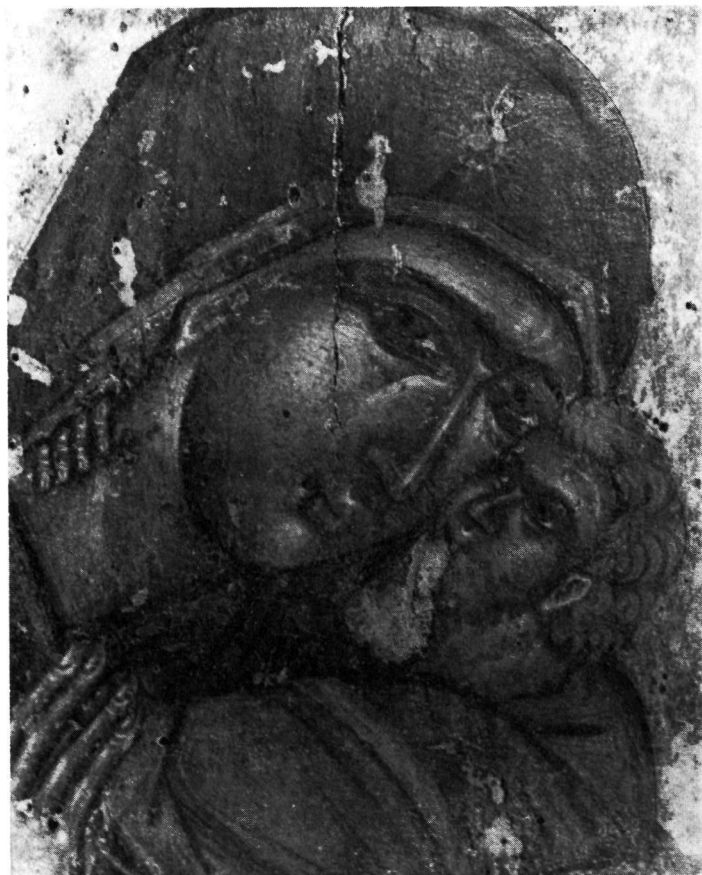
α. Καστοριά. Εικόνα Παναγίας Ἐλεούσας, λεπτομέρεια τῆς εἰκόνας τοῦ Πίν. 75α. β. Καστοριά. Συλλογή Εἰκόνων. Εικόνα Παναγίας Γλυκοφιλούσας (λεπτομέρεια).