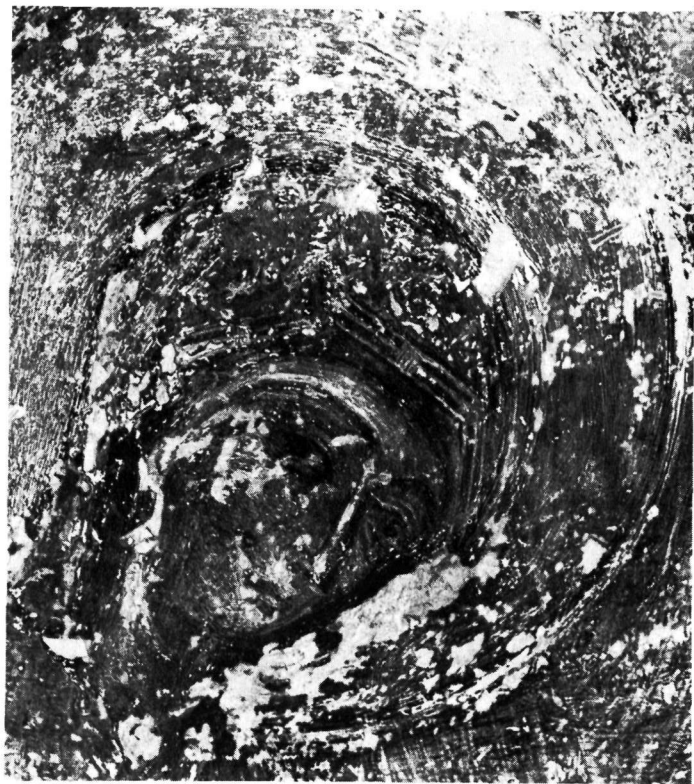
α. Καστοριά. Εικόνα Παναγίας Ἐλεούσας ἀπὸ τὸν ναὸ τῶν Ἁγίων Τριῶν. β. Καστοριά. Ναὸς Ἁγίων Τριῶν. Ἡ Παναγία ἀπὸ τὸ θέμα τῆς Δεήσεως (λεπτομέρεια τῆς τοιχογραφίας).