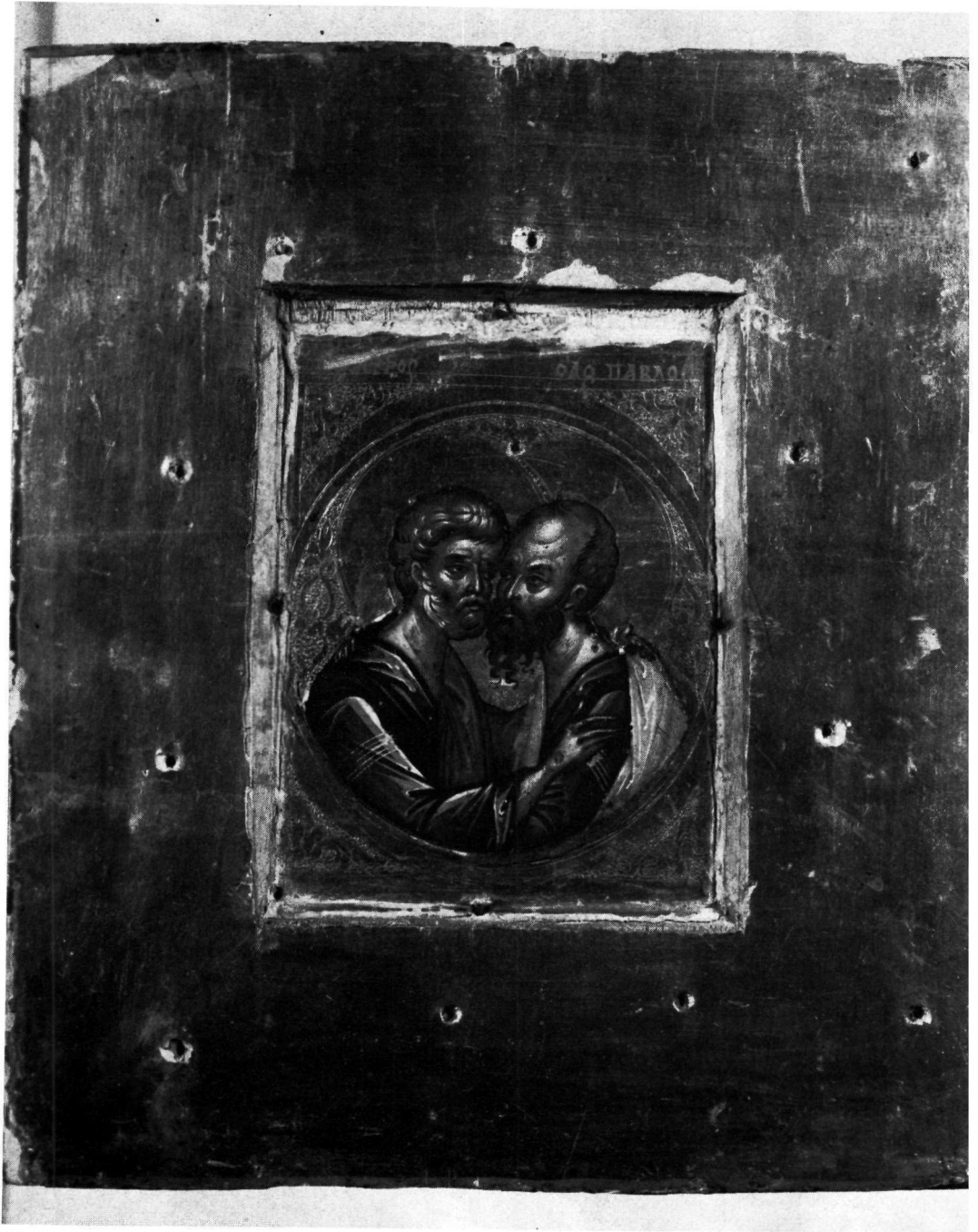
Die Apostel Petrus und Paulus, Wien, Kunsthistorisches Museum.