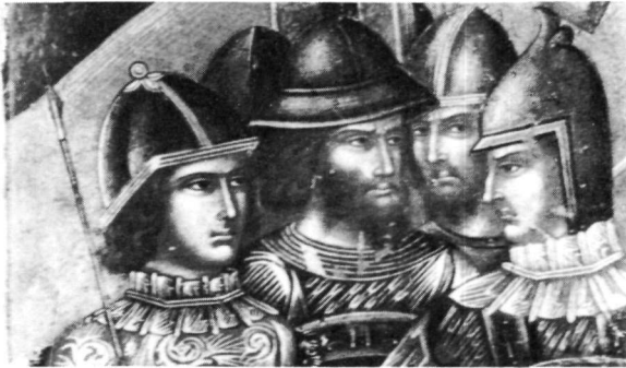
Είκ. 10. 'Ο Έλκόμενος. Εικόνα μέ ύπογραφή του Νικολάου Τζαφούρη στό Μητροπολιτικό Μουσείο της Νέας Υόρκης (λεπτομέρεια).

Πίσω από τούς στρατιώτες και άριστερά μονώροφο άρχιτεκτόνημα, μέ