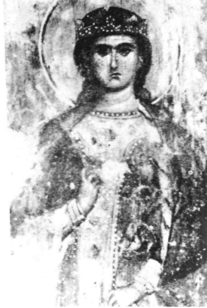
Εἰκ. 12. Ἁγία Αἰκατερίνα. Τοιχογραφία στήν Γκουβερνιώτισσα Κρήτης (λεπτομέρεια).

καί ἐπομένως στή θέση τοῦ δεύτερου ἐπεισοδίου, πού ἀκολουθεῖ τή σκηνή μέ τόν ἐρημίτη πρὸς τὰ δεξιὰ, θά πρέπει νά ἀναζητήσουμε μιὰ σκηνή ἀπό τίς τρεῖς τῆς συνάντησής της μέ τό Μαξέντιο. Τήν ἀποψη ἐνισχύει καί ὁ κίονας πού ἔρχεται ἀπό ἐσωτερικό χῶρο, ὅπως καί τό τμήμα πού σώζεται ἀπό τό σάρκωμα μηροῦ, πού δέν μπορεῖ νά εἶναι τίποτε ἄλλο ἀπό τό μηρό στρατιώτη πού φαίνεται κάτω ἀπό τόν κοντό χιτώνα του καί ὑπάρχει πάντα στή φρουρά τοῦ Μαξεντίου.