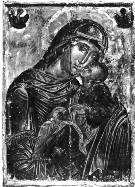
Εἰκ. 6. Εἰκόνα Παναγίας στό ναό τοῦ Προφήτη Ἡλία Χώρας Νάξου.

Ἀπό εικονογραφικό τύπο πού ἀποκρυσταλλώνεται στήν Κρήτη τό 15ο αἶωνα προέρχεται καί ἡ Παναγία τῆς μικρῆς εἰκόνας τοῦ ἐρημίτη, πού ἐπαναλαμβάνει τόν τύπο τῆς Γλυκοφιλούσας, ὅπως στήν εἰκόνα τοῦ Βερο-