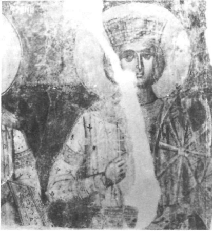
Εἰκ. 11. Ἁγία Αἰκατερίνα. Τοιχογραφία στήν Ἁγία Παρασκευή Ἀμαρίου Κρήτης (λεπτομέρεια).

Στήν εἰκόνα μας, πού οἱ σκηνές περιτρέχουν ἐπίσης τό κεντρικό θέμα, οἱ σκηνές θά πρέπει νά κινοῦνται διαδοχικά ἀπό ἀριστερά πρὸς τὰ δεξιὰ