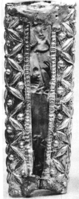
Fig. 3. La placchetta con S. Filippo Apostolo in forma di cilindro prima del restauro del 1954.

Osservando le fotografie fatte durante il restauro del 1954 (Fig. 2-3) 7 , possiamo avere un'idea del modo con cui la placchetta era applicata all'osso del braccio 8 . Nella foto in cui si vede la lamina incurvata in modo da formare un cilindro, si distingue un materiale che unisce gli angoli della placchetta. Bino Bini che ha partecipato al restauro ci ha spiegato che si tratta