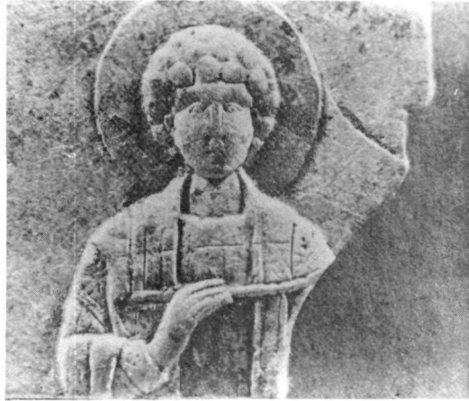
Fig. 5. Walters Art Gallery di Baltimora. San Pantaleimone.

Dopo l'analisi stilistica e la proposta di una datazione all'interno del XII secolo rimane il problema della definizione dell'ambiente artistico al cui appartiene la placca d'argento che appare però abbastanza problematico.