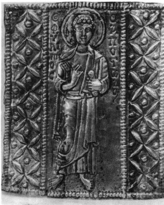
Fig. 2. La placchetta con S. Filippo Apostolo appianata durante il restauro del 1954.

simmetrica, cioè i gruppi dei petali non si collocano in maniera identica nei due lati. Immediatamente si potrebbe pensare ad un errore da parte dell'orefice, ma poi osservando bene la placchetta si scarta una tale ipotesi. Si può notare infatti una precisa uniformità nel motivo ornamentale dato dalla sua continuità: il disegno della parte destra continua infatti, nonostante la netta separazione, nella parte sinistra. L'unione delle due parti si nota tenendo presente lo schema del rombo formato dai petali: la composizione ornamentale della parte destra comincia con un mezzo rombo, che si conclude nell'altro mezzo con cui inizia la parte sinistra. Il materiale con cui è stata fatta questa lamina è, come si è già detto, argento dorato; essa è stata prima sbalzata e poi finita a cesello.