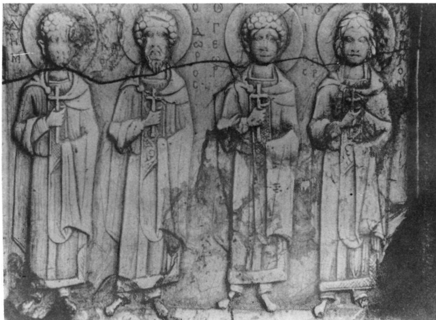
Fig. 4. Museo del Louvre. San Demetrio, San Teodoro, San Giorgio e San Procopio.

Damiano 28 , nel dipinto su seta con San Giusto nella cattedrale di Trieste 29 e infine nel volto di San Demetrio di Salonicco 30 di una icona bizantina appartenente alla Tretiakov Galerie di Mosca, opera attribuita alla fine del XII secolo. In tutta questa serie di opere si può distinguere l'inizio, il cul-