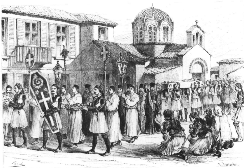
Είχ. 2. Χαρακτικό του C. Laplante από σχέδιο του Sahid, με παράσταση της κηδείας του επισκόπου Θηβών και Λεβαδείας Ἀβραμίου Ἀναγνώστου († 1858) από τήν ἐκκλησία τῆς Παναγίας τῆς Λειβαδιάς.

νά ἔχει μετατραπεί σέ τζαμί 21 . Γιά καμιά ὁμως ἀπ' αὐτές δέν προσδιορίζουν τήν ἀκριβή της θέση.