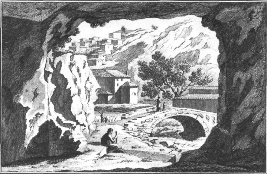
Εικ. 4. Χαρακτικό σχεδίου του Sim. Pomardi, που έχει γίνει από τό εσωτερικό του λαξευτού στο βράχο θαλάμου λατρευτικών δειπνών ή μυστικών ιεροπραξιών, στο χώρο του ιερού του Τροφονίου. Παριστάνεται τμήμα της κοίτης της Έρχυνας και περιοχή της πόλης κοντά στην εκκλησία της Παναγίας.

πρέπει νά χρησιμοποιούσαν κάποια άλλη, όσοδήποτε μικρή αλλά μέσα ή κοντά στό κέντρο της πόλης, προκειμένου μάλιστα για τήν τέλεση της κηδείας ενός επίσημου προσώπου. Τήν ιδιότητα όμως του τελευταίου φανερώνει μιá προσεκτική παρατήρηση του εικονιζόμενου από τόν Sahib νεκρού. Πράγματι, βλέπει κανείς ότι φέρει μίτρα. Δέν υπάρχει καμιά, πιστεύω, αμφιβολία ότι πρόκειται για τόν επίσκοπο Άβράμιο Άναγύρου (1852-1858), που πέθανε στά 1858 37 , πριν συνεπώς προλάβει νά εγκαινιάσει τό μητροπολιτικό ναό, στόν όποιο καί θά είχε γίνει ή κηδεία του, αν τυχόν καί είχε τελειώσει νωρίτερα. Είναί φανερό ότι ό Sahib βρέθηκε ή στάλθηκε στή Λειβαδιά ακριβώς τήν ήμέρα της κηδείας του Θηδών και Λεβαδείας και, κατά συνέπεια, ή εκκλησία που περιλαμβάνεται στό σχέδιό του παριστάνε-