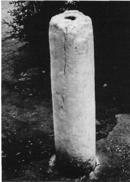
Είκ. 6. Λειβαδιά. Μαρμάρινος κορμός κολόνας από την εκκλησία της Παναγίας, όρθια στερεωμένος στην επίχωση άνδηρου, μπροστά στη δυτική πλευρά της εκκλησίας της Παλιάς Παναγίας.

του καλλιτέχνη, πού μάταια προσπάθησε νά διορθώσει, εκ τῶν ὑστέρων, καθώς ἐμπλέκονται οἱ γραμμές τοῦ τελευταίου μέ τμήματα τῆς βόρειας πλευρᾶς τῆς ἐκκλησίας τῆς Παναγίας. Ἔχουμε, λοιπόν, ἔτσι καί μιᾶ ἀκόμη ἐπιβεβαίωση τῆς ἀκριβοῦς θέσης στήν ὁποία βρισκόταν τό μεσοβυζαντινό μας μνημεῖο.