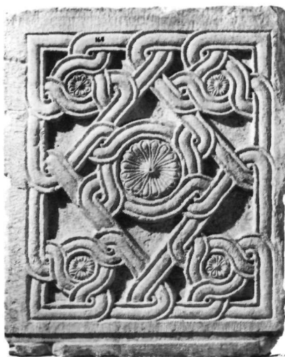
Εἰκ. 7. Ἀθήνα. Βυζαντινὸ Μουσεῖο. Ἦδη μέ τό διακοσμητικό ἀνάγλυφο τοῦ θωρακίου ἀριθ. 164.

δειακό μνημεῖο. Τή σκέψη αὐτή ἐνισχύουν οἱ εἰδήσεις ὅτι, μέσα στήν πόλη, ὑπῆρχε ἓνα μετόχι τῆς μονῆς. Ἡ ἀρχαιότερη μνεῖα του ἀνάγεται στό ἔτος 1686, ὅταν μιά ἀπόφαση (χοντζέτι) τοῦ ἱεροδικείου τῆς Λειβαδιάς ἐπιτρέπει, τόν καιρό αὐτό τῶν ἀναστατώσεων καί τῆς ἀνασφάλειας τῆς ὑπαίθρου πού συνοδεύει τά πολεμικά γεγονότα τῆς κατάκτησης Μογosiνι, τήν ἐγκατάσταση μεγάλου μέρους τῶν πατέρων τῆς μονῆς μέσα στό λεβαδειακό μετόχι