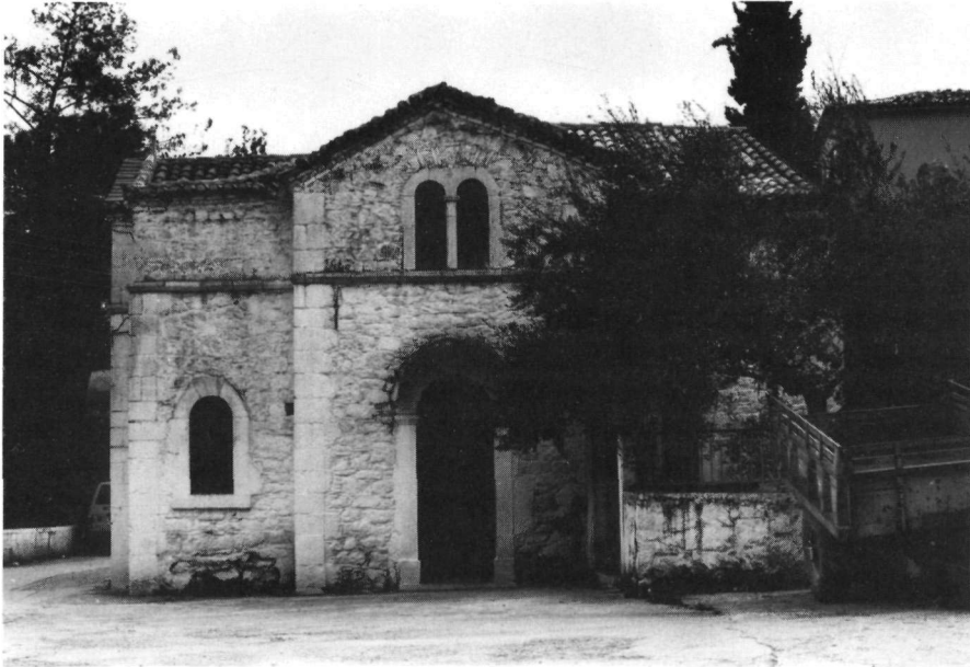
Εικ. 5. Λειβαδιά. Ἡ νότια πλευρά τῆς ἐκκλησίας τῆς Παλιᾶς Παναγίας.

ται ὅπως ἀκριβῶς ἦταν στά 1858, ἓνα κτίριο δηλαδή σῶο καί ἀκέραιο χωρίς ἴχνη ρωγμῶν ἢ ἄλλων βλαβῶν. Ἡ γενική του μορφή, σέ συνδυασμό πρὸς ὅσα προαναφέρθηκαν δέν ἀφήνει ἀμφιβολίες ὅτι τό εἰκονιζόμενο κτίριο ταυτίζεται πρὸς τόν «ἀρχαῖο ναό» τοῦ Λαμπάκη, πού βρισκόταν «παρά τό Τροφώνιον», τῆ μικρῆ αὐτῆ ἀλλά ἐντυπωσιακῆ χαράδρα, τὴν ὁποία διασχίζει ἡ Ἔρκυνα, τό ποτάμι τῆς Λειβαδιάς, πού ἔχει ἐκεῖ ἀκριβῶς καί τίς πηγές του καί ὅπου ὑπῆρχε καί τό παρόχθιο ἱερό καί ἄλσος τοῦ Τροφωνίου 38 , τὴν περιοχὴ δηλαδή τῆς «Κρύας» 39 , τόσο κοντινὴ ἄλλωστε στό Σταροπάζαρο καί τὴ θέση τῆς ἀνεγειρόμενης τότε ἐκκλησίας τῶν Εἰσοδίων (Εἰκ. 3). Τί εἶχε