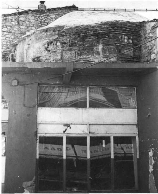
Εἰκ. 8. Λειβαδιά. Ἀποψη τοῦ τυμπάνου καὶ τοῦ τρούλου τοῦ κεντρικοῦ χώρου τοῦ τζαμιῦ τοῦ Γαζή Ὁμέρ Μπέη.

καθαρά ἀπὸ τὸ σχετικό ἔγγραφο πού προαναφέρθηκε 63 καὶ αὐτὸ δείχνει ὅτι λειτουργοῦσε μόνο περιπτωσιακά γιὰ νὰ χρησιμοποιηθεῖ ὡς ὁ μοναδικός ναός τοῦ κέντρου τῆς πόλης κατὰ τὸ διάστημα τῆς κατασκευῆς τοῦ μητροπολιτικοῦ ναοῦ. Οἱ ἐνδείξεις εἶναι, νομίζω, ἀρκετές γιὰ νὰ ἐδραιώσουν τὸ συμπέρασμα ὅτι ἡ Παναγία ἦταν ἀνέκαθεν ἓνα μετόχι τοῦ μεγάλου γειτονικοῦ μοναστηριοῦ καὶ ἐξαρτιόταν, ὅπως ὅλα τὰ μετόχια, ἀπὸ τὴν κεντρική μονή. Ἡ τελευταία διατηροῦσε κάποια κτηματική περιουσία κοντὰ σ' αὐτό, στὴν προκειμένη περίπτωση στὴ Λειβαδιά ἢ τὴν ἀμέσως γειτονική περιοχή της, σκέψη πού ἐνισχύει ἄλλο ἔγγραφο τοῦ ἱεροδικείου τῆς πόλης, τοῦ ἔτους 1612, ἀπὸ τὸ ὁποῖο προκύπτει ὅτι τὸ μοναστήρι εἶχε κάποιο χρέος στό ἴδρυμα (δακούφι) τοῦ «Σεῖχ Ὁμέρ» 64 . Ἡ ἴδρυση τοῦ μετοchioῦ αὐτοῦ στὸν 11ο αἰ. θὰ πρέπει νὰ εἶχε ὑπαγορευθεῖ ἀπὸ τὴ σημασία τῆς Λειβαδιάς, πού θὰ εἶχε ἀναδειχθεῖ στό σημαντικότερο πλησιέστερο πρὸς τὴ μονή πόλισμα.