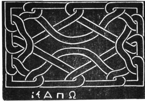
Εικ. 1. Σχέδιο αποτύπωσης μαρμάρινης πλάκας θωρακίου από τό τέμπλο τῆς ἐκκλησίας τῆς Παναγίας στή Λειβαδιά (Γ. Λαμπάκης).

μιᾶς ἀπλῆς, ὀρθογωνικῆς διατομῆς (:) ταινίας, πού δημιουργεῖ ἕνα μεγάλο ρόμβο καί δύο ἐφαπτόμενα στό μέσο του μεγάλα ἡμικύκλια μέ καμπυλωμένα ἄκρα, τά ὁποῖα, ὅπως καί οἱ γωνίες τοῦ ρόμβου, δένονται μέ κόμπους σ' ἕνα ὀρθογωνικό πλαίσιο πού σχηματίζεται ἀπό τήν ἴδια αὐτή ταινία.